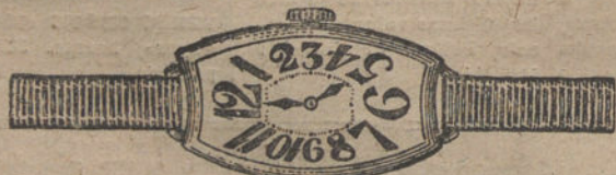
Núm. 3.—"Tonneau" curvado, áncora de forma, oro de ley 18 quilates, con pulsera de moiré. Pesetas 170.