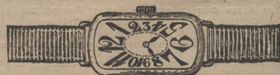
Núm. 4.—Áncora de precisión, 16 rubíes, oro de ley 18 quilates, con pulsera de moiré. Pesetas 175.