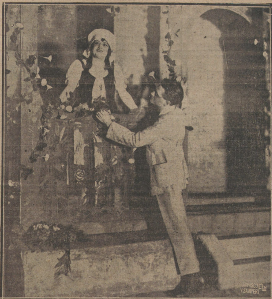
Una escena de «La amazona del antifaz», opereta estrenada ésta tarde en el teatro Apolo.