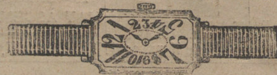
Núm. 5.—Rectangular, áncora de forma, oro de ley 18 quilates, con pulsera de moiré. Pesetas 200.