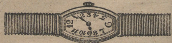
Núm. 6.—"Tonneau" áncora de precisión, oro de ley 18 quilates, con pulsera de moiré. Pesetas 250.