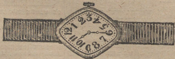
Núm. 1.—Rombo, máquina fina sobre rubíes, oro de ley 18 quilates, con pulsera de moiré. Pesetas 110.

Garantía efectiva de buena marcha por cinco años