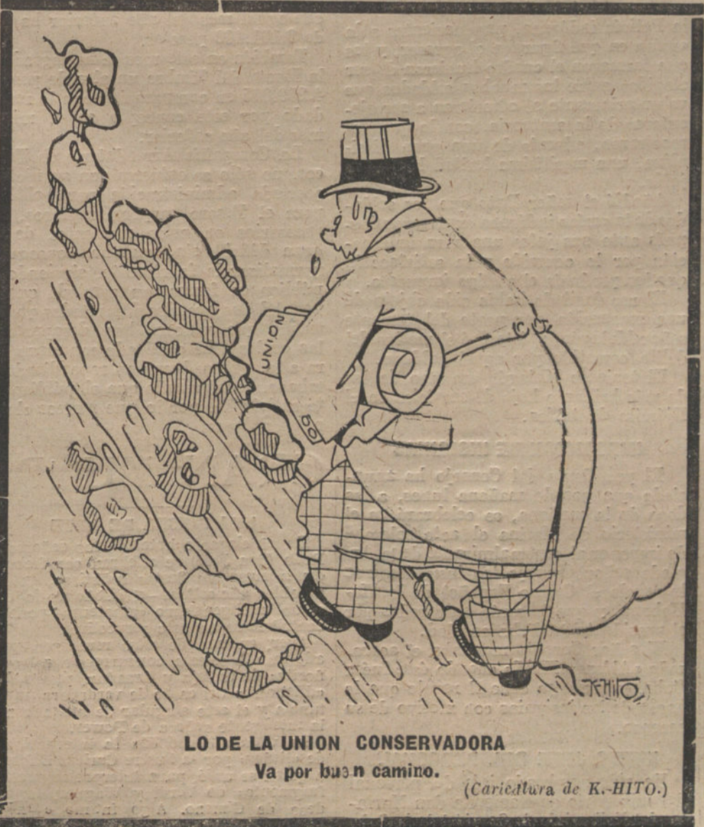
LO DE LA UNION CONSERVADORA

Por último, se dice—y se dice por gente que merece todo crédito—que el nuevo Gobierno americano enviará a la Conferencia de Londres, hacia el día 8 de marzo, una nota sensacional, que ha de influir poderosamente sobre la política de los aliados, y que modificará de una manera inesperada la aplicación del Tratado de Versalles.