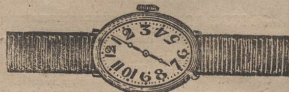
Núm. 2.—Ovalado, áncora de precisión, oro de ley 18 quilates, con pulsera de moiré. Pesetas 140.