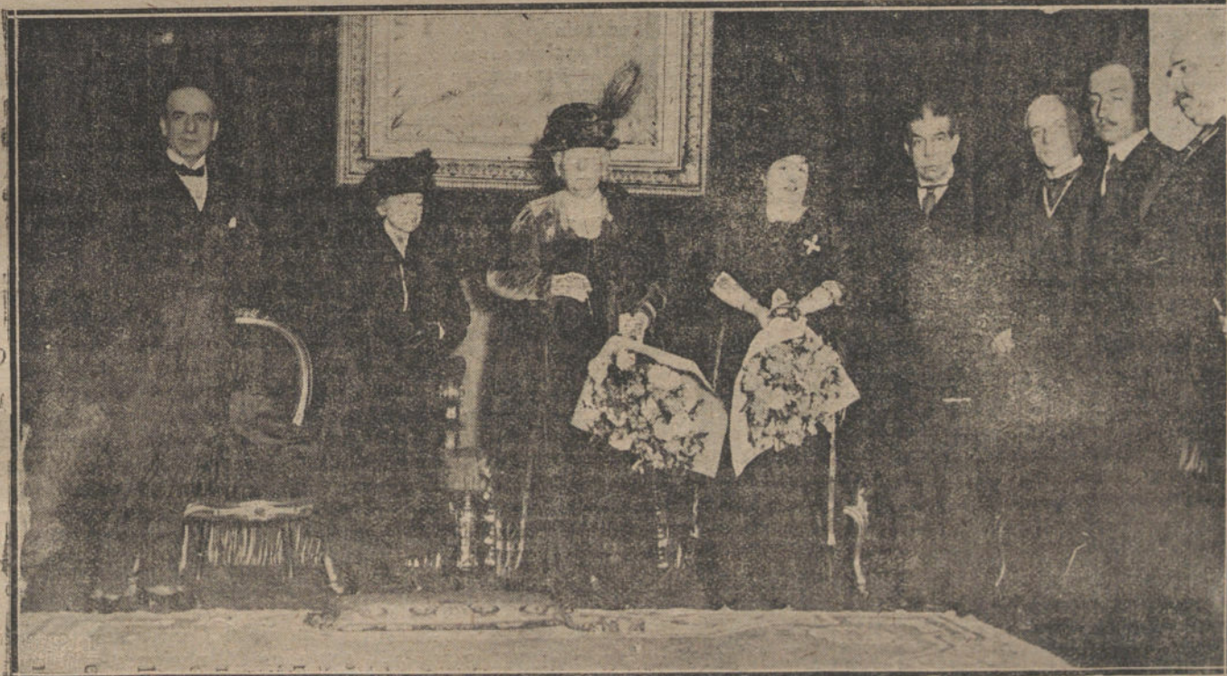
La ilustre doctora Paulina Luisi al terminar su conferencia dada ayer tarde en la Academia de Jurisprudencia.

La conducción del cadáver se ha efectuado esta mañana en la predicha ciudad.