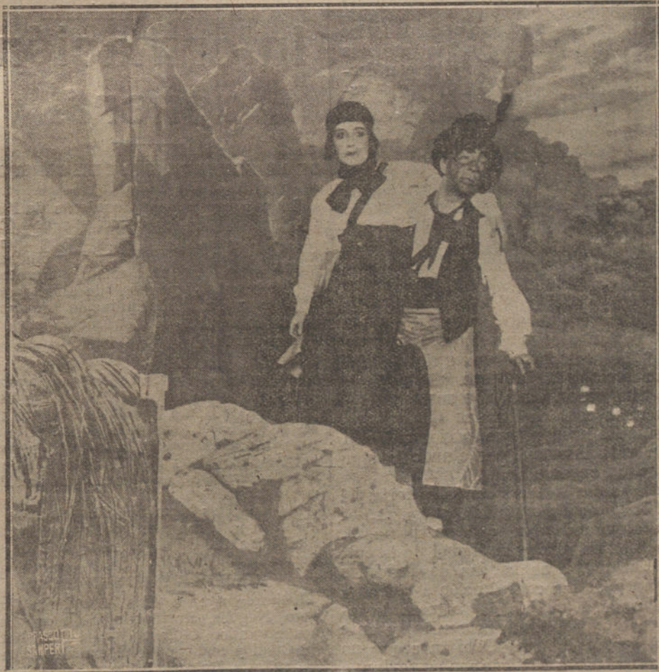
Una escena de «Los hombrécitos», obra que se estrena esta noche en el teatro de Novedades.

Desayuno: Café con leche y pan. Comida. —Sopa de sémola con pan frito cocido a la madrileña y pescadilla en abanico. Postre: Requesón del tiempo.