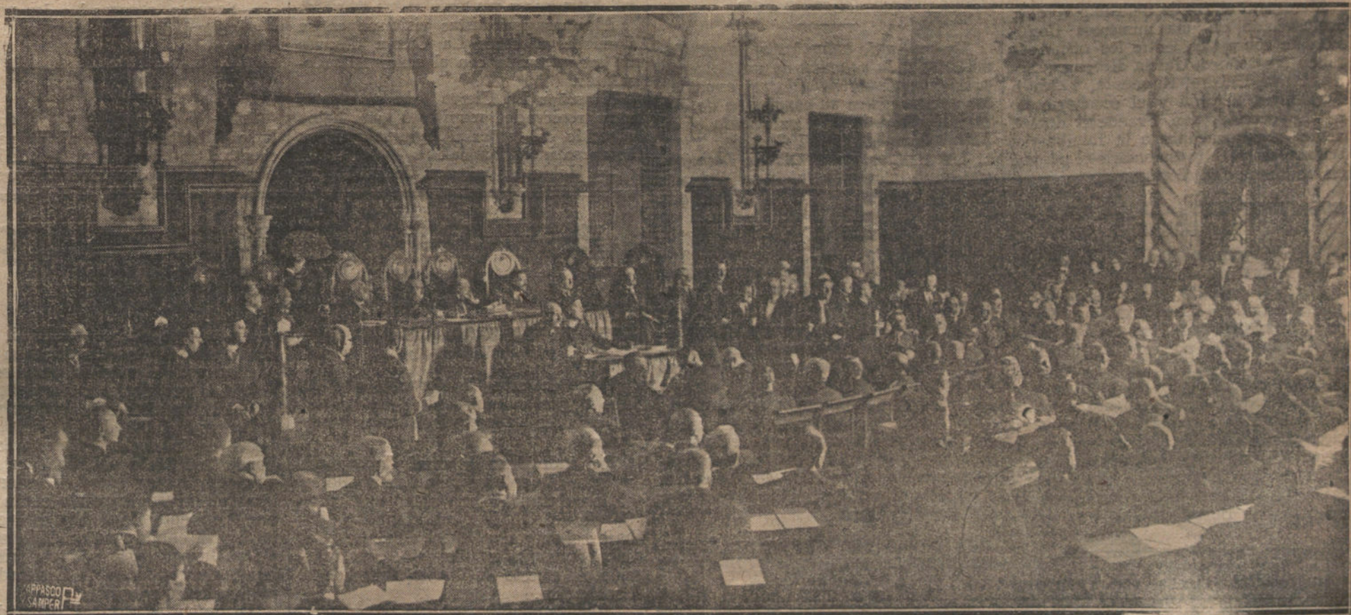
Aspecto del Salón de Ciento de Barcelona durante la sesión inaugural de la Conferencia Internacional de comunicaciones y tránsito.