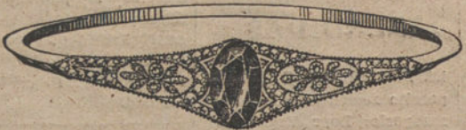
Núm. 7.—4 brillantes, diamantes y zafiro. Pesetas 475.