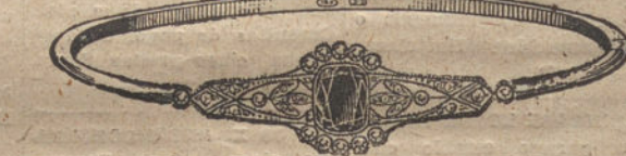
Núm. 6.—14 brillantes, diamantes y zafiro. Pesetas 450.