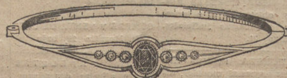
Núm. 2.—6 brillantes y zafiro. Pesetas 250.