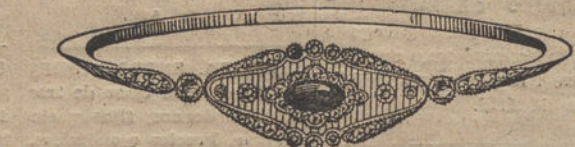
Núm. 8.—12 brillantes, diamantes y zafiro. Pesetas 650.