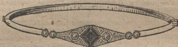
Núm. 3.—6 brillantes, diamantes y zafiro. Pesetas 300.