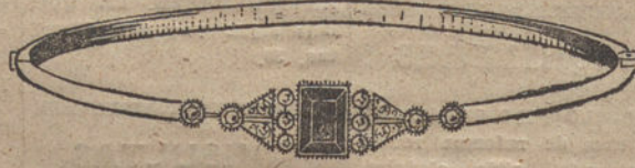
Núm. 4.—10 brillantes, diamantes y zafiro. Pesetas 350.