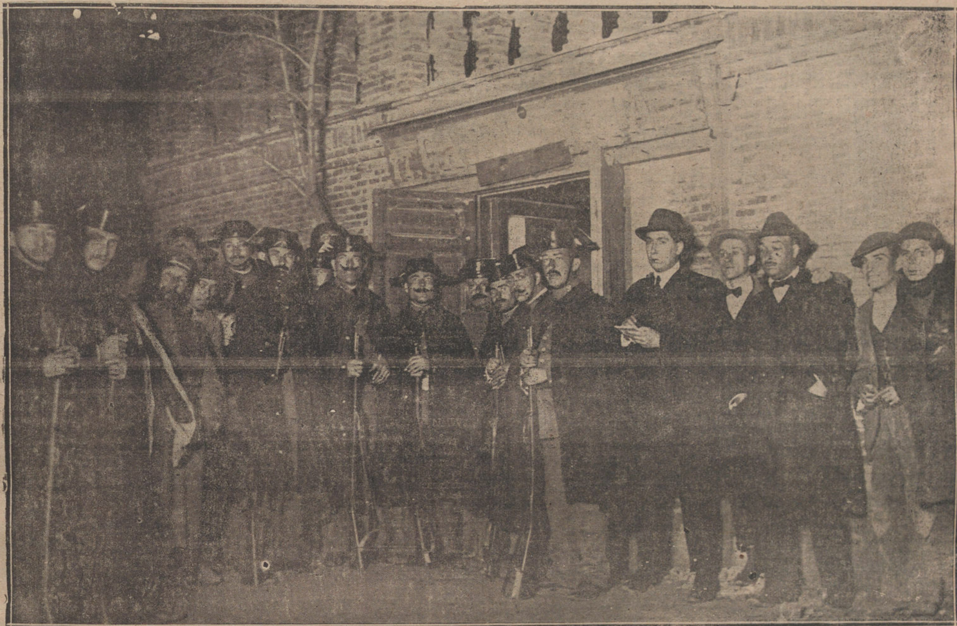
La Guardia civil ante la casa número 77 de la calle de Arturo Soria, de la Ciudad Lineal, donde ha sido encontrada la motocicleta que ocupaban los asesinos del señor Dato.

Una declaración importantísima que descubre todos los preparativos del crimen