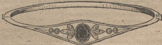
Núm. 1.—4 brillantes, diamantes y zafiro. Pesetas 225.

Con brillantes de primera calidad :: Diamantes rosas de Holanda :: Zafiros finos garantizados :: Monturas de platino fino y oro de ley 18 quilates