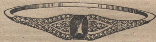
Núm. 5.—2 brillantes, diamantes y zafiro. Pesetas 390.