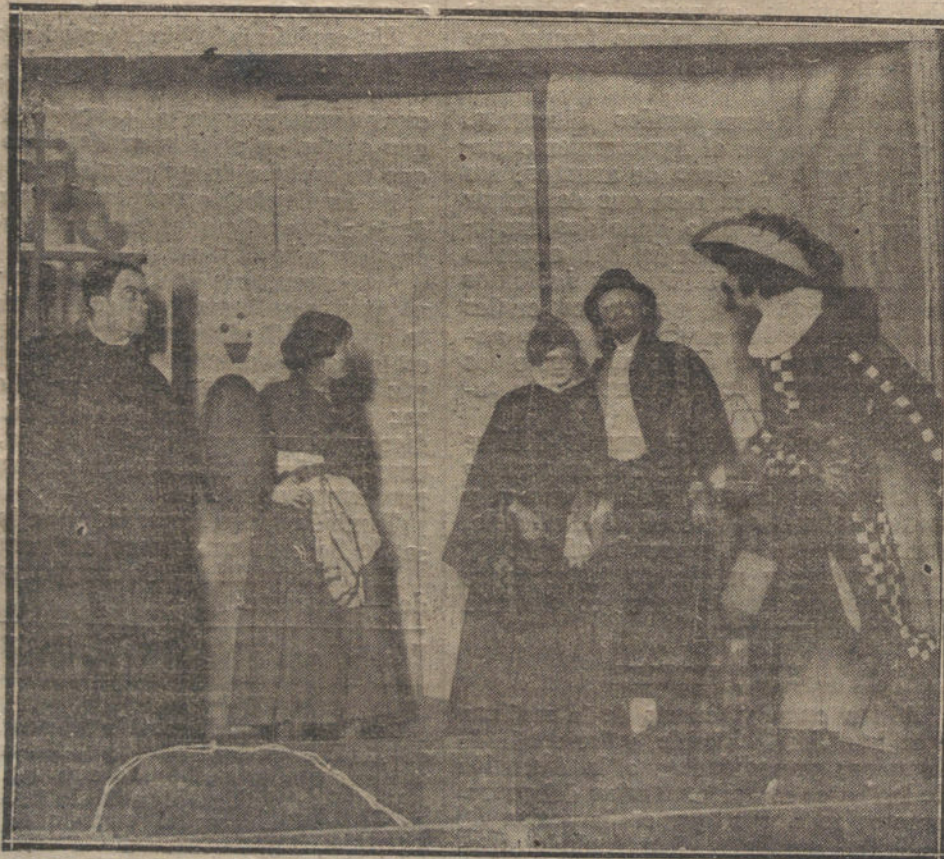
Una escena del entremés «La guardia cuidadosa», representado en el Ateneo por jóvenes de la Escuela la Nueva.