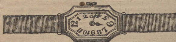
Núm. 6.—Áncora de precisión, oro de ley 18 quilates, con pulsera de moiré. Pesetas 325.