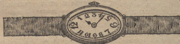
Núm. 4.—Ovalado, áncora de forma, oro de ley 18 quilates, con pulsera de moiré. Pesetas 275.