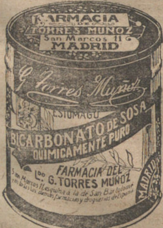
LATAS ECONOMICAS DE 1 1/2 KILOS