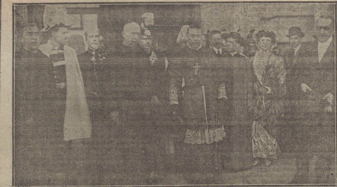
El cardenal Benlloch, arzobispo de Burgos, al salir del Palacio después de haberle sido impuesta la birreta cardenalicia.

La esposa del ilustre fallecido está recibiendo, desde su llegada a Madrid, inequivocas muestras del profundo senti-