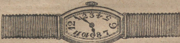
Núm. 3.—«Tonneau», áncora de precisión, oro de ley 18 quilates, con pulsera de moiré. Pesetas 250.