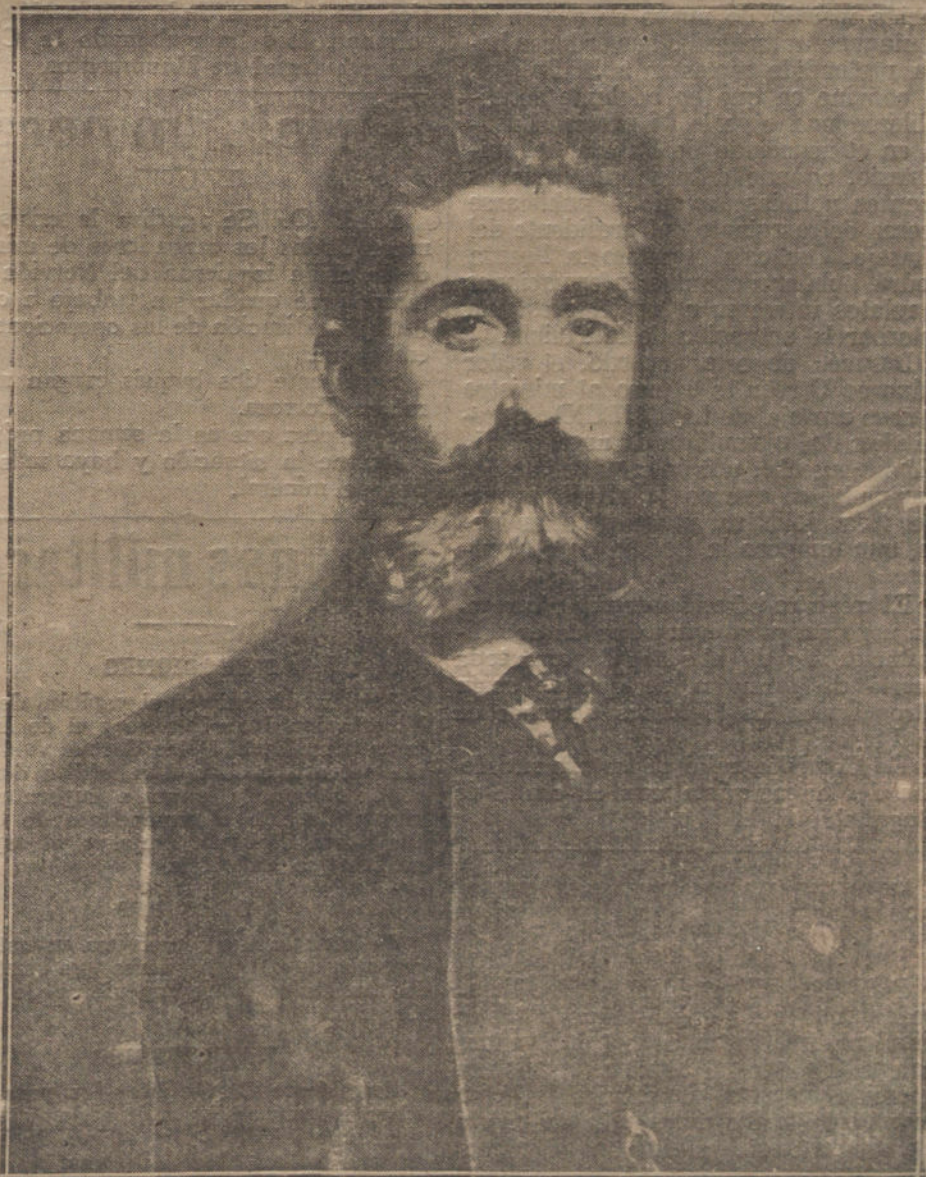
El insigne compositor don Joaquín Gaztambide y Garbayo, muerto el 18 de marzo de 1870, cuyos restos mortales han sido trasladados hoy a Tudela.