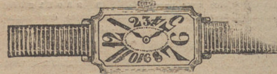
Núm. 2.—Rectangular, áncora 16 rubíes, oro de ley 18 quilates, con pulsera de moiré. Pesetas 200.