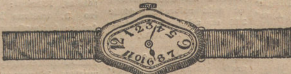
Núm. 5.—Festoneado, áncora de precisión, oro de ley 18 quilates, con pulsera de moiré. Pesetas 300.