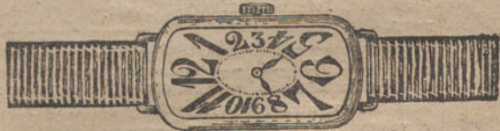
Núm. 1.—Áncora de forma, oro de ley 18 quilates, con pulsera de moiré. Pesetas 175.

Garantía efectiva de buena marcha por cinco años