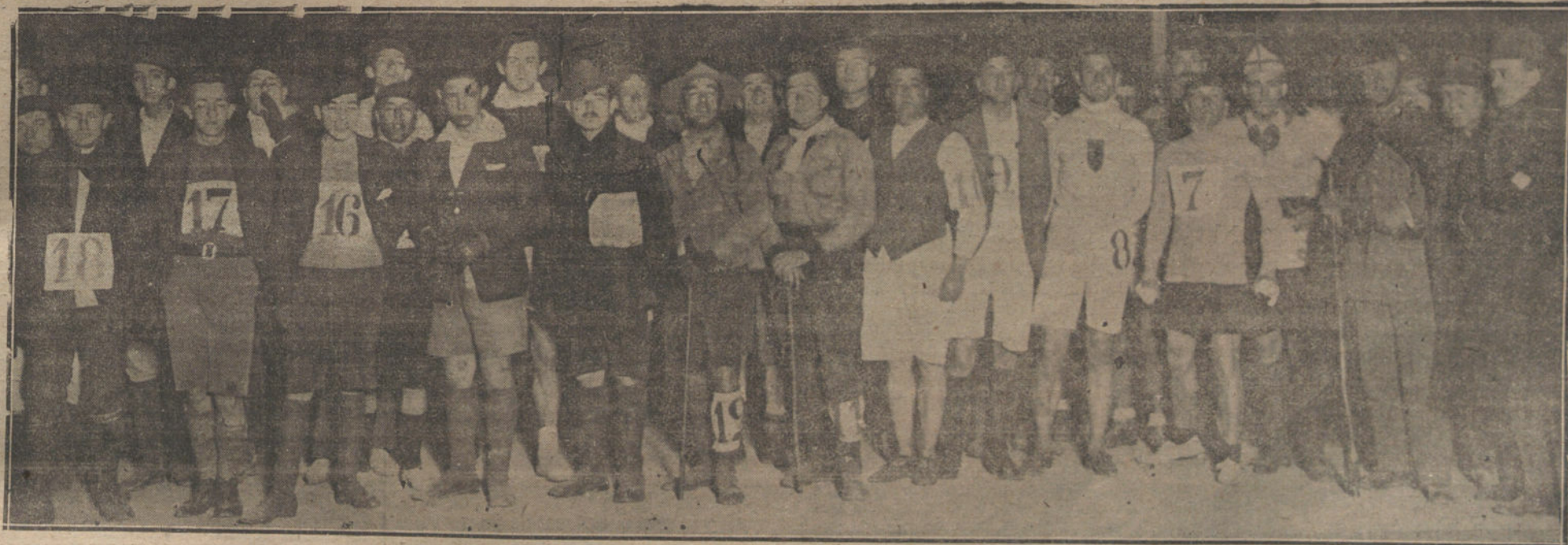
CARRERAS DE 100 KILOMETROS A PIE, VERIFICADAS AYER EN LA CARRETERA DE ARAGON.—Grupo de corredores preparados para la salida.

Tanto frente a la iglesia como los alrededores se había congregado numeroso público.