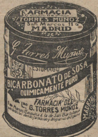
LATAS ECONOMICAS DE 1 1/2 KILOS