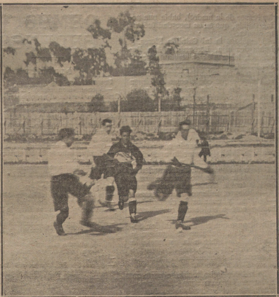
Un momento interesante del partido de Hockey, jugado ayer tarde en el campo del Athletic entre los equipos Pompeya y el Hockey-Club, ambos de Barcelona, para disputarse el campeonato de España.