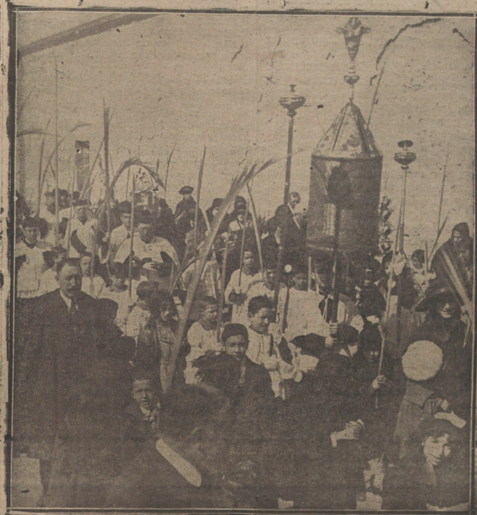
Un detalle de la procesión de las Palmas, verificada ayer en la iglesia de los Jerónimos Reales. (Fot. VIDAL.)

«El problema se presenta muy sencillo. El único ideal que debe existir es