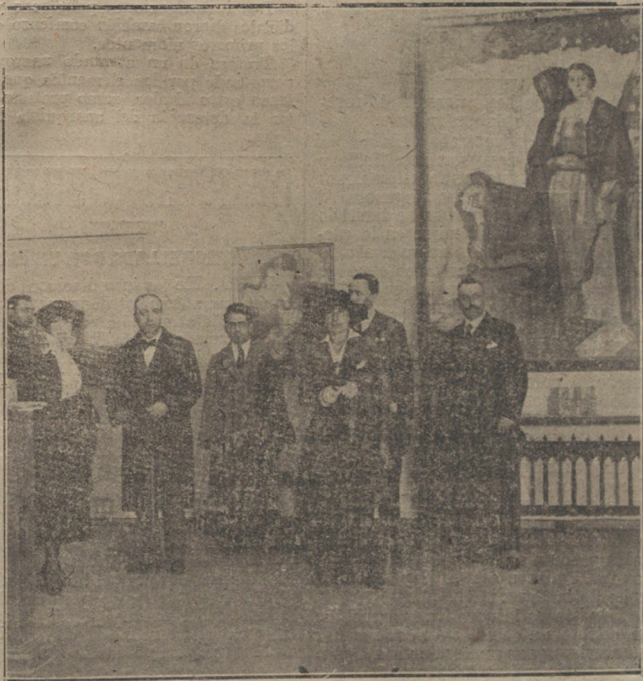
Barnizaje de la Exposición de obras de Vázquez Díaz, verificado ayer en el Palacio de las Bibliotecas y Museos.