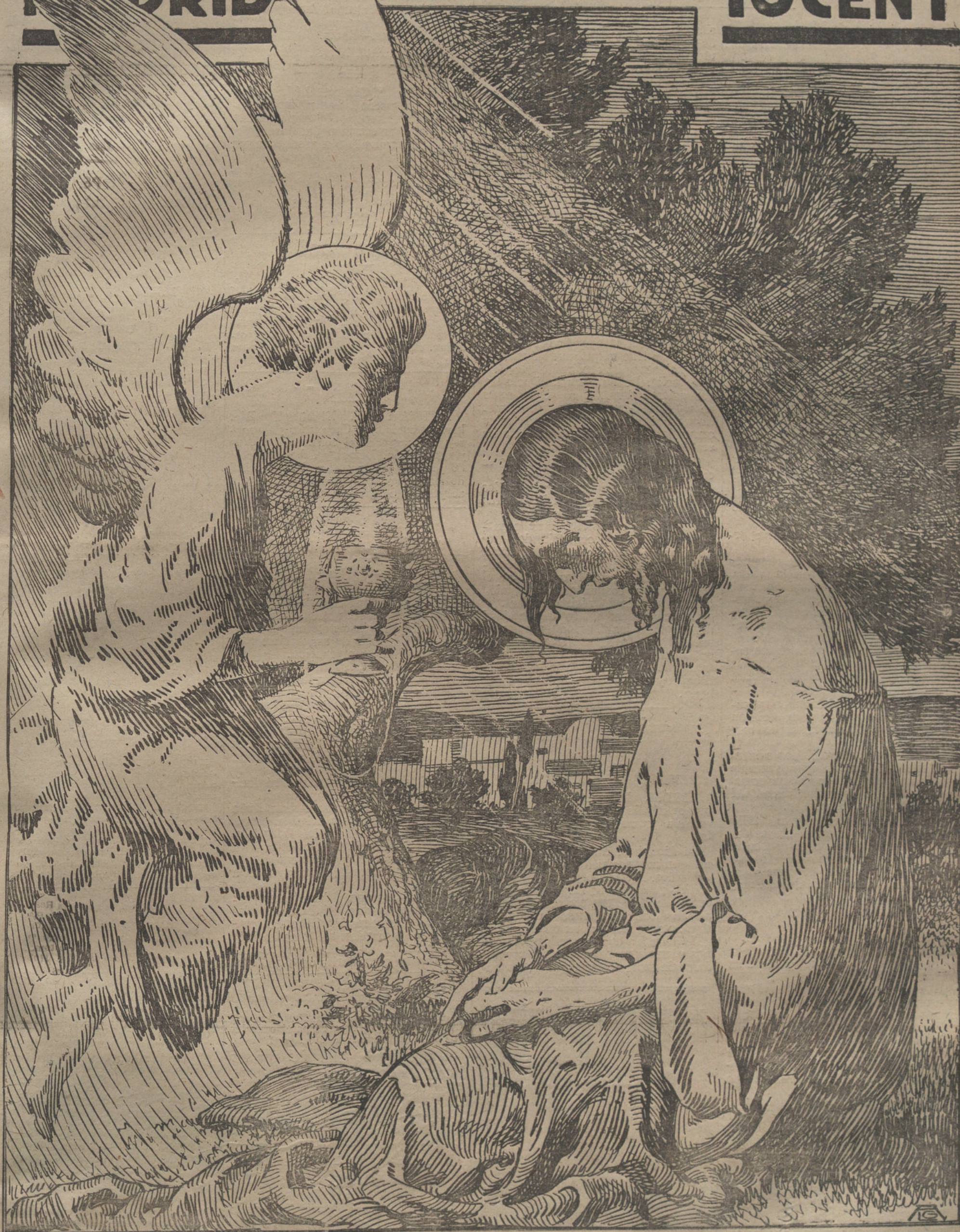
LA ORACION DEL HUERTO. (Dibujo de AGUSTIN.)