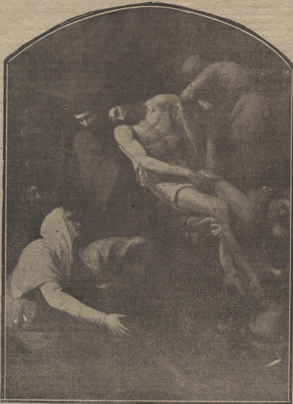
EL DESCENDIMIENTO, cuadro de Bartolomeo Carducci, del Museo del Prado

San Luciano, mártir, quien, dirigiéndose al presidente del Tribunal que le juzgara, hablóle de la divinidad de Jesucristo diciendo: «Pongo por testigo al mismo sol, que, al ver el crimen de los deicidas, ocultó, en pleno día, su luz al mundo. Registrad vuestros anales, y ellos os dirán que en tiempos de Poncio