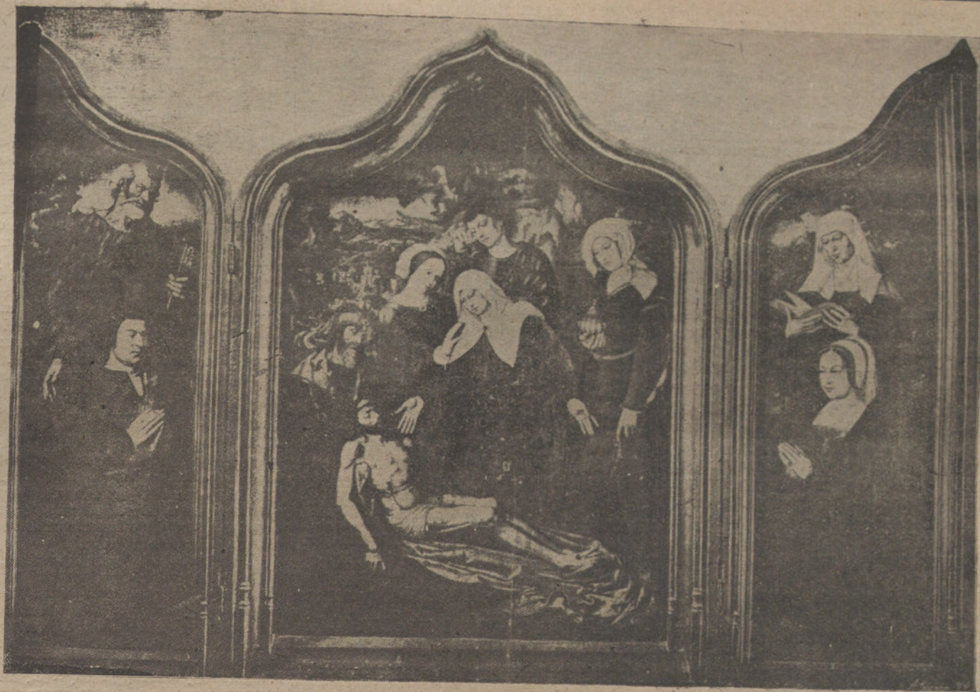
Bellísimo tríptico de escuela flamenca, desaparecido de la Real Capilla parroquial de Santa Cruz, en Nájera, y que procedía del monasterio benedictino de Santa María la Real. Esta obra del siglo XVI ofrecía la curiosa particularidad de que todas sus figuras eran retratos auténticos que representaban los rostros de Isabel la Católica y su esposo, don Fernando; doña Juana la Loca y su marido, Felipe el Hermoso; el conde de Tendilla, doña Beatriz Galindo, «La Latina», y otros personajes.

A las siete y media, en la parroquia de San Ildefonso.