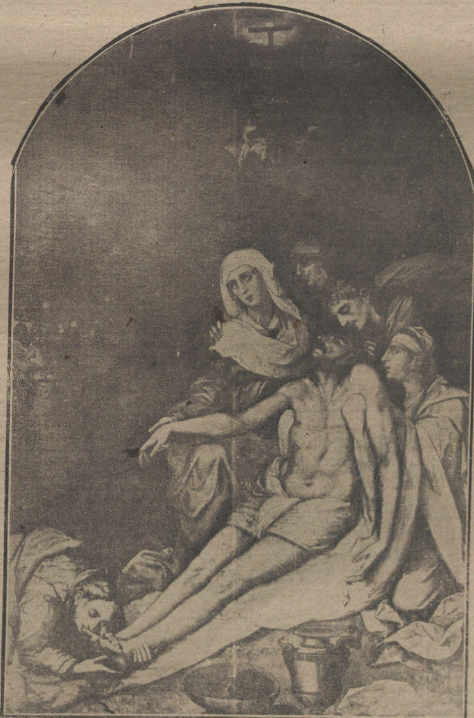
LA VIRGEN MARIA SOSTENIENDO EL CUERPO DE SU HIJO, obra de Luis de Vargas, que forma parte del retablo de Santa María la Blanca, en Sevilla.

Las turbas de Jerusalem después del Deicidio