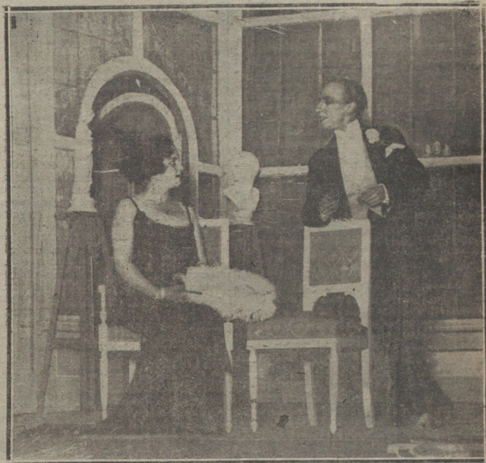
Una escena de «Ruínas», obra estrenada anoche en el Coliseo Imperial.

El autor de «Ruínas» ha sorprendido con intensa visión del natural el abatimiento irreparable de una vida.