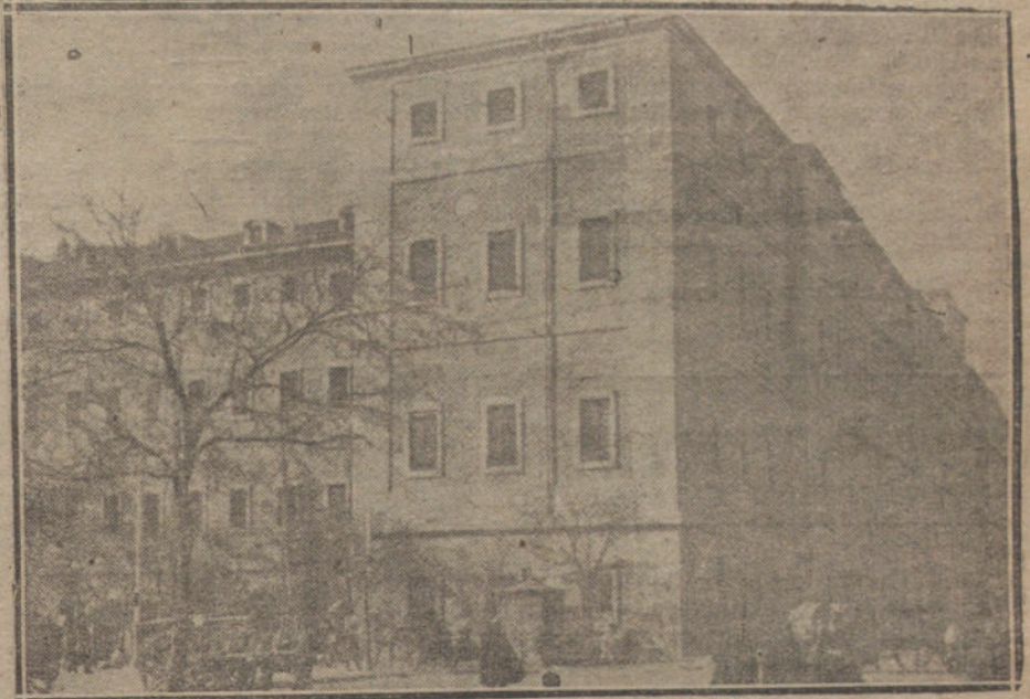
El hospital Provincial.

El doctor Marañón me espera en el salón en que está su retrato, por Zuloaga, ese estupendo retrato en que el doctor, frente a un gran paisaje, se inclina sobre el microscopio y del que yo digo que es que está viendo el paisaje al microscopio. Ese cuadro, el de Solano, los bustos de Julio Antonio, la miniatura del Greco, y ese otro cuadro del Greco en el que hay un crucificado sobre una tormenta admirable, que ha pintado el Greco en su cuarto de hora de mayor inspiración, cuando el rayo y el trueno más fuertes le abrieron más el ciclo y vio mejor su fondo, dan un aspecto solemne a su consulta. Me va a hacer el honor de dedicarme su tarde del domingo, enseñándome su sala en el hospital. Yo, en la mañana, no asistiré ni a mi entierro; mi entierro tendrá que ser por la tarde.