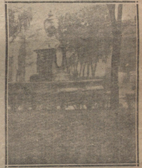
Patio-jardín del hospital.

«Sí, ya me lo había dicho a mí también. «¿Quiéds no la encontramos?», y miraba la velocidad de su automóvil cuando decía eso, como que, riendo precioso si aún la quedarían unos cuantos minutos. El ha curado varios casos, sobre todo durante los Carnavales, que fué cuando se agravó esa enfermedad, y confundieron a veces