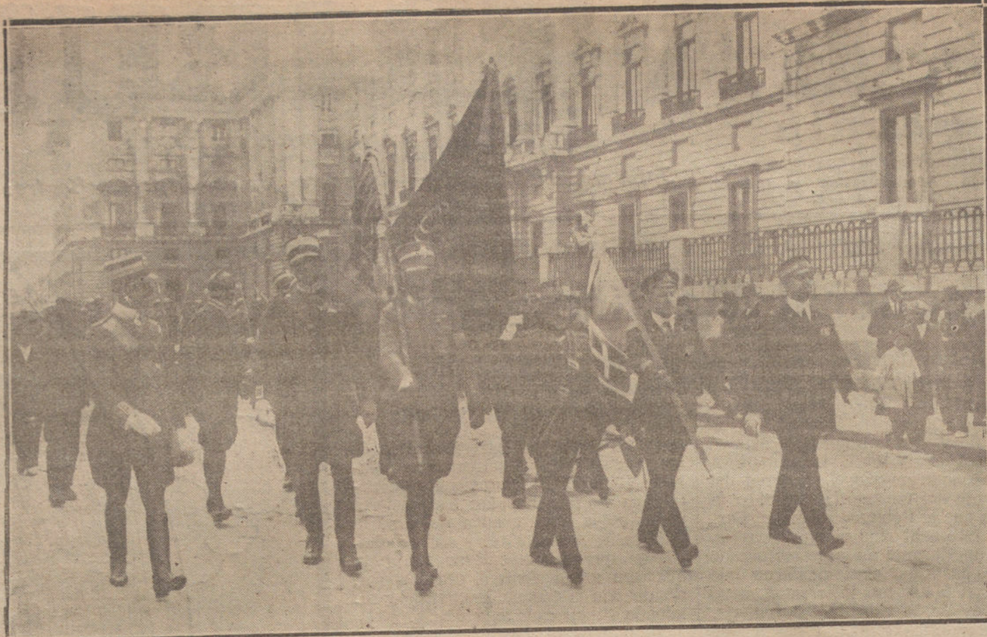
La Misión militar italiana que marcha a Portugal, a su paso esta mañana ante Palacio.