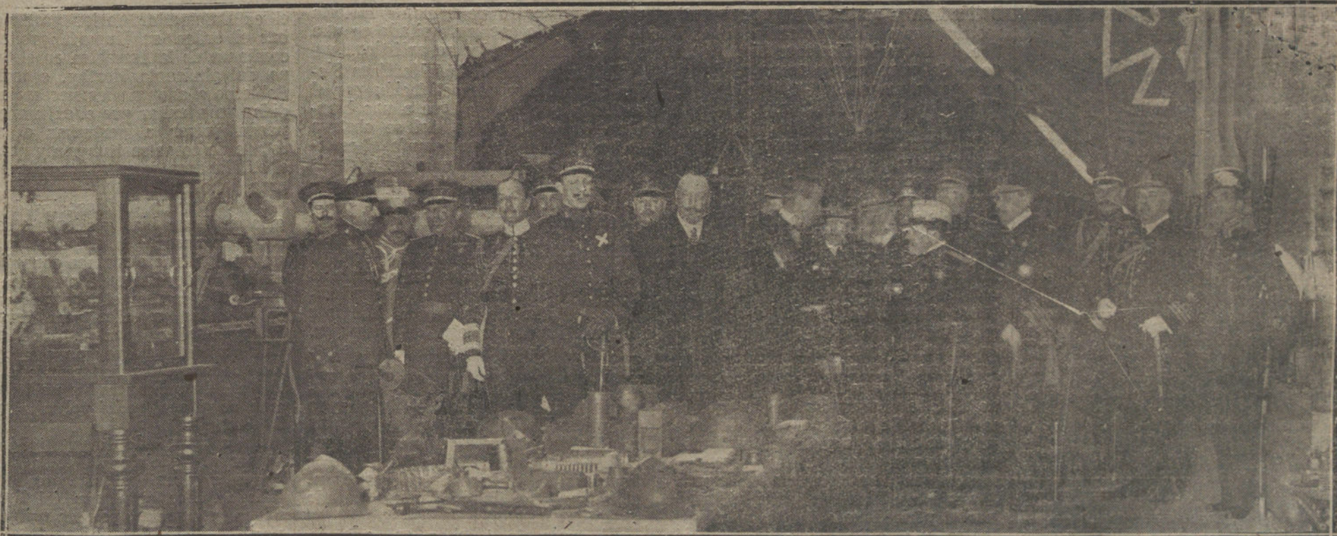
S. M. el Rey durante la inauguración de la Exposición de objetos de la guerra europea.