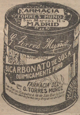
LATAS ECONÓMICAS DE 1 1/2 KILOS