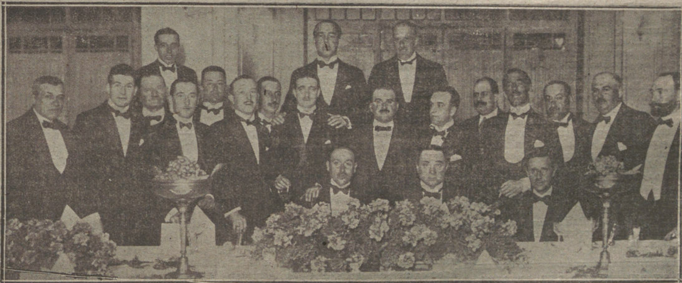
Banquete celebrado ayer noche en el Palace Hotel por la Cámara de representantes de automóviles.

—De todos los autores, menos de Paso y Abati.