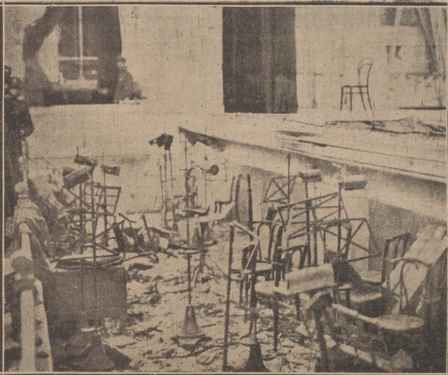
EL TERRORISMO EN ITALIA.—Estado en que quedó el teatro Diana, de Milán, después de la explosión de la bomba, que causó numerosas víctimas.

Ella es tal, que no necesita para producir las dificultades y perturbaciones políticas que le acompañan sino la libre voluntad para desenvolverse sus pasiones y peculiar temperamento charquizado.