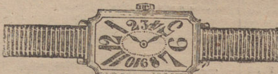
Núm. 3.—Rectangular, áncora 16 rubíes, oro de ley 18 quilates, con pulsera de moiré. Ptas. 200.