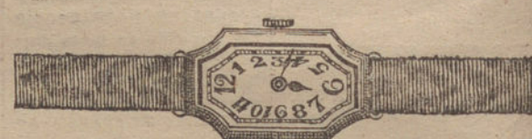
Núm. 6.—Ancora de precisión, oro de ley 18 quilates, con pulsera de moiré. Ptas. 325.