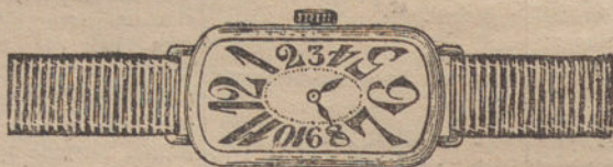
Núm. 1.—Ancora de forma, oro de ley 18 quilates, con pulsera de moiré. Ptas. 175.

Garantía efectiva de buena marcha por cinco años