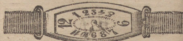
Núm. 2.—«Tonneau» alargado, áncora, oro de ley 18 quilates, con pulsera de moiré. Ptas. 200.