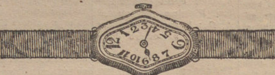
Núm. 5.—Festoneado, áncora de precisión, oro de ley 18 quilates, con pulsera de moiré. Ptas. 300.