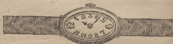
Núm. 4.—Ovalado, áncora de forma, oro de ley 18 quilates, con pulsera de moiré. Ptas. 275.