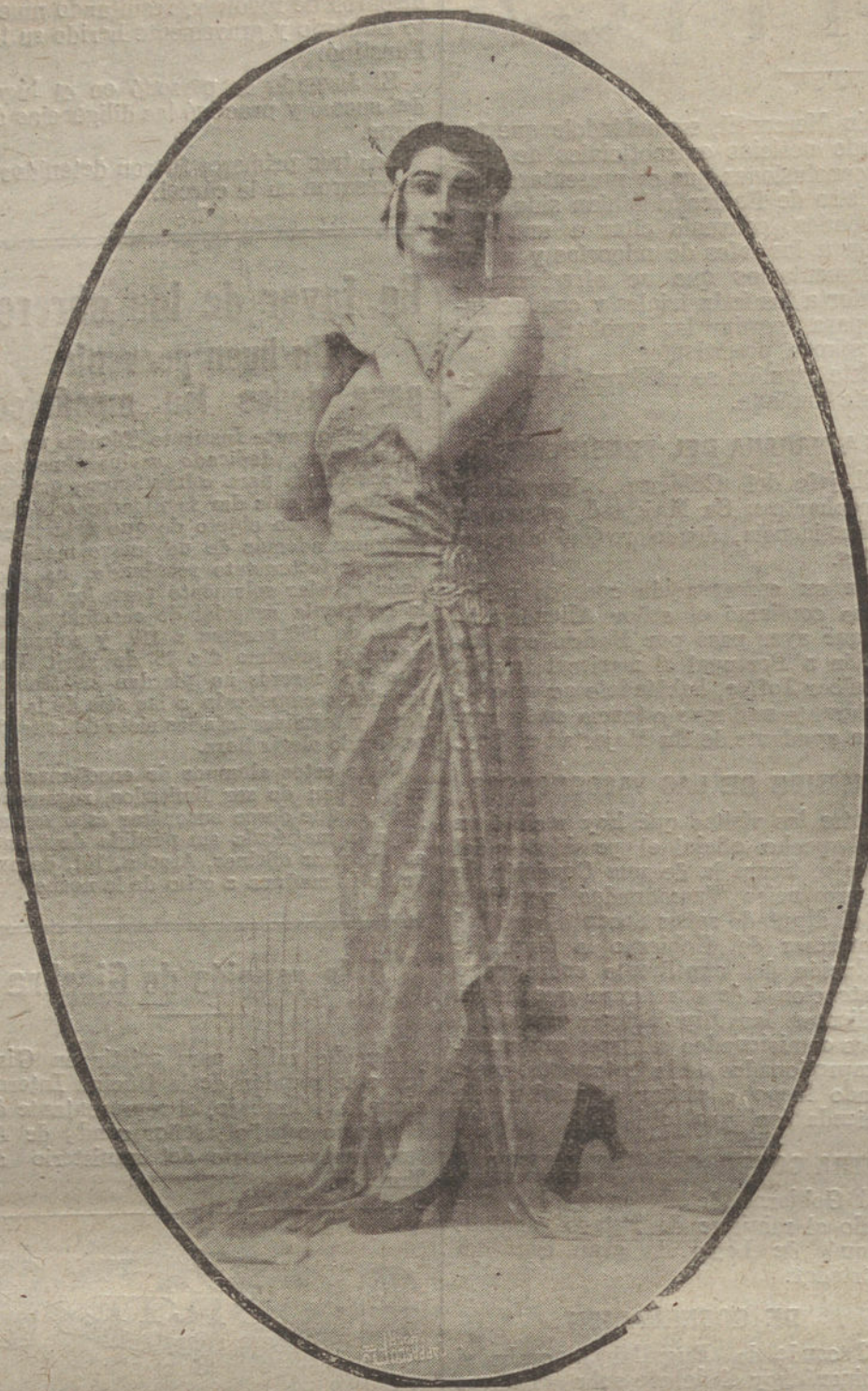
Elegante traje de «soirée», en tisú de plata, con bordados de oro, modelo de la casa «Jugueti».