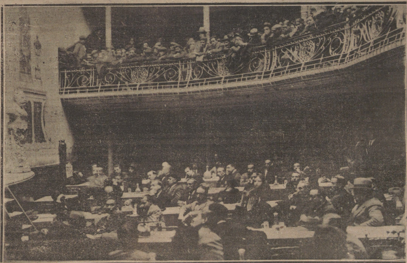
Aspecto del salón de actos de la Casa del Pueblo durante la celebración del Congreso socialista, que tiene lugar estos días.

M. Sarraut presenta después un proyecto relativo a la explotación de las