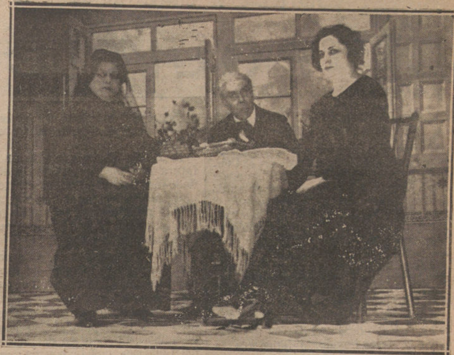
Una escena de «Frente a la vida», comedia estrenada ayer en el teatro de Lara.

cias, que eran presagios, no implicaban la menor confianza en las intenciones pacíficas de M. Poincaré.