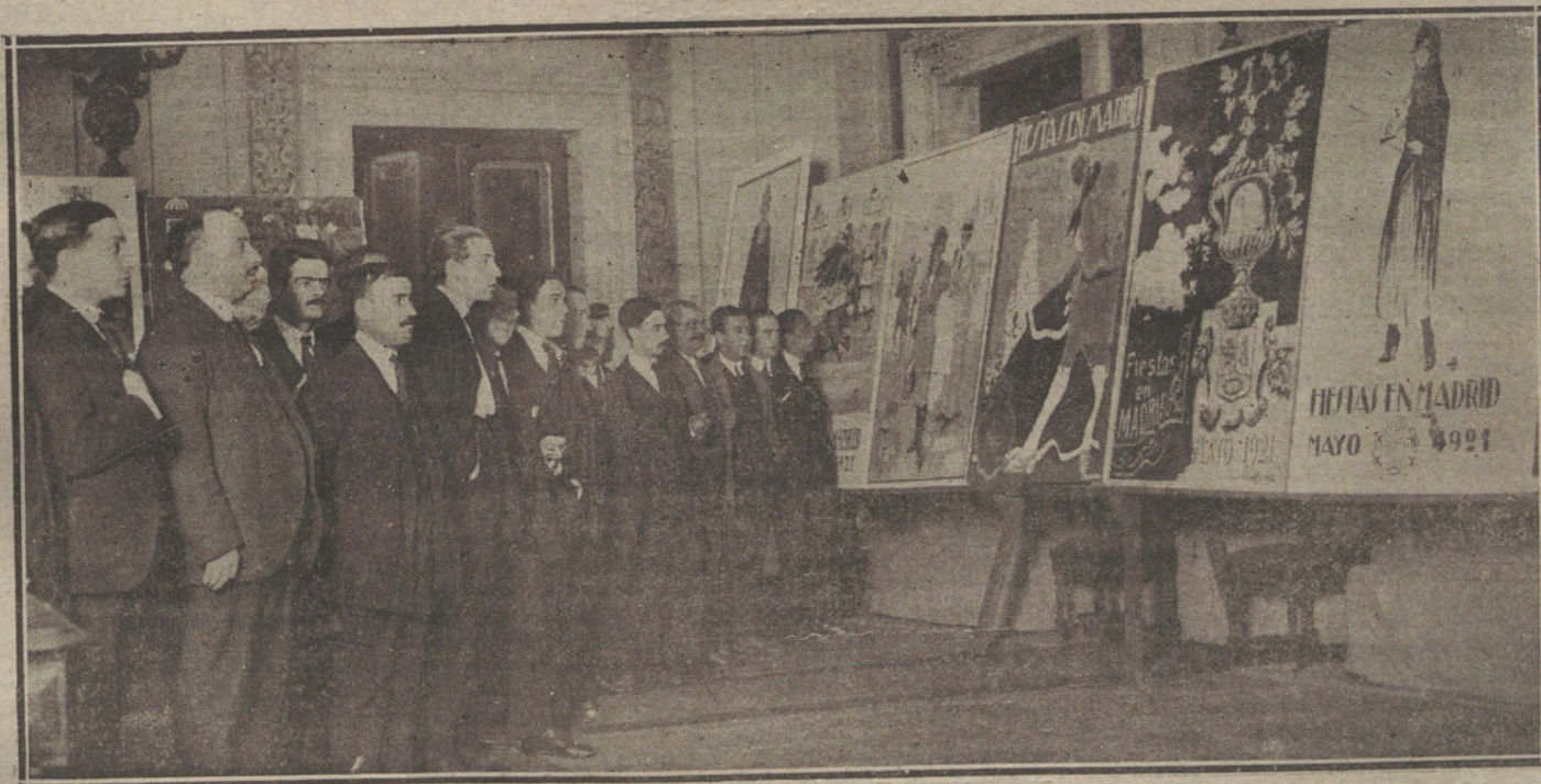
La Exposición de carteles anunciadores de las fiestas de mayo, que se ha inaugurado en el Ayuntamiento.

El público aplaudió mucho al final de cada uno de los actos, y el autor