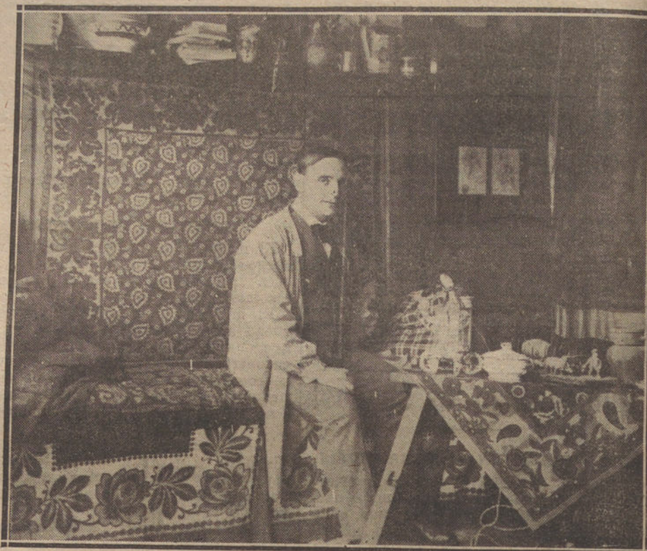
SEIS DIAS EN ESTORIL: LEAL DA CÁMARA

Este gran amigo que tenemos en Portugal y al que siempre vengo a ver es, por decirlo así, el hombre más inteligente, más europeo y, sin embargo, más portugués de Portugal.