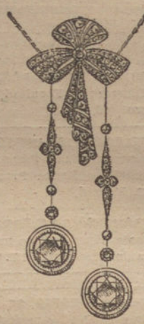
Núm. 6.—9 brillantes y diamantes. Pesetas 2.000.