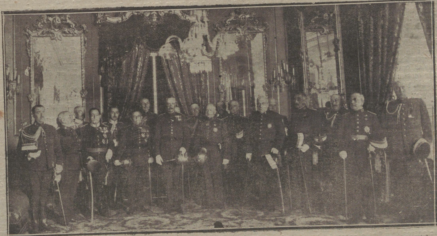
Brillante recepción celebrada en la Capitanía general de Sevilla a la llegada de Su Alteza el Infante don Carlos.

Cuando se da lectura al acta de Grinón, cuyas notas se aplican al grupo reconstituido, se traban de palabras dos delegados que ocupan las extremas izquierdas, lanzándose insultos en alta voz y llegando a las manos. Vuelan por los aires sillas y botellas.