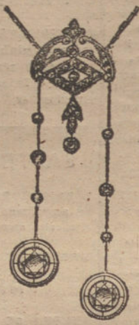
Núm. 5.—7 brillantes y diamantes. Pesetas 1.175.