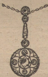
Núm. 4.—8 brillantes y diamantes. Pesetas 900.