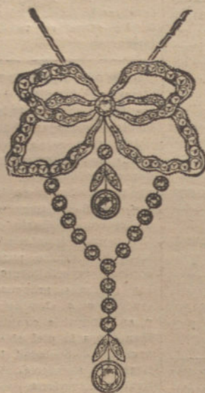
Núm. 2.—18 brillantes y diamantes. Ptas. 1.500.