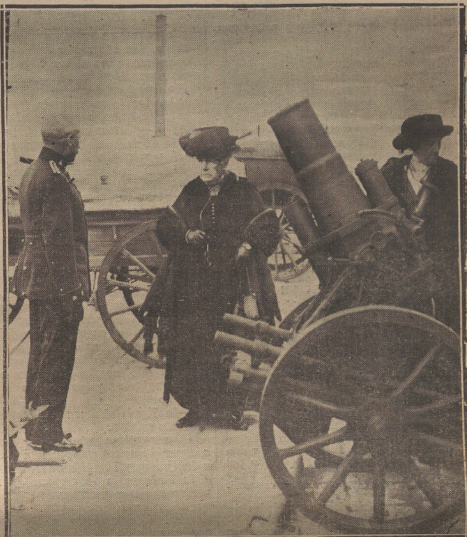
Su Alteza la Infanta doña Isabel durante la visita que hizo ayer a la Exposición de guerra.

El resultado de los nueve meses arroja un saldo en contra nuestra de 880'8 millones, pues las importaciones montaron 3.150'9 millones, y las exportaciones 2.270'1 millones de pesetas. En las cifras pone de manifiesto toda la