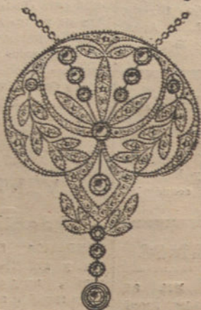
Núm. 1.—14 brillantes y diamantes. Ptas. 875.

con brillantes de primera calidad.-Diamantes rosas de Holanda, monturas de platino fino y oro de ley, 18 quilates contrastado