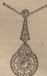
Núm. 7.—4 brillantes y diamantes. Pesetas 950.