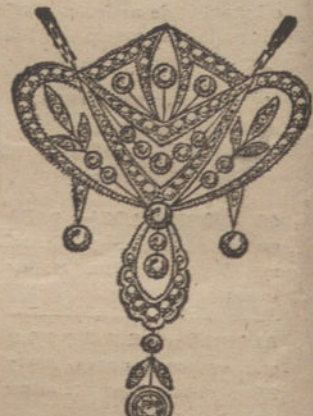
Núm. 3.—19 brillantes y diamantes. Ptas. 1.005.