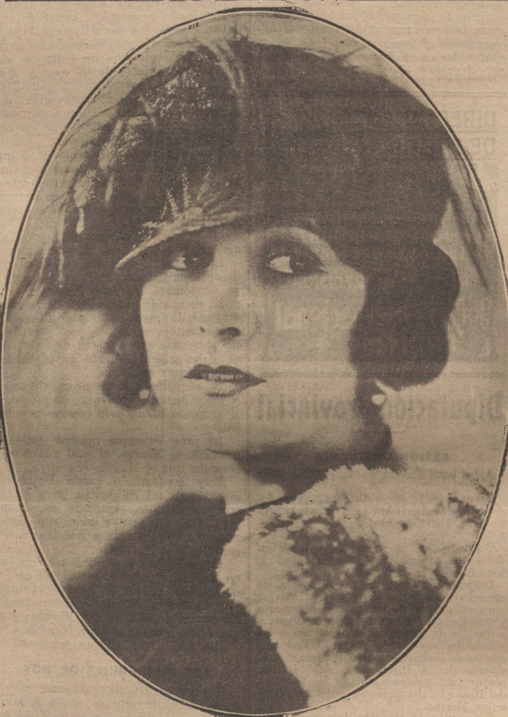
NORMA TALMADGE , estrella de la cinematografía americana, eminente actriz, cuyas extraordinarias condiciones artísticas conocen y admiran los concurrentes a los salones de proyección de Madrid.

históricos y a las escenas tradicionales, que tengan plasticidad, teatralidad y colorido.