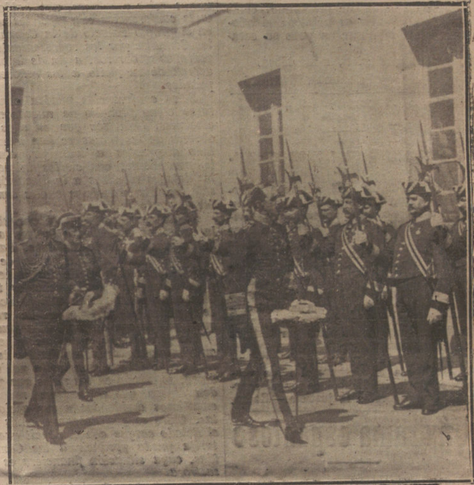
Su Majestad el Rey revistando las fuerzas de Alabarderos con motivo de las fiestas celebradas en honor de San Hermenegildo.

Después del crimen de Serajevo, el ministro de Negocios extranjeros, conde Berchtold, escribió al embajador austriaco en Roma, con fecha 21 de julio de 1914, diciéndole que él tenía conciencia de que su situación como ministro responsable no era fácil; pero que aun era más difícil y de res-