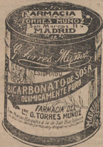
LATAS ECONOMICAS DE 1 1/2 KILOS