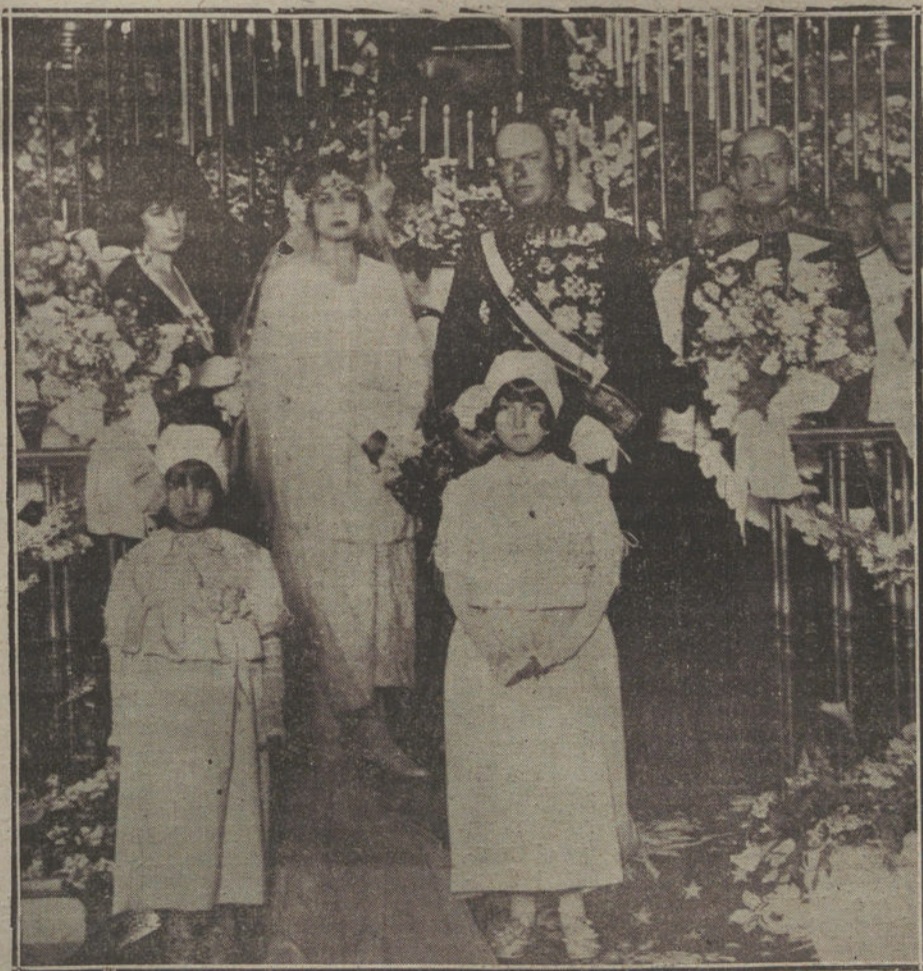
Boda de la bella señorita Cristina del Borbón con el ex ministro de Holanda en España barón de Vollenhoven.

En cuanto a la participación de los obreros en los beneficios, cree el señor Mella que si las acciones del capital van sien-