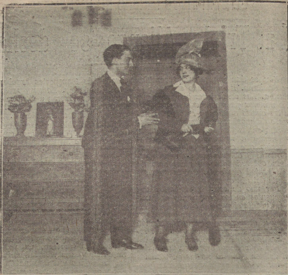
Una escena de «Adiós, Facundo», obra estrenada en el teatro Cómico.

MIRANDA. Desde la madrugada está nevando. Las montañas están en-