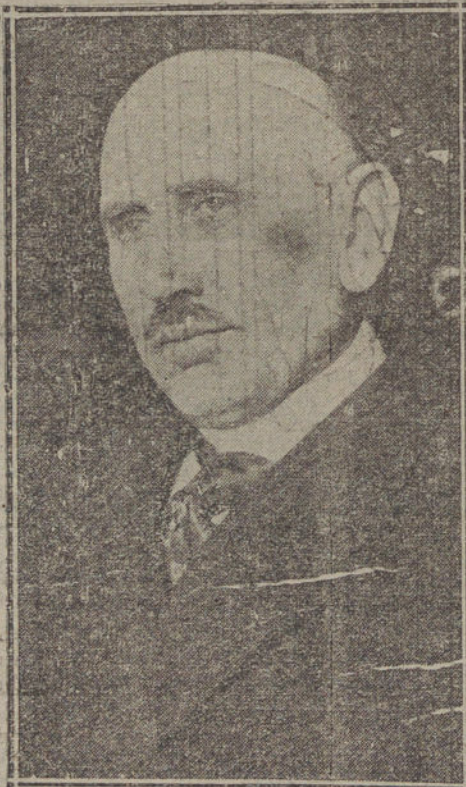
El señor Smeierwald, nuevo presidente del Consejo de ministros de Prusia.