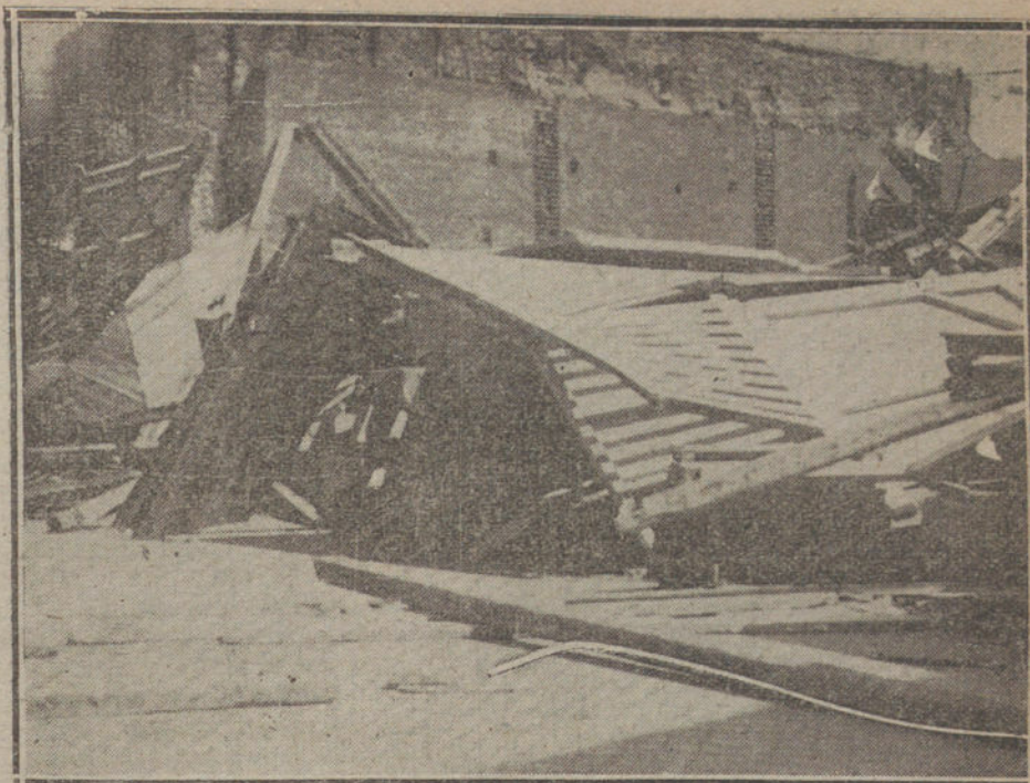
La valla del antiguo edificio de la Presidencia, derribada esta mañana a consecuencia del huracán.

Se sospecha que es posible, sin duda, que otras organizaciones obreras hayan