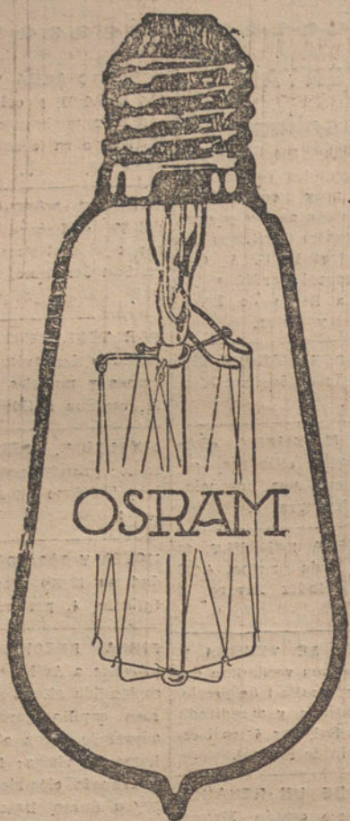
Tipo: un watio de consumo 5 a 100 bujías de intensidad