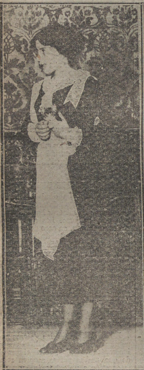
La exitosa actriz Catalina Bárcena, que ayer celebró su beneficio, en una escena de «La chica del gato».