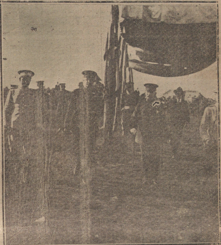
Su Alteza el Infante don Carlos, nuevo capitán general de Sevilla, presenciando el concurso hípico celebrado en el cortijo de Pineda.

Ese informe de M. Paléologue demuestra que el Zar y su ministro sabían lo que hacían, en perfecta conciencia de que aquella movilización equivalía a una declaración de guerra. Esto mismo lo habían declarado ya Nicolás II y el general francés Boisdeffre al redactar el Convenio militar francoruso... En Francia también se conocía, por lo tanto, la trascendencia de aquel gesto, y se conocía tanto que el Gobierno francés hubo de ocultárselo al pueblo. «De tal modo—escribe el general ruso Gurko, en su libro acerca del comienzo de la lucha mundial—la movilización rusa suponía, para Alemania, la necesidad de declarar