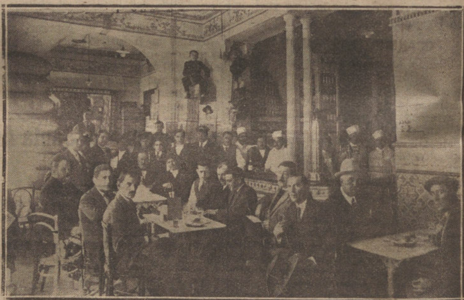
Un rincón del «restaurant» La Vinícola.