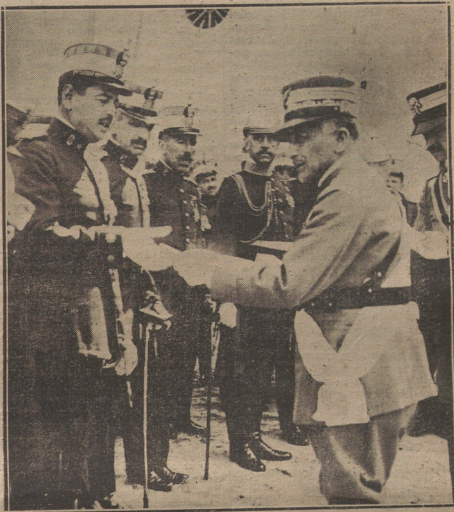
El generalísimo Italo Díaz, en el cuartel del regimiento de Saboya, entregando las condecoraciones a la oficialidad del mismo en nombre del Rey de Italia.

tros gobernantes? Mucho lo tememos, cuando observamos cómo no se ha aplicado todavía un régimen de protección a las explotaciones carboníferas. Un Arancel rígido, un sistema de primas como en Inglaterra, unas leyes encaminadas a mejorar las condiciones del trabajo en las minas y que sirvan a la vez para intensificar la producción, todo lo necesario para que nuestra gran riqueza carbonífera no se pierda en la forma en que ha comenzado a perderse, hace falta para encauzar un problema tan grave y evitar que la crítica situación económica de España se convierta en irreparable.