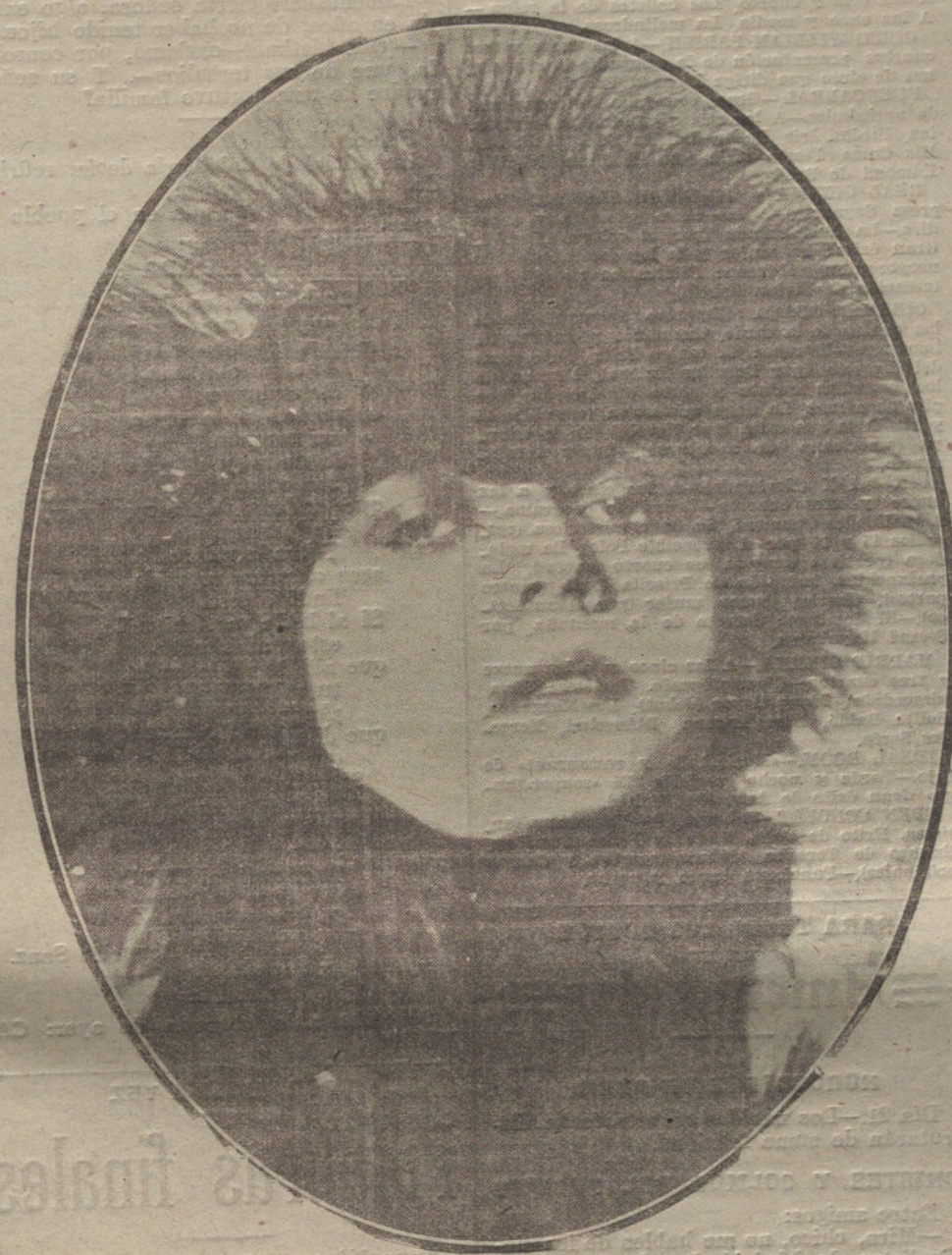
POLA NEGRI, CONOCIDA ARTISTA POLACA DE REPUTACION MUNDIAL, CREADORA DE «MADAME DUBANY»