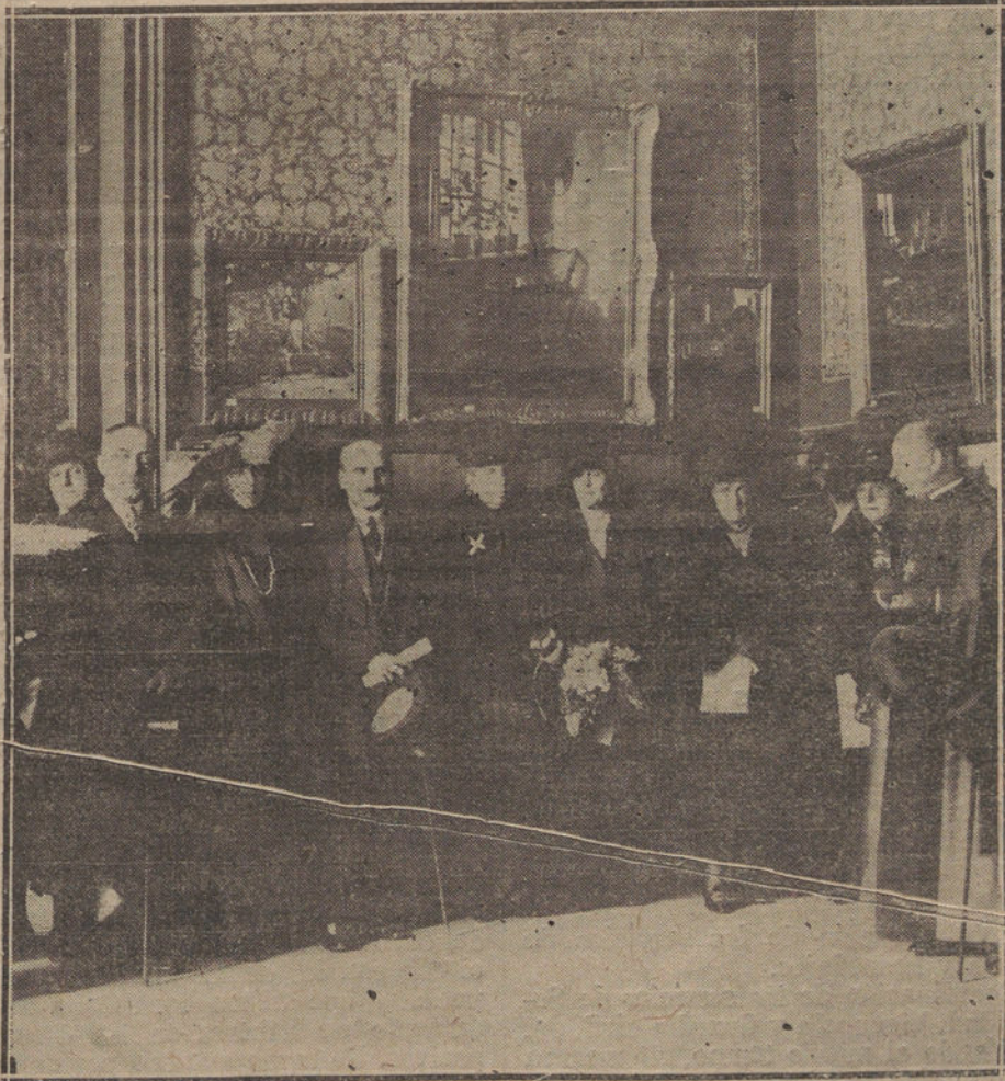
Su Majestad la Reina Cristina (X) acompañada del ministro de Instrucción pública, el obispo de Madrid-Alcalá y otras personalidades, en la solenne apertura de la Exposición de arte popular húngaro, que se celebra en el Teatro Real a beneficio de las madres y niños desvalidos de Hungría.