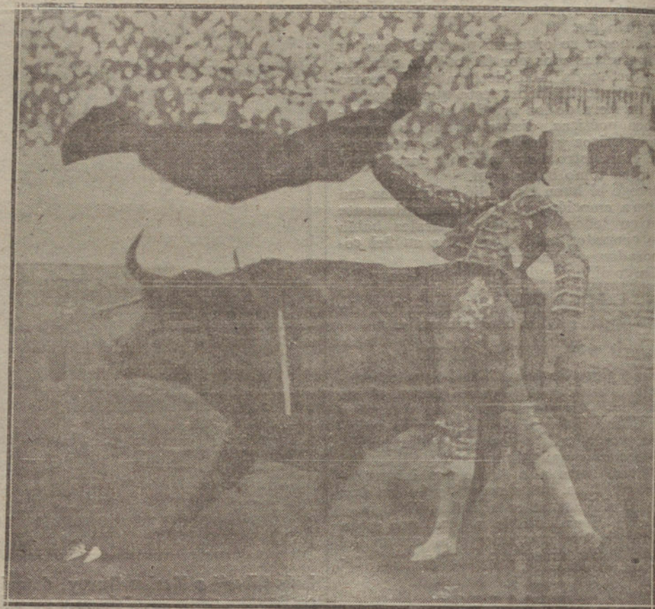
LAS CORRIDAS DE FERIA DE SEVILLA.—El espada Granero en un excelente pase de pecho en la tercera corrida.

No habíamos visto torear a Manuel Granero desde aquellas novilladas con que se presentó en Madrid.