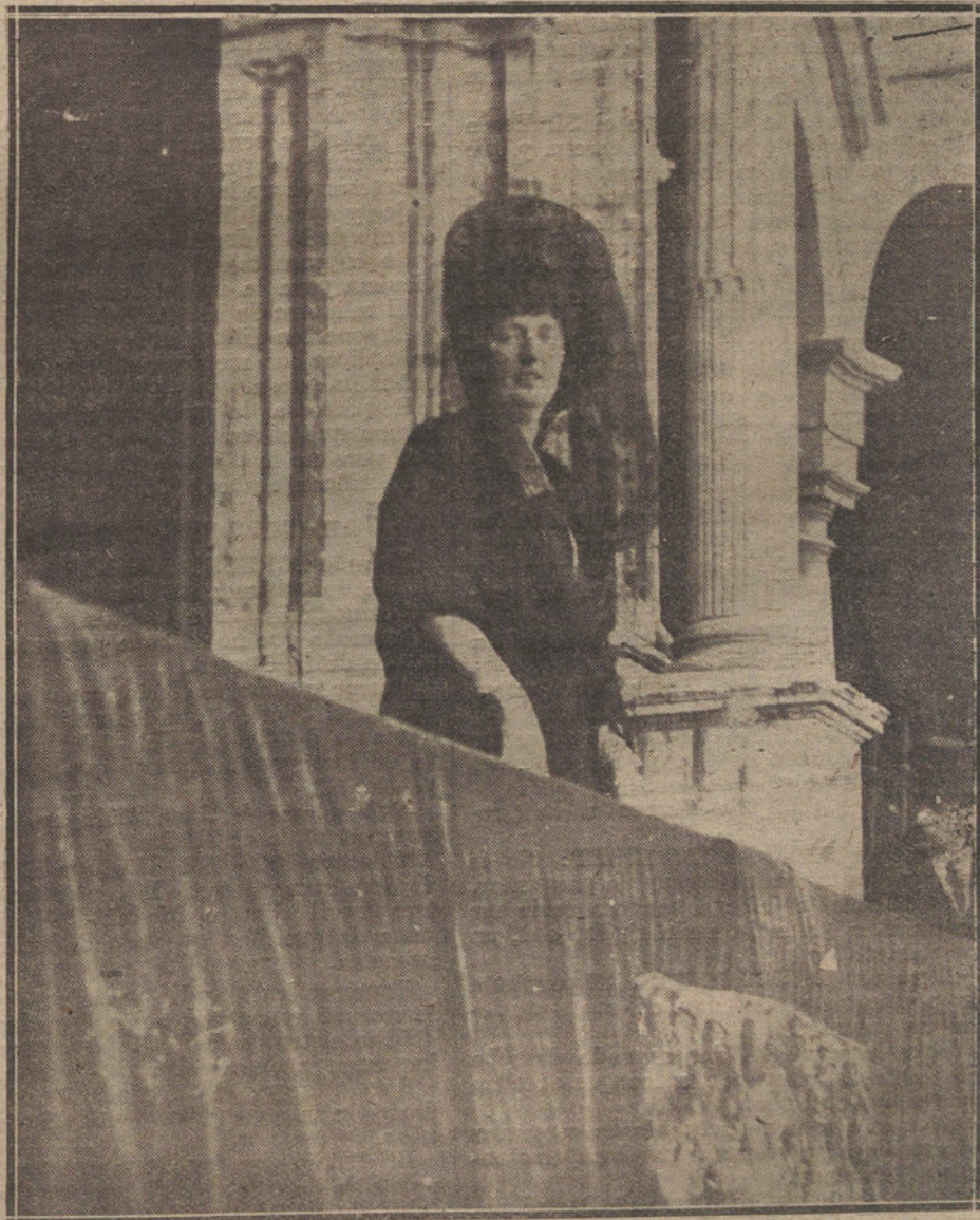
Su Alteza la Infanta doña Luisa preside una de las corridas de feria de Sevilla.

EL ANUNCIO EN «LA TRIBUNA» ES EL MAS PRODUCTIVO, POR SU AMPLIA INFORMACION Y EXTENSA TIRADA.