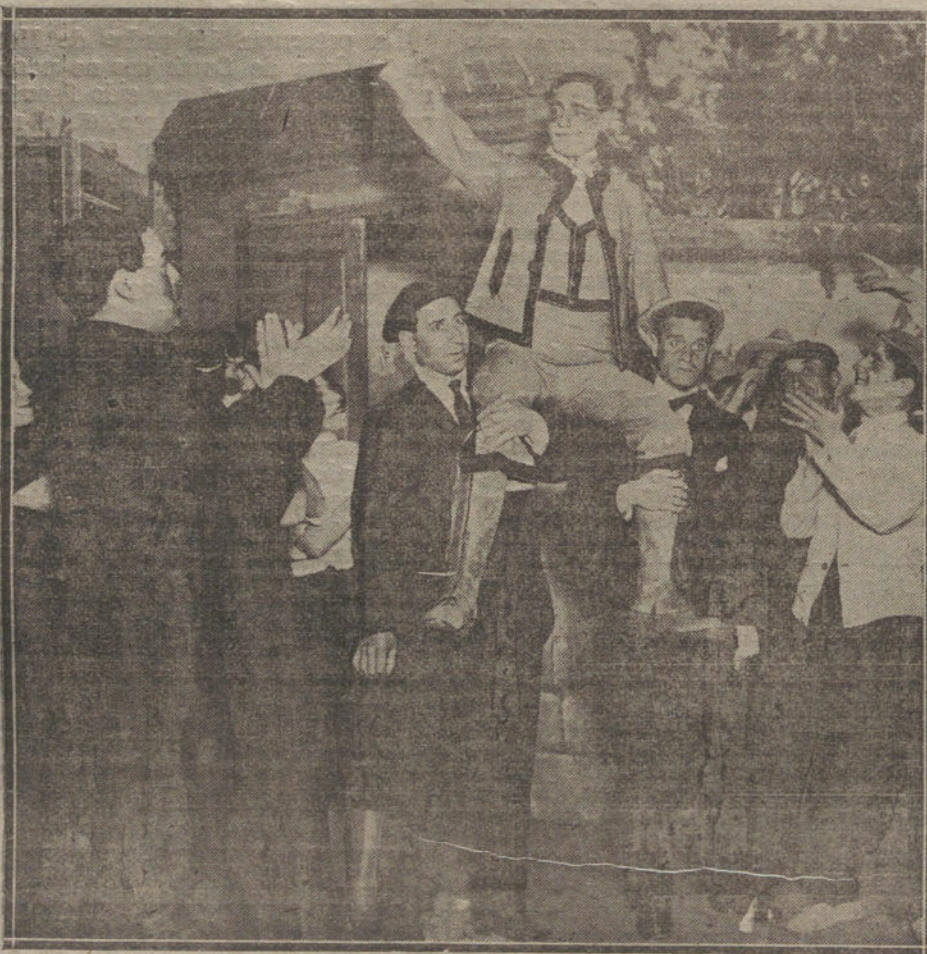
Una escena de «Suerte que tié una», obra que se estrena esta noche en No-vedades.

En la Asociación Oficial de Estudiantes de Farmacia dará mañana una confe-rencia don Odón de Buen, a las seis de la tarde, sobre el tema «La obra cien-tífica de don Blas Lázaro».