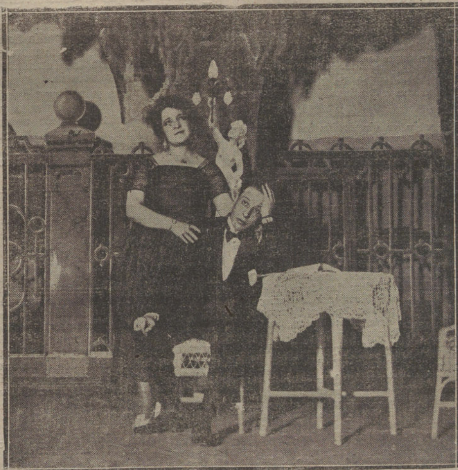
«Rebeldes», obra estrenada en el Español.

que cualquier otro ciudadano para la conservación de la colectividad. El gobernante de oficio, con sus inmundicias—acaso inevitables—, no es hasta ahora sustituible, porque no se ha in-