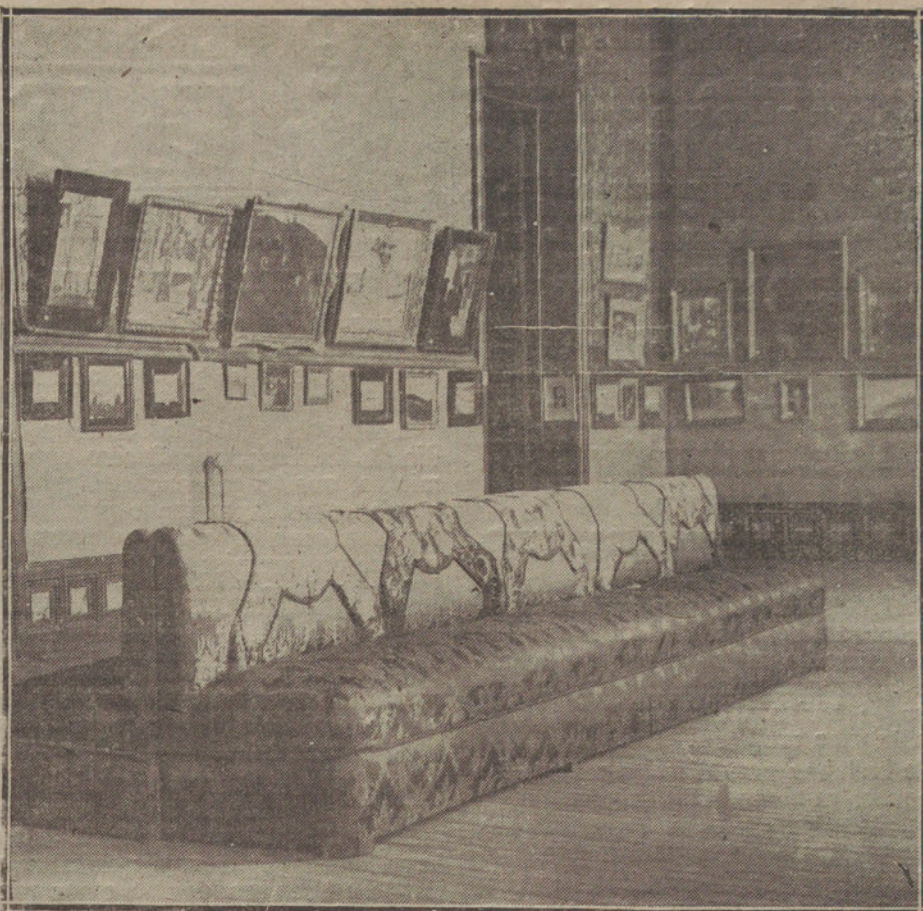
Aspecto de una de las salas del Real, donde está instalada la Exposición de arte popular húngaro, a beneficio de las madres y niños desvalidos.

Para la magnífica finca de Trasmulas, que en la provincia de Granada poseen los condes de Agrela, salieron ayer sus hijos los condes de Salinas.