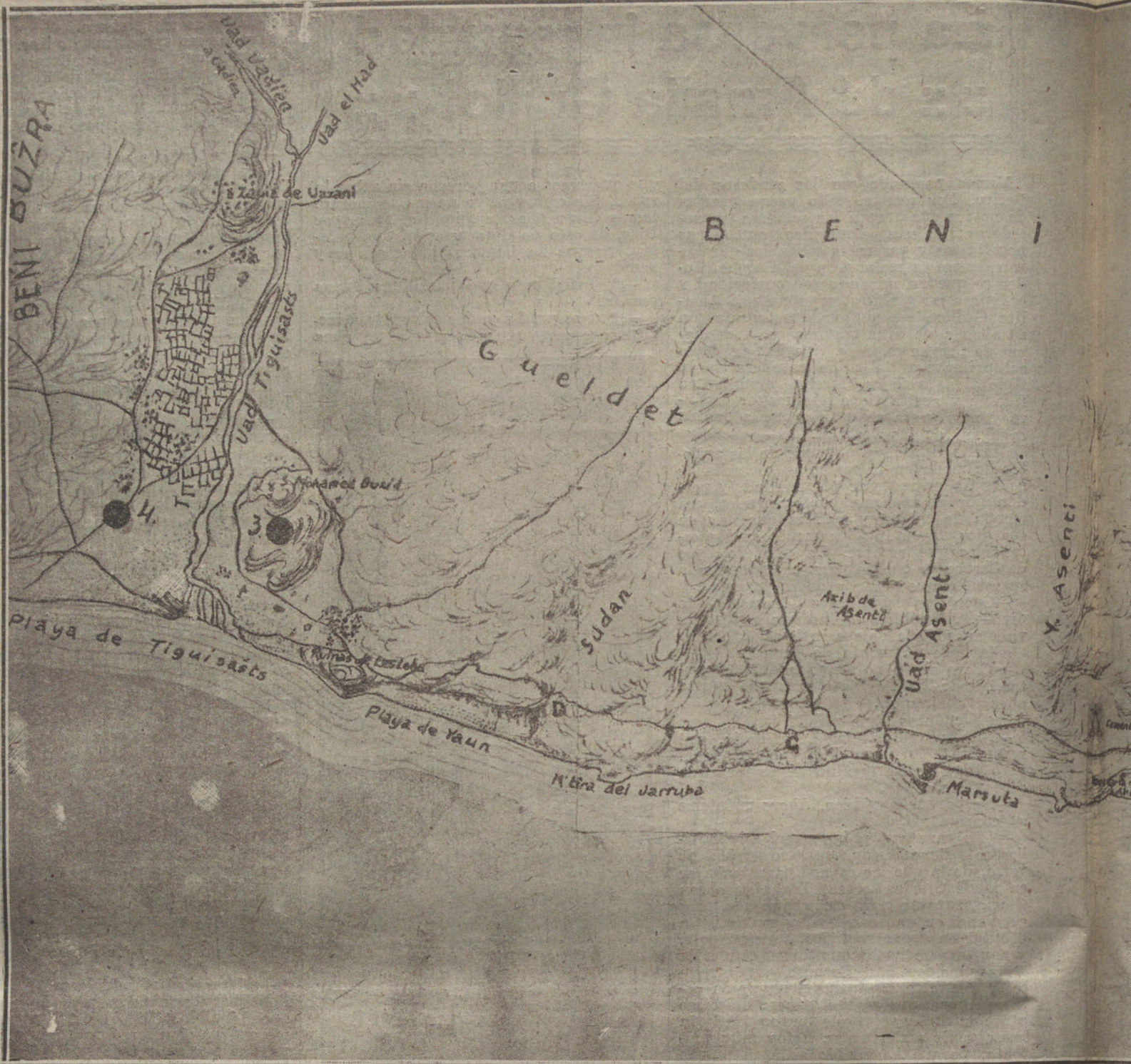
Croquis de la costa de Gomara, cuya ocupación se ha realizado por nuestras tropas, constituyendo una de tísimo plano, copia de los croquis oficiales:

(1) En esta grata pesadilla no veo la pintura del autor de «La Pasionaria».