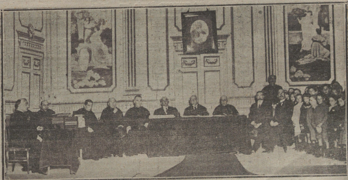
Reparto de premios a los alumnos de las Escuelas Pías de San Antonio, acto verificado ayer tarde en el teatro del Centro.

El señor Cussó prosigue exponiendo el estado en que se encuentra el Arancel. Puede—afirma el orador—darse por terminado, pues sólo quedan por