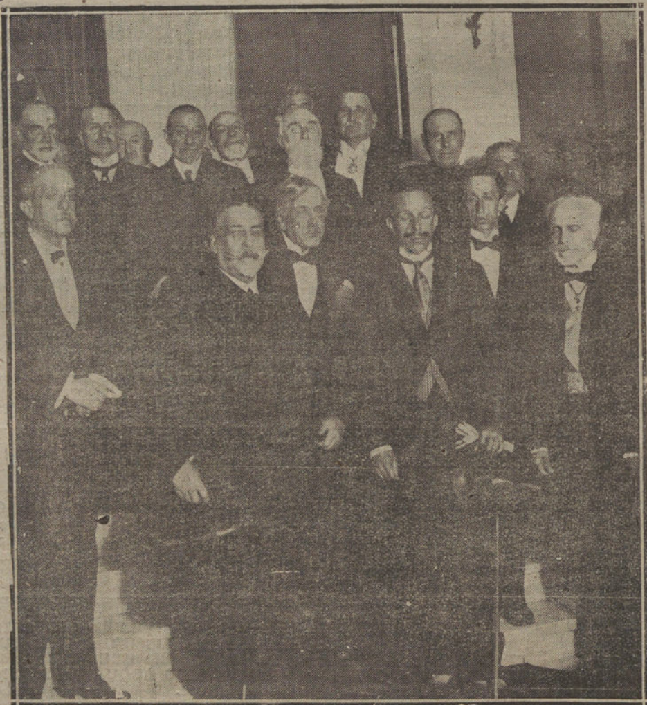
Su Majestad el Rey saliendo de la solemnísima sesión celebrada en la Academia de Medicina.

Hay que lamentar también la falta frecuente de energía eléctrica, que produce la consiguiente irregularidad del servicio de tranvías, y para ello la entidad suministrante busca remedio, poniendo sus instalaciones en relación con la intensidad del tráfico; pero, de momento, la buena marcha de la explotación tropieza con un escollo más, y los esfuerzos de la Compañía se estrellan ante dificultades insuperables que le impiden satisfacer debidamente las necesidades del vecindario. A éste se dirige hoy, rogándole que tome en consideración las causas de fuerza mayor señaladas, y le recomienda que ponga de su parte algo más de paciencia hasta tanto que se le proporcionen las facilidades de transporte a que es acre-