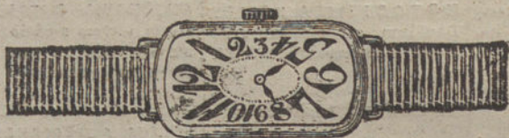
Núm. 1.—Ancora de forma, oro de ley 18 quilates, con pulsera de moiré. Pesetas 175.

Formas modernas y elegantes. Máquinas finas de precisión. Garantía efectiva de buena marcha por cinco años