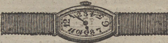
Núm. 3.—«Tonneau», áncora de precisión, oro de ley 18 quilates, con pulsera de moiré. Pesetas 250.