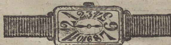
Núm. 2.—Rectangular, áncora 16 rubíes, oro de ley 18 quilates con pulsera de moiré. Pesetas 200.