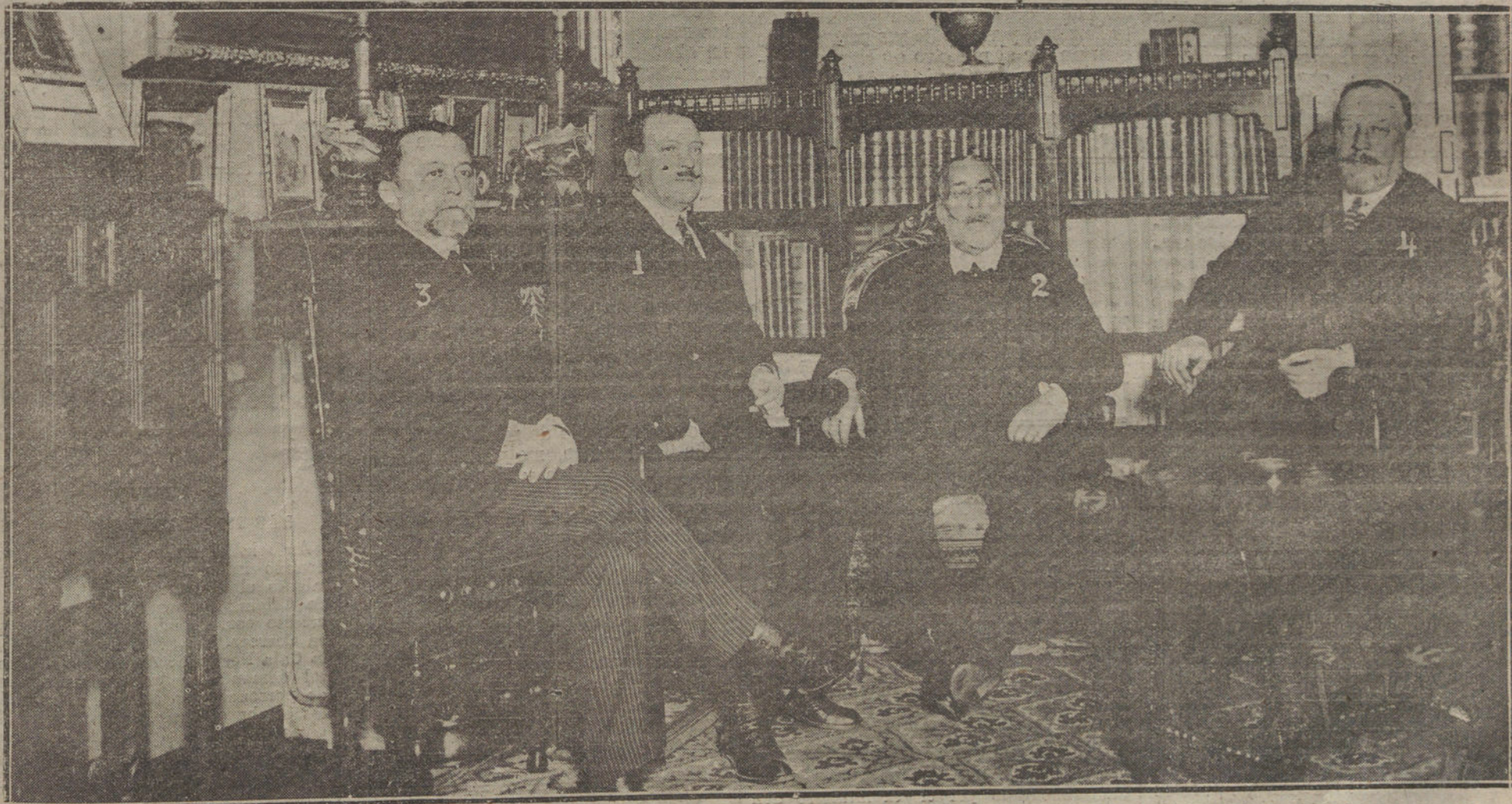
El gobernador civil de Barcelona (1) con el presidente del Consejo, señor Allendesalazar (2), el ministro de la Gobernación, señor conde de Bugallal (3), y el ministro de Marina, señor Fernández Prada (4), durante la conferencia celebrada ayer tarde.

De todas las colonias europeas, la más numerosa es la española. Suman varios millares los súbditos de España que están establecidos en Tánger. Pero no sólo es la colonia más numerosa, sino además la más importante por su fuerza económica y social. En manos de españoles están los mejores establecimientos comerciales, las más fuertes industrias, los edificios más suntuosos, las Empresas y Corporaciones de toda clase, las Compañías de teléfonos, luz eléctrica, las escuelas, iglesias, el hospital, el Instituto de Higiene, el teatro, los «cines» y «kursales», el Colegio de Alfonso XIII, donde se cursa el bachillerato, y otras muchas instituciones, españolas son todas ellas. Digámoslo de una vez: la colonia española de Tánger honra a España. Todos aquellos compatriotas rivalizan en el amor a la madre patria y dirigen sus nobles esfuerzos a engrandecerla. Con tenacidad indomable laboran con éxito y mantienen siempre los derechos y el interés de España. Ese puñado de españoles está haciendo más por la patria que todos los políticos y diplomáticos juntos. Gracias a ellos no ha desaparecido aún el predominio popular que ejercemos en Tánger. La población