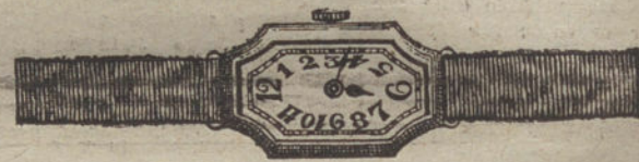
Núm. 6.—Ancora de precisión, oro de ley 18 quilates, con pulsera de moiré. Pesetas 325.