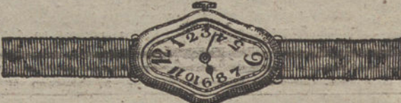
Núm. 5.—Festoneado, áncora de precisión, oro de ley 18 quilates, con pulsera de moiré. Pesetas 300.