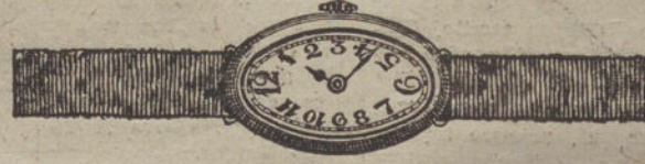
Núm. 4.—Ovalado, áncora de forma, oro de ley 18 quilates, con pulsera de moiré. Pesetas 275.