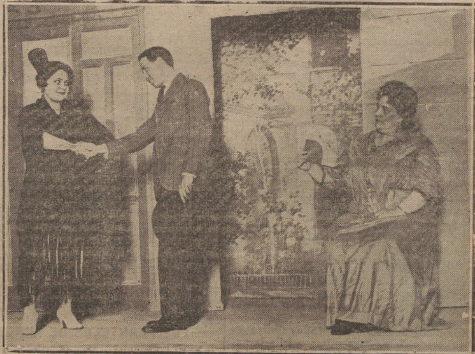
Una escena de «La silita», entremés de los hermanos Quintero, estrenado anoche en el teatro de la Infanta Isabel.