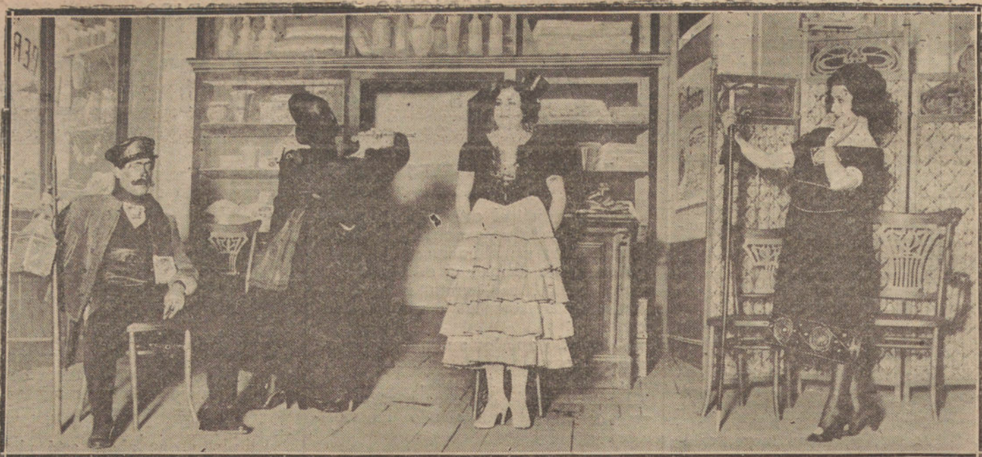
Una escena de «Los peliculeros», sainete de Santiago Vinardell, estrenado ayer en el Español.

Se hallaron en su poder varias hojas clandestinas de propaganda sindicalista.