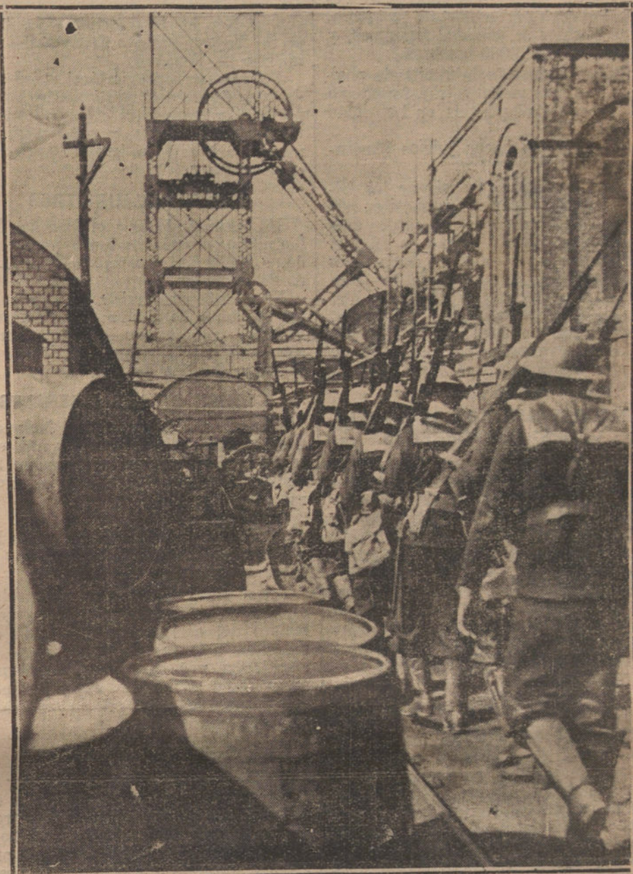
LA HUELGA MINERA EN INGLATERRA. —Guardia naval protegiendo los trabajos en las hulleras de Abertillery, propiedad del Almirantazgo británico.

En el problema de Tánger, «nuestros amigos los franceses» han abandonado el procedimiento teorizante y se han lanzado bruscamente a la práctica, a los hechos positivos. Puestas así las cosas, se avizora un porvenir próximo muy trágico: el choque es inevitable. ¿Puede continuar impasible nuestra diplomacia aguardando la catástrofe que se avecina? ¿No ha llegado la hora todavía de que el Parlamento español se ocupe de este problema? ¿Por ventura no hay en los escaños rojos ningún diputado que se haga eco de la trascendencia de los sucesos de Tánger? Mediten políticos y gobernantes acerca del hecho. El mundo entero tiene los ojos puestos en la intervención europea en África. El momento ha llegado. Comprendiéndolo así el imperialismo francés, se ha quitado la carta y quiere apoderarse de Tánger. La ofensiva francesa ha comenzado. Desde Clemenceau, en el editorial de «L'Homme Libre», y Leon Bourgeois, en «L'Echo de Paris», hasta «La Dépêche