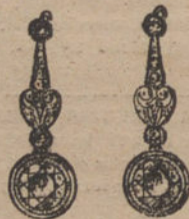
Núm. 5.—Pendientes 6 brillantes y diamantes. Pesetas 1.500.