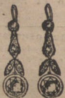
Núm. 4.—Pendientes 4 brillantes y diamantes. Pesetas 800.