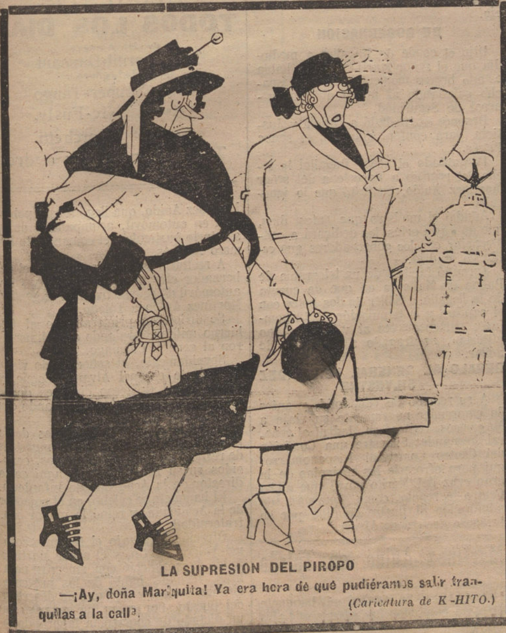
LA SUPRESION DEL PIROPO

Digamos también que ya tiene más de 600 hombres el tabor de Artillería xerifiana, creado por la voluntad omnimoda de Francia. Digamos que los franceses se han apoderado de cuatro baterías, en las murallas de la plaza, sobre la bahía, y dos baterías en el Marxan. Que aumenta paulatinamente el material de guerra. Que Dar Niaba, la residencia del representante del Sultan, está guardada por un destacamento de veinte soldados de Policía francesa, con dos cañones de tiro rápido y varias ametralladoras. Que otro destacamento se ha establecido con el mismo aparato de guerra en el antiguo