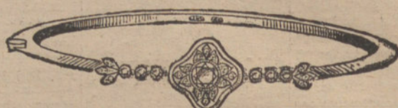
Núm. 2.—Pulsera 1 brillante y diamantes. Pesetas 450.