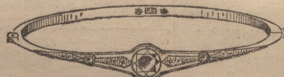
Núm. 6.—Pulsera 3 brillantes y diamantes. Pesetas 1.125.