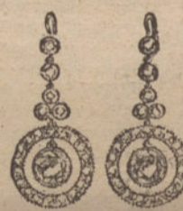
Núm. 3.—Pendientes 6 brillantes y diamantes. Pesetas 825.