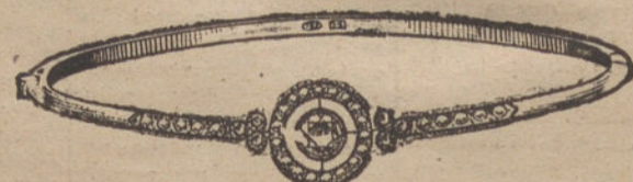
Núm. 3.—Pulsera 5 brillantes y diamantes. Pesetas 600.