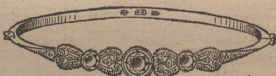
Núm. 5.—Pulsera 3 brillantes y diamantes. Pesetas 900.