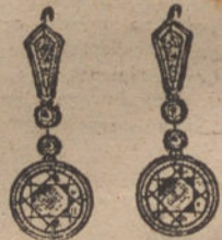
Núm. 6.—Pendientes 12 brillantes. Pesetas 2.775.