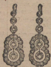
Núm. 1.—Pendientes 10 brillantes y diamantes. Pesetas 450.