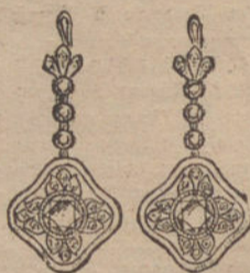
Núm. 2.—Pendientes 8 brillantes y diamantes. Pesetas 700.