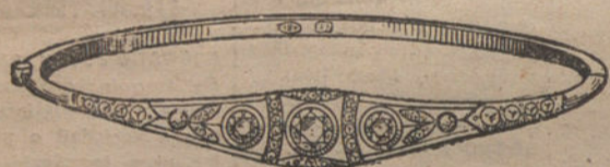
Núm. 4.—Pulsera 5 brillantes y diamantes. Pesetas 725.