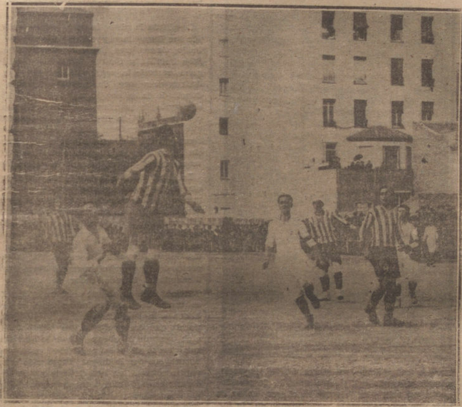
Un detalle del interesante partido de «foot-ball» jugado ayer entre los equipos de Sevilla y Bilbao.

de la extrema izquierda, de aquellos que, aun proclamando una obra de progreso y de redención, realizan una obra de regresión que llevaría al mundo, como ha sucedido en Rusia, a los días más tristes y negros de su historia.» Para luchar con estos elementos, nosotros no podemos olvidar que somos liberales y tenemos que buscar la defensa del orden y el imperio de la justicia en el encauzamiento jurídico de las reivindicaciones que laten en el fondo de una sociedad que se halla en un estado de espantosa convulsión. Y con esto nos exponemos a parecer débiles ante aquellos que consideran que la fortaleza de los Gobiernos está en el empleo de la violencia; nos exponemos a parecer cobarde ante aquellos que para defender a la sociedad amenazada entienden que es lícito el empleo de todos los medios, y frente al terrorismo rojo oponen el terrorismo blanco. Es decir, que el pobre liberalismo, en estas horas difícilísimas, se encuentra expuesto al embate de dos fuerzas que se han salido del cauce legal y expuesto a ser víctima de los unos o de los otros.