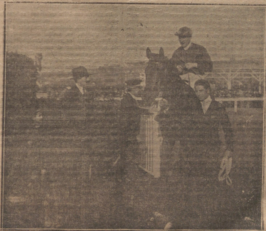
INAUGURACION DE LAS CARRERAS DE CABALLOS.—Caballo «Alor» ganador de la primera carrera.

Recuerda los adversarios poderosos que en todo tiempo tuvo el liberalismo, y dice que ahora los adversarios de éste no vienen sólo de la derecha, sino también