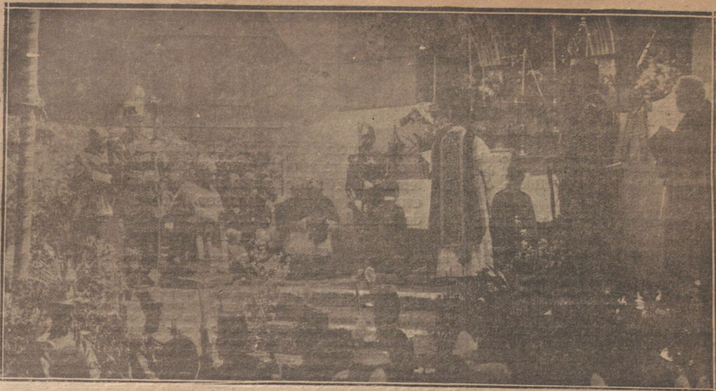
LA FIESTA DEL DOS DE MAYO. Misa de campaña celebrada esta mañana en el Obelisco del Dos de Mayo por el alma de los héroes de la Independencia.

Pregunta si existen liberales en España.