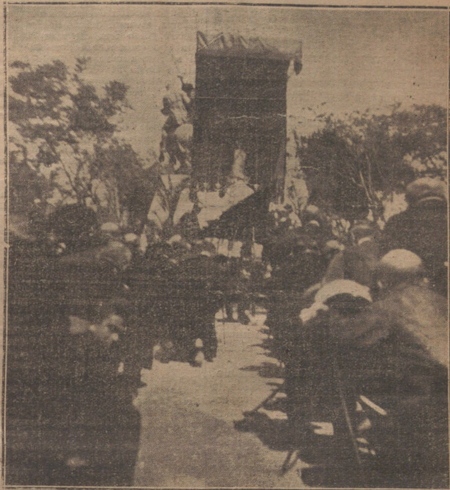
LA JURA DE LA BANDERA EN JAEN. — Misa de campaña celebrada con motivo del patriótico acto.

Pero, ¿acaso los españoles de Tánger promovieron nunca algún incidente? ¿Pudieron jamás las autoridades francesas o las autoridades kabileñas quejarse a España de ningún agravio inferido por los españoles?... ¿A qué culpar, pues, a nuestros compatriotas de levantiscos y provocadores? ¿Por