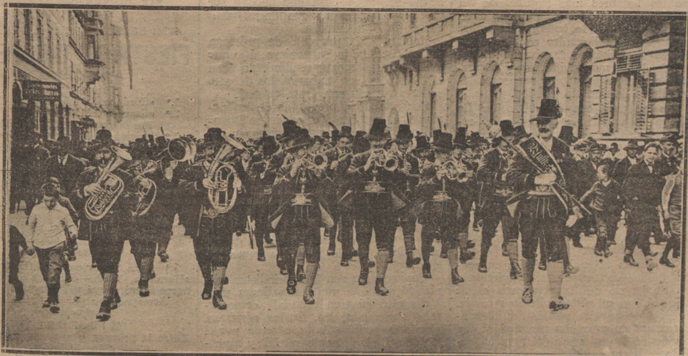
EL PLEBISCITO DE INSPRUCH (Tiroi).—Una de las manifestaciones celebradas por los aldeanos visitando típicamente, a favor de la anexión a Alemania. (Fototyp.)

El día 4 de marzo de 1919 recibió Clemenceau la comunicación oficial del Senado americano, transmitida por