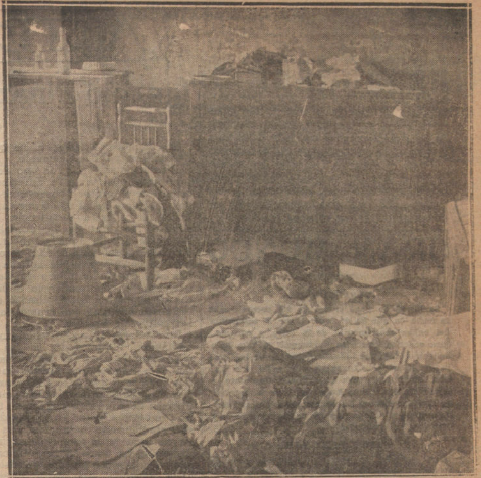
EXPLOSION DE UNA BOMBA EN BARCELONA. Estado en que quedó la casa donde clandestinamente se fabricaban bombas, a consecuencia de la explosión de una de ellas, suceso que ha ocasionado varios muertos y heridos.

Por el ministerio de Marina, y con el fin de que sea lo más numerosa posible la representación de la clase pescadora que concurra a esa Asamblea Internacional, acaba de dictarse una Real orden concediendo facilidades para el viaje a Santander de los representantes de cada una de las Juntas provinciales de pesca existentes. Esto, unido a ser ya grande el número de congresistas españoles inscritos, hace augurar una copiosa y fructífera labor a la Sección nacional del Congreso.