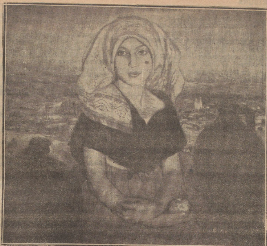
«Serranilla», cuadro nuevo de Pinazo, que figura en su Exposición de la Habana.

mo la dispensada el año pasado por Washington y Nueva York. Pinazo llegó a Cuba silenciosamente. Instaló su Exposición en los salones de la Casa Spaulding. Acudió la gente con un fervor desconocido aquí, y a los pocos días, a las pocas horas mejor, las fotografías de sus cuadros llenaban todos los periódicos.