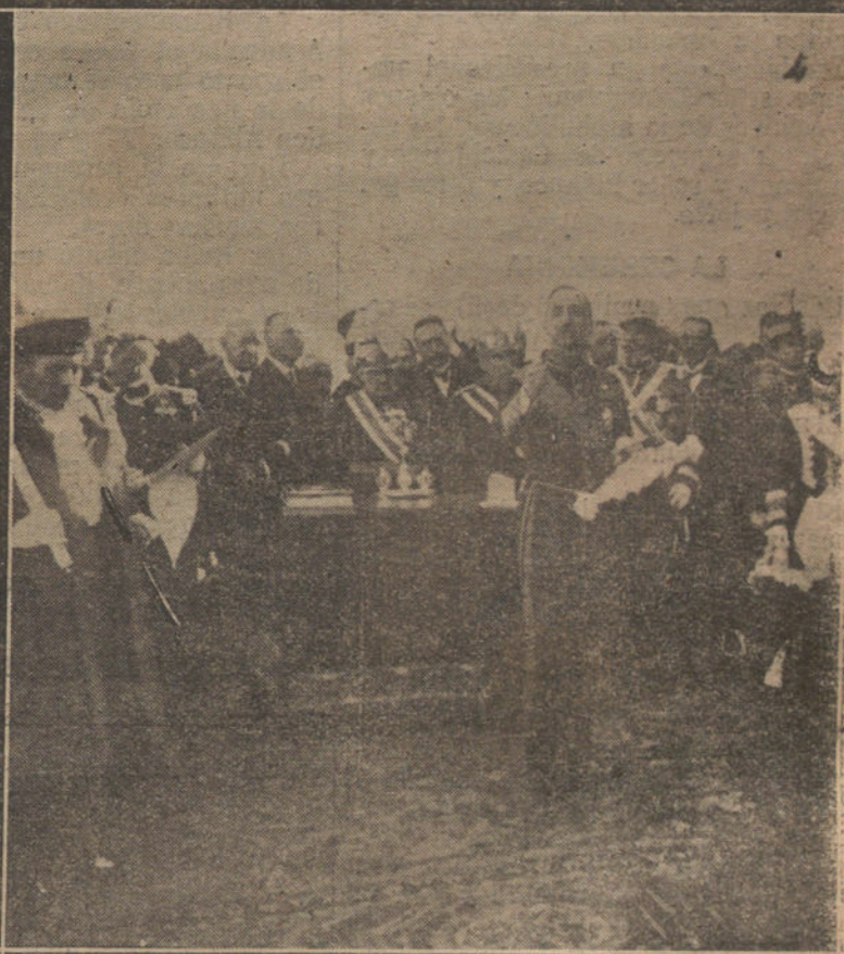
Núm. 1: Sus Majestades los Reyes en el momento de la colocación de la primera piedra del edificio para Academia de Caballería.—2: Sus Majestades en la tribuna Regia durante la ceremonia.—3: Los Reyes en el acto de la colocación de la primera piedra de la Casa de los ferroviarios.—4: El ministro de la Guerra pronunciando un discurso durante las fiestas celebradas en la Academia de Caballería.

LLEGADA DE SUS MAJESTADES VALLADOLID. A las tres de la tarde llegó el tren Real. En el andén se encontraban todas las Comisiones civiles y militares y repre-