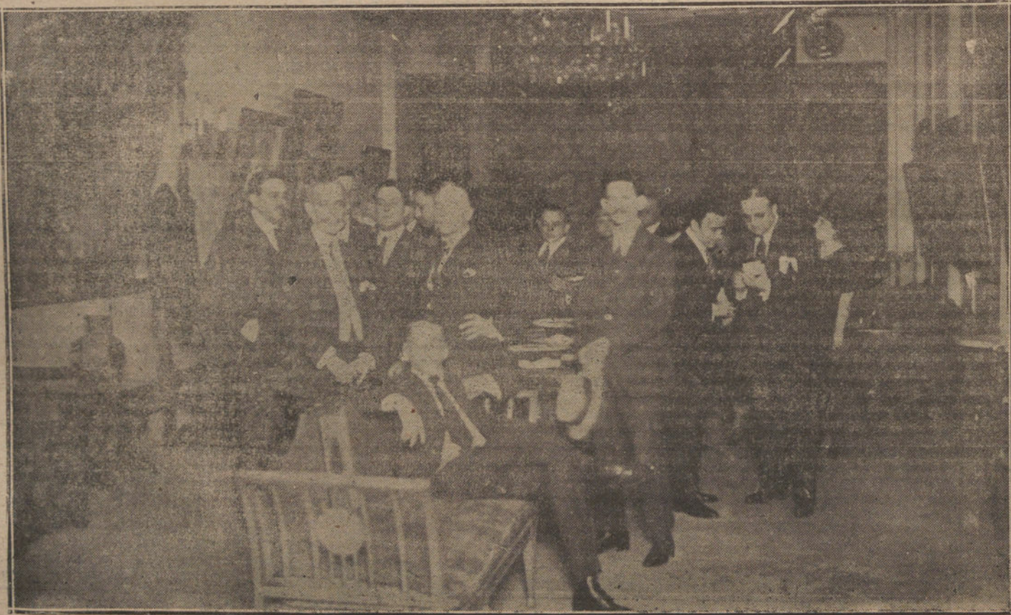
Aspecto de uno de los salones de la Casa Spauldig, de la Habana, donde se ha celebrado la Exposición Pinazo

América poseía de José Pinazo Martínez una referencia incompleta. Primero los Estados Unidos, y ahora Cuba, han tenido ocasión de conocer a una de nuestras primeras figuras contemporáneas. La recepción dispensada en la Habana a Pinazo Martínez ha sido tan entusiasta