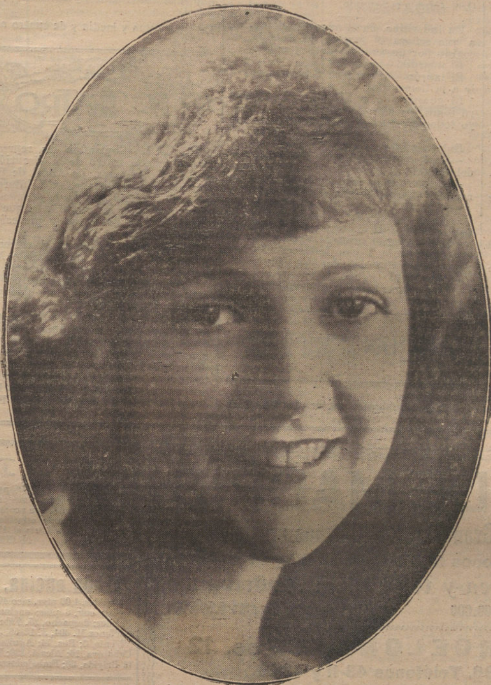
CONSTANCE TALMADGE, A QUIEN EL GENIAL AUTOR DE «INTOLERANCIA» ENCARGO EL PAPEL MAS SIMPATICO Y DE MAS ACCION DE TAN FORMIDABLE OBRA DE LA CINEMATOGRAFIA