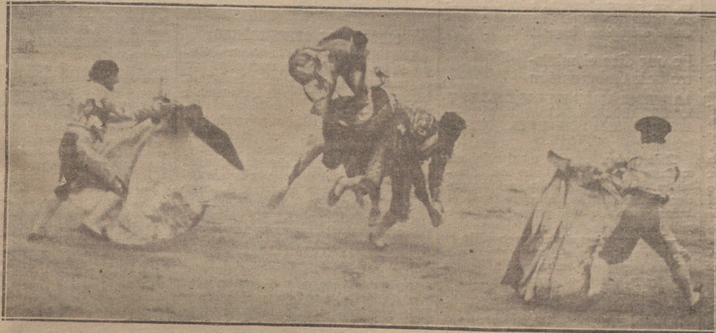
Momento de la cogida de Fortuna.