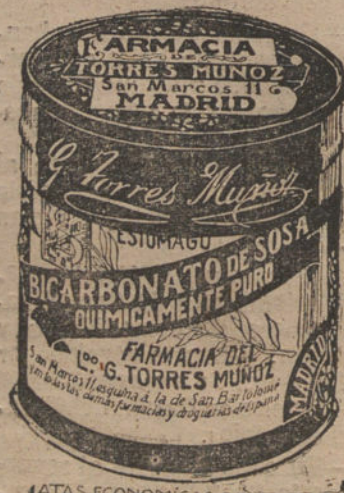
LATAS ECONOMICAS DE 1 1/2 KILOS