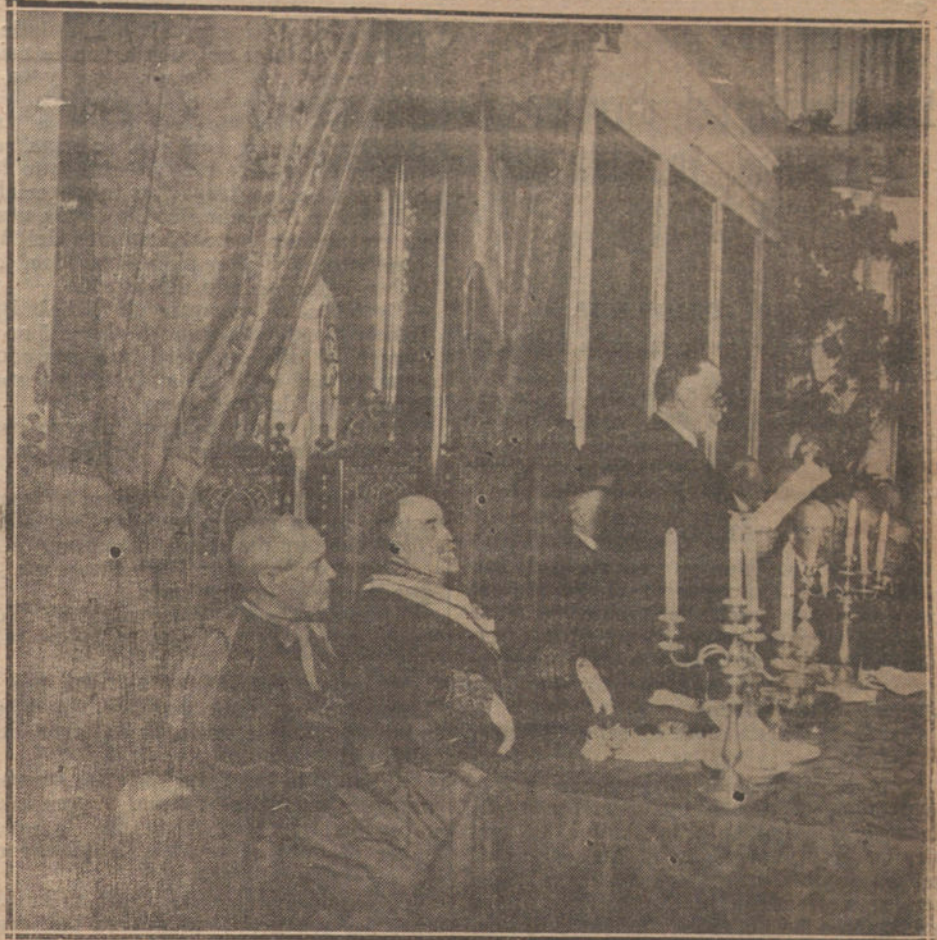
EL CONGRESO DE RIEGOS DE VALENCIA.— Sesión de clausura verificada en el paraninfo de la Universidad, bajo la presidencia del ministro de Fomento.