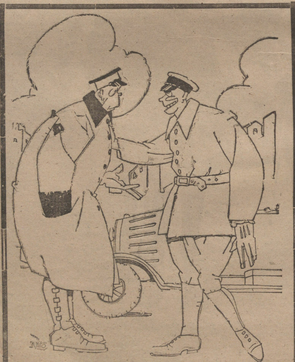
DON MILLAN Y LOS «AUTOS»

EL ANUNCIO EN «LA TRIBUNA» ES EL MÁS PRODUCTIVO POR SU AMPLIA INFORMACIÓN Y SU EXTENSA TIRADA