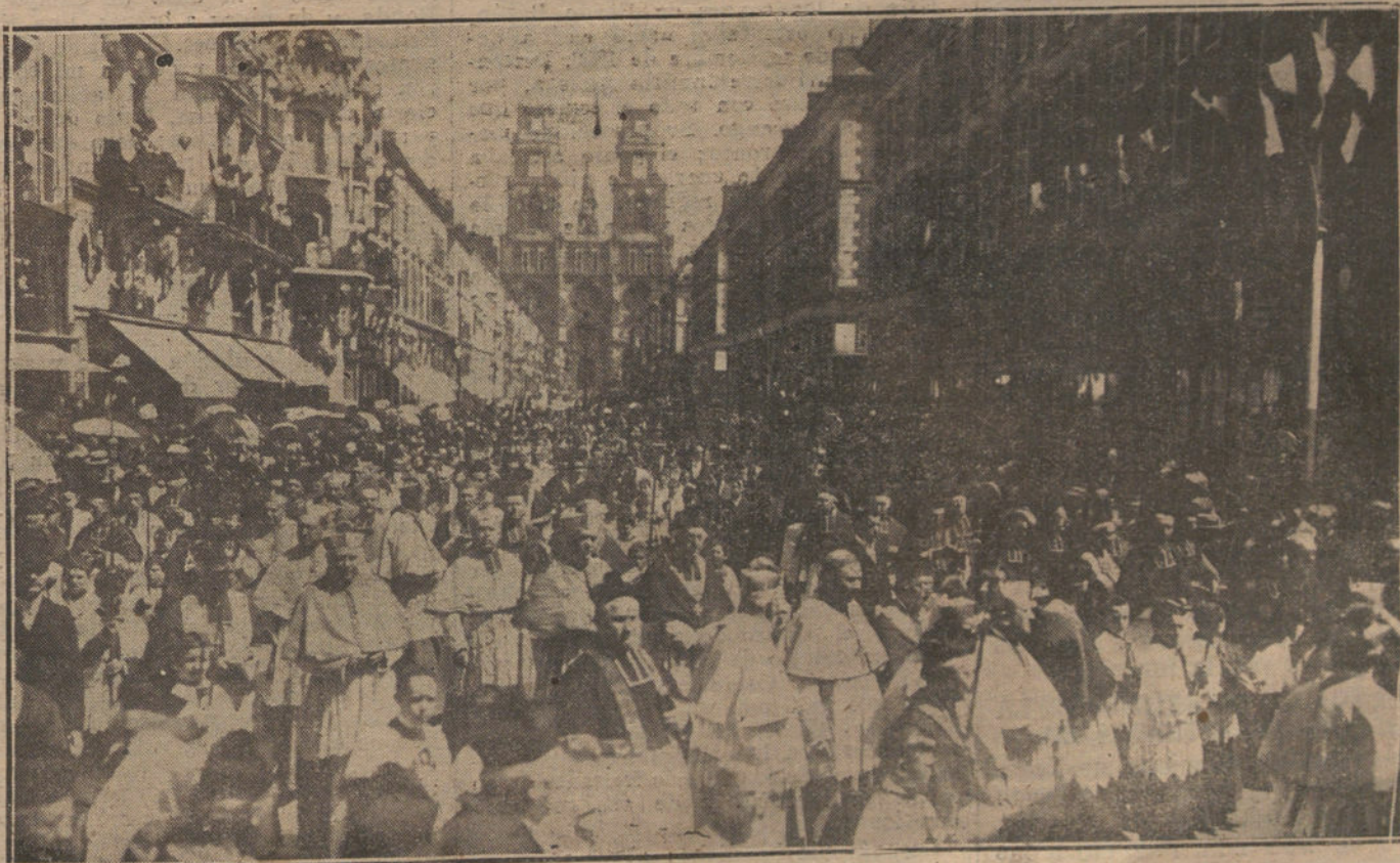
LAS PRIMERAS FIESTAS RELIGIOSAS EN HONOR DE SANTA JUANA DE ARCO. Aspecto de los alrededores de la catedral de Orleans durante el desfile de los prelados que asistieron a la gran procesión celebrada con motivo del homenaje a la santa y heroína francesa.

También se examinó la aplicación de las medidas financieras.