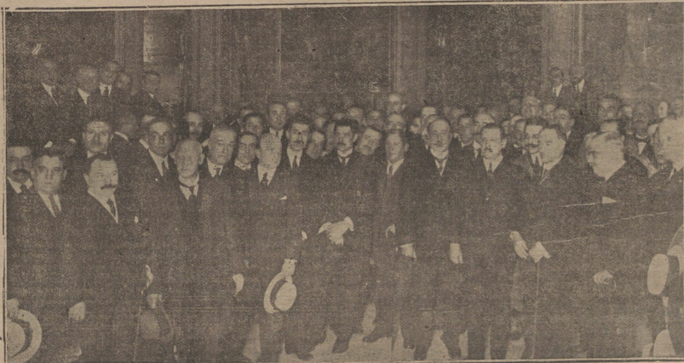
EL HOMENAJE AL GOBERNADOR DE BARCELONA. Representaciones de las entidades económicas del país, que ayer tarde hicieron entrega al señor Martínez Anido del mensaje de adhesión y gratitud a su actuación al frente del Gobierno civil de Barcelona.

SE VENDE BARATO. SIN CORRESPONDENTES. INFORMES: «LA TRIBUNA». R. C.