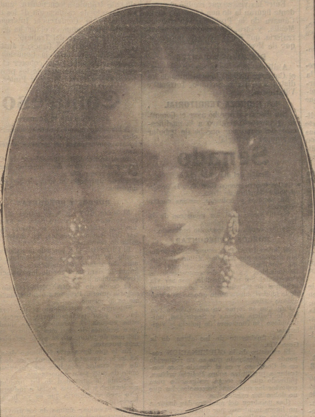
RAQUEL MELLER. LA ILUSTRE Y POPULAR ARTISTA, QUE AL DEBUTAR EN MADRID-CINEMA HA ROTO LA ABSURDA COSTUMBRE DE AQUILATAR MERITOS Y FAMA POR EL LUGAR OCUPADO EN EL CARTEL