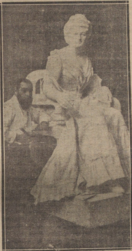
Estatua de doña Emilia Pardo Bazán, erigida en La Coruña.

Ahora, ya aquella estatua de terso rostro y de traje sin amaneramiento, aquella simple gala que esculpió el escultor en postura asilada y de una fría naturalidad, ha entrado en su momento definitivo, se ha asimilado el alma ausente, ha conseguido dejar de estar inflada y disminuida por la duplicidad que era que viviese su representada. Así como la de