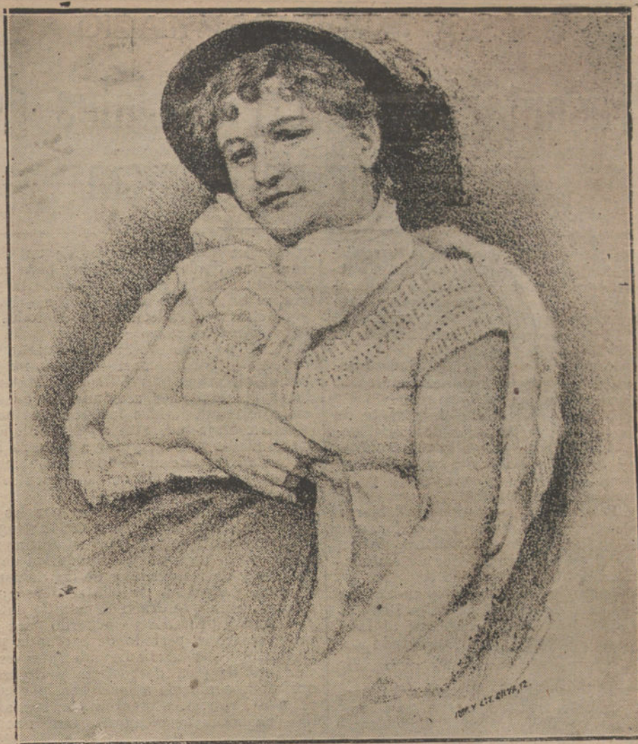
Curioso grabado de la época, en que doña Emilia Pardo Bazán comenzó a popularizarse como escritora.

Galdós fabricada antes de su muerte, está más asentada y hundida con más comodidad y permanencia en su sillón desde que murió su representada, así la de doña Emilia vive la plenitud de su conmemoración desde ayer; pero se volverá más enhiesta y absoluta desde mañana cuando ya esté enterrada bajo las mantas de la tierra la insigne escritora.