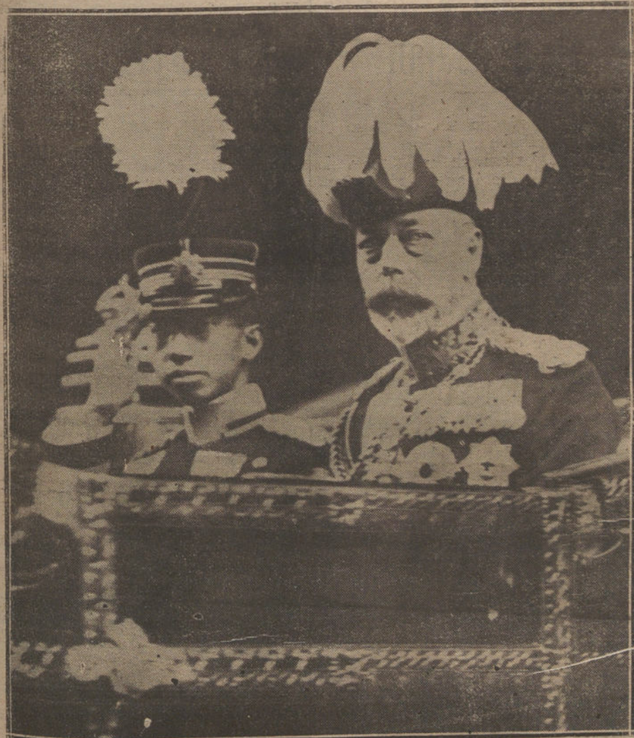
El Príncipe heredero del Japón a su llegada a Londres, acompañado por el Rey de Inglaterra.

Martínez Anido. Después de oír sus informes, el Gobierno estimó que debía persistir en la política proteccionista que inició el señor Dato. En sucesivos Consejos de ministros se trató del problema y se convino en la necesidad de adoptar eficaces medidas que salvaran la industria nacional, amenazada de inminente ruina. ¿Qué ha sucedido, pues, en estos últimos días para que el señor Argüelles se decida a poner en vigor el viejo Arancel con un recargo ridículo, complaciendo así a los extranjeros, que acechan el momento de apoderarse del mercado español? ¿Qué presiones extranjeras han pesado sobre el Gobierno para este cambio de conducta?