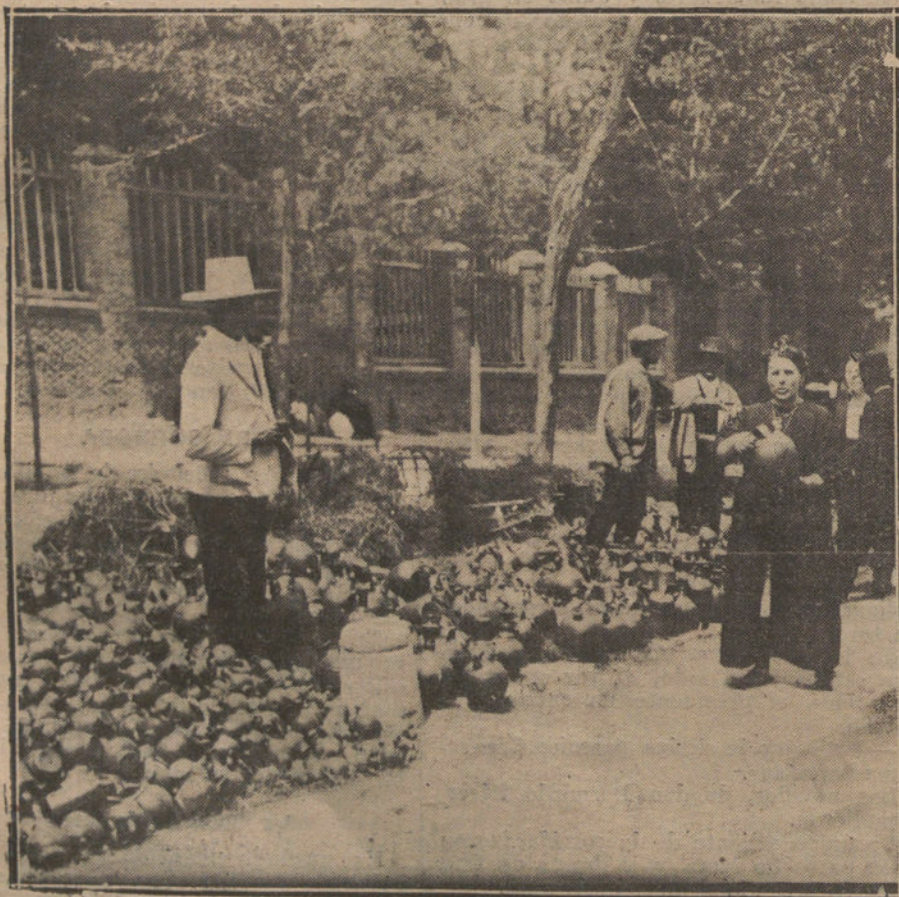
LAS FIESTAS DE SAN ISIDRO.—Un puesto de botijos en la Pradera.