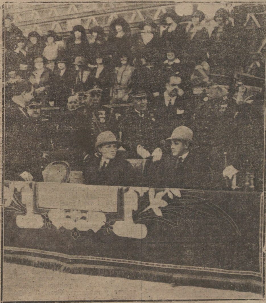
CAMPEONATO MILITAR DE «FOOT-BALL».—El Príncipe de Asturias y el Infante don Jaime presenciando un partido.