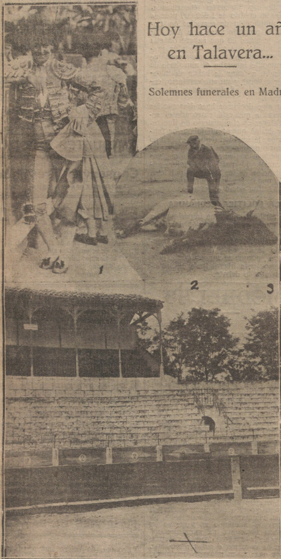
Num. 1: Joselito en la plaza de sus exptos toros.—2: El último toro que mató Joselito en Madrid. Por la actitud pensativa del arriero, dijérase que sobre la Plaza flotaba el presentimiento de la fatal desgracia.—3: Plaza de Talavera donde murió Joselito, con indicación del sitio (X) donde ocurrió la cogida.

Según indicábamos ayer a nuestros lectores, hoy se celebraron en la iglesia parroquial de San José solemnísimos funerales de primera clase, con acompañamiento de orquesta y órgano, por el alma de aquel gran torero que en tal día como éste cayó muerto trágicamente en el circo de Talavera de la Reina.