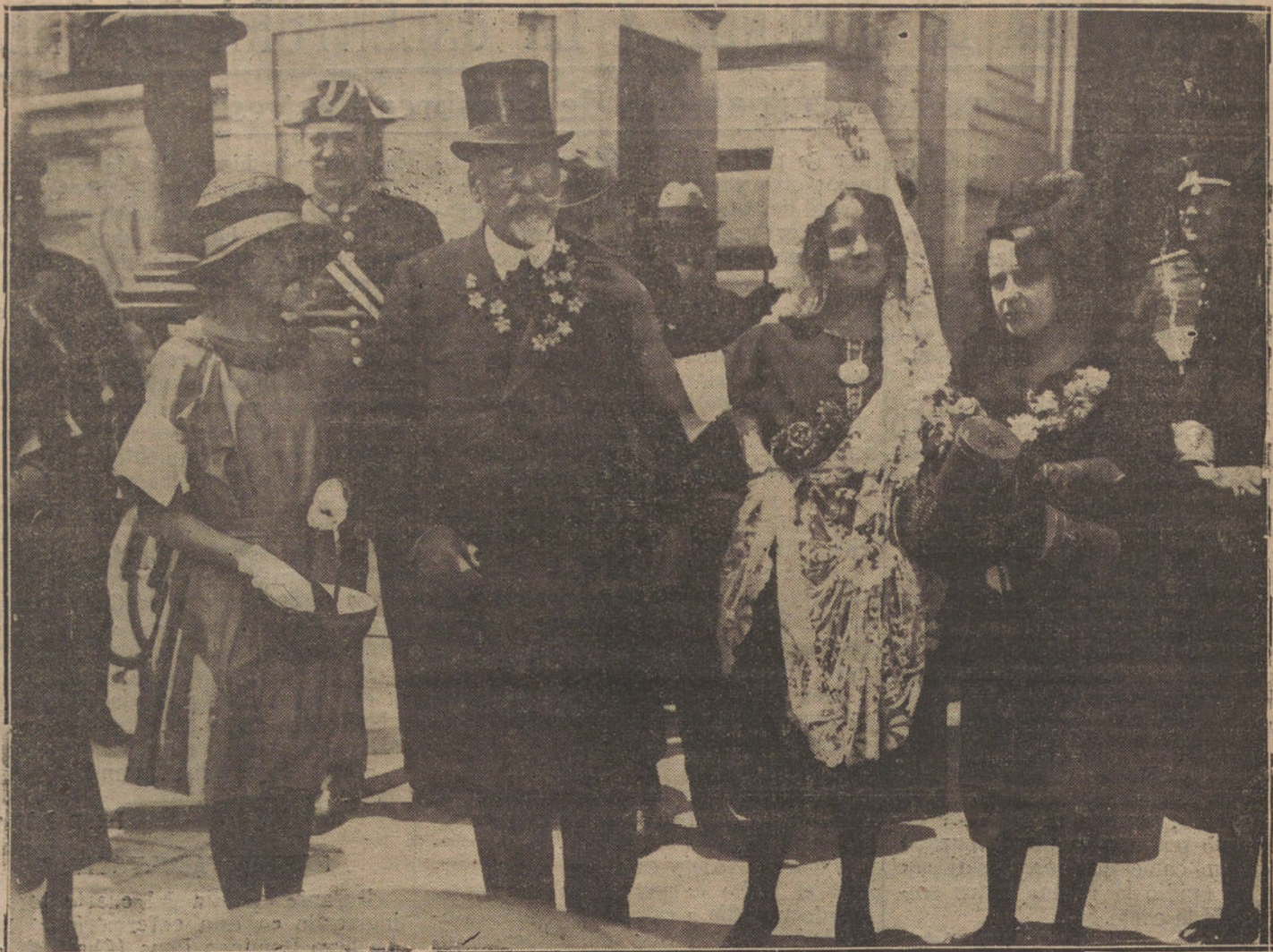
LA FIESTA DE LA FLOR.—Al salir de Palacio el presidente del Consejo, se ve asediado por las señoras postulant.

Con la muleta hace una soberbia faena, con pases de todas las marcas, destacándose dos naturales. (Ovación.) Después receta una estocada colosal, hasta las cintas. (Ovación grande y petición de oreja.)