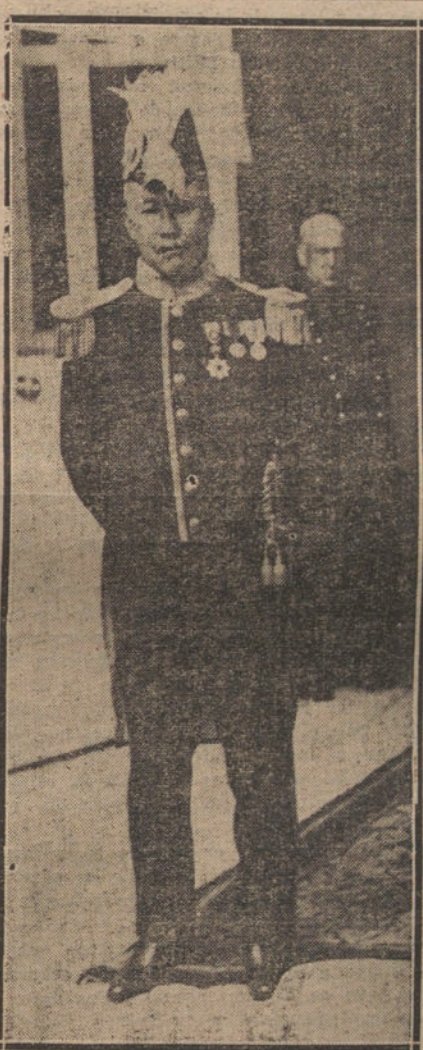
El nuevo embajador del Japón, que ha presentado sus credenciales al Rey.

En estos últimos días han sido muchas las personas que allí han acudido