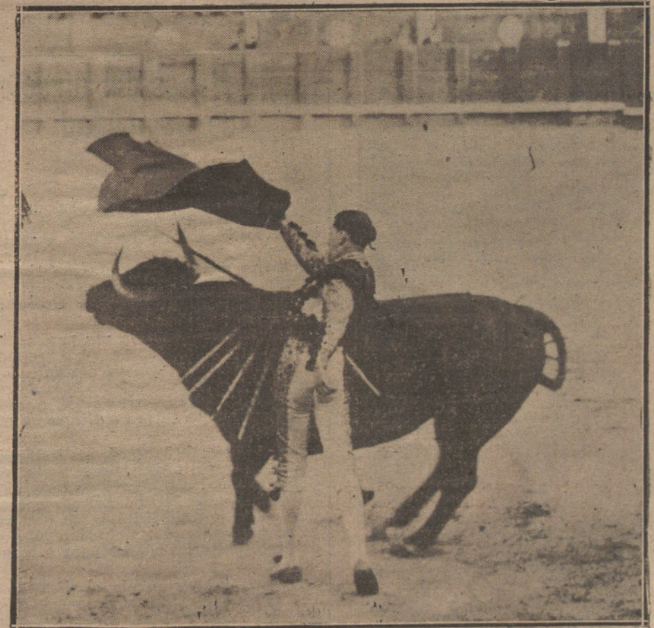
LA CORRIDA DE AYER EN MADRID. — Un gran pasé de torero al toro del que cortó la oreja.