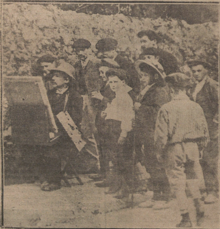
Derío de Regoyos pintando uno de sus paisajes.

Para él el único documento real del paisaje es la sensación, por lo cual en sus cuadros, más que estar el paisaje, está el presentimiento, la evocación, la memoria del paisaje. Quiero decir que ante un cuadro de Regoyos difícilmente «se ve» el paisaje; pero, en cambio, en todos ellos «se siente» el paisaje.