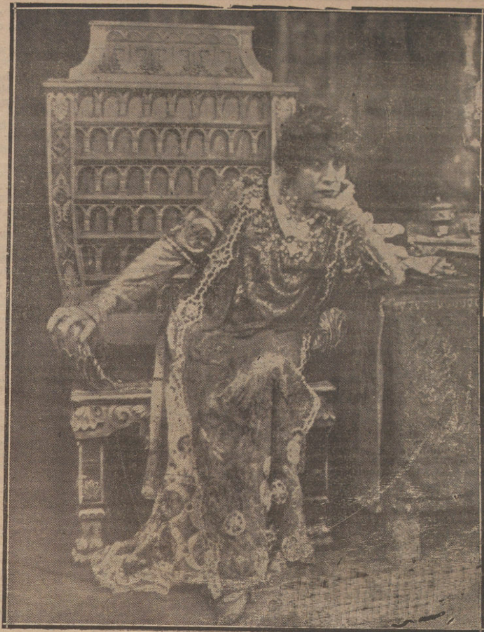
La eminente trágica francesa Sarah Bernhardt, a la que el próximo sábado rendirá Madrid un gran homenaje de admiración en los Jardines del Retiro.