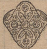
Núm. 4.—Sortija 5 brillantes y diamantes. Ptas. 325.