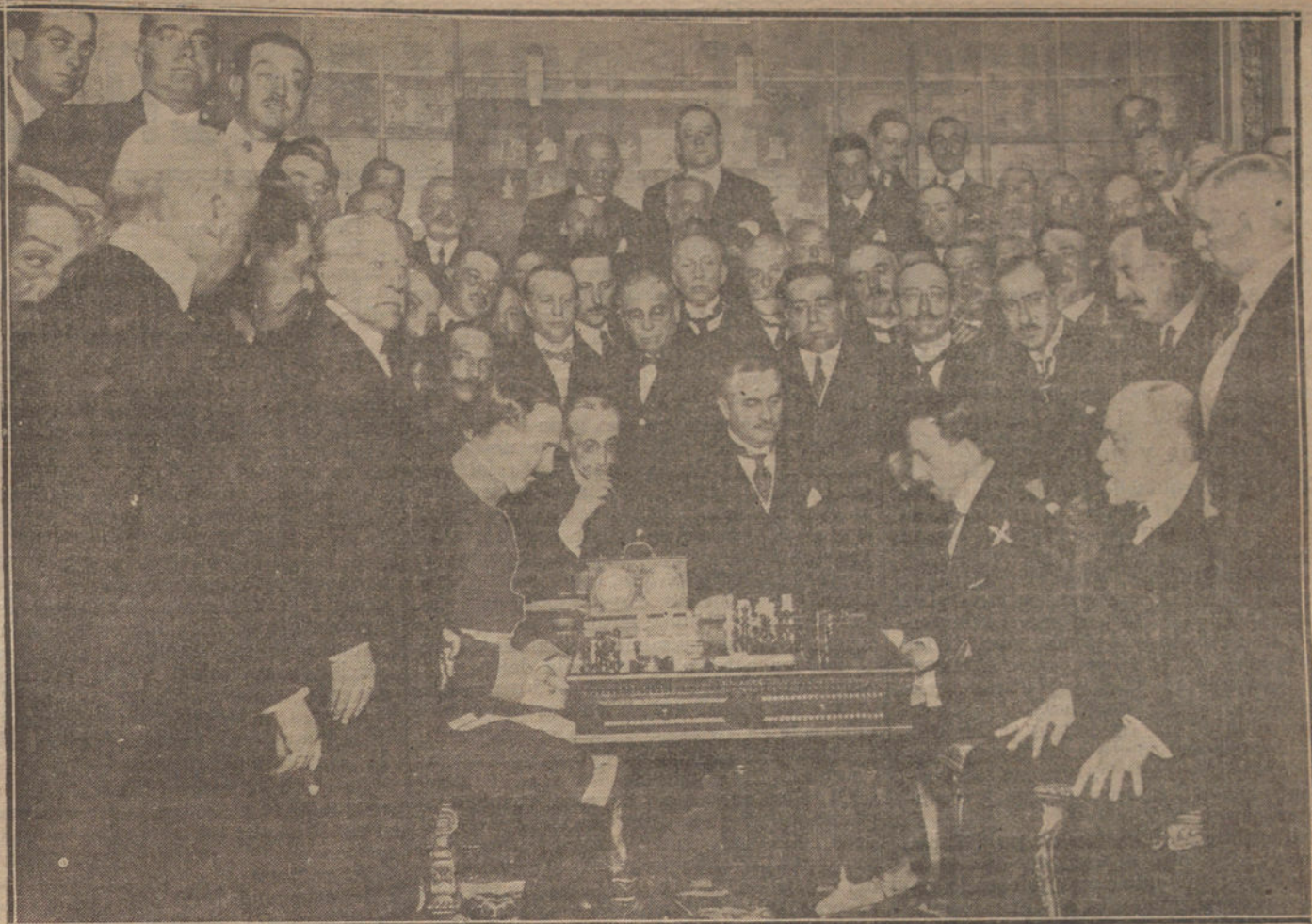
EN EL CASINO DE MADRID. — Su Majestad el Rey jugando una partida de ajedrez con el campeón de España, señor Golmayo, a quien venció.

El Juzgado de Vinaroz se muestra incansable en su interés para descubrir a los autores del crimen.