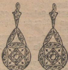
Núm. 6.—Pendientes 4 brillantes y diamantes. Ptas. 800.