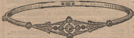
Núm. 7.—Pulsera 9 brillantes y diamantes. Ptas. 400.