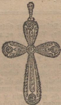
Núm. 1.—Cruz 5 brillantes y diamantes. Ptas. 460.

Con brillantes de primera calidad. Diamantes rosas de Holanda. Monturas de platino fino y oro de ley 18 quilates contrastado