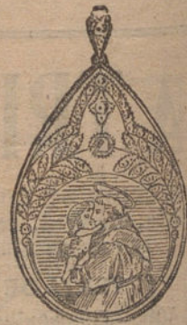
Núm. 5.—Medalla 5 brillantes y diamantes. Ptas. 400.