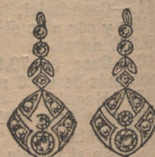
Núm. 8.—Pendientes 8 brillantes y diamantes. Ptas. 460.