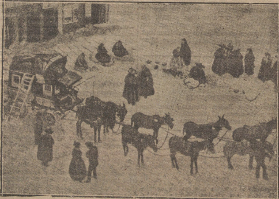
«La diligencia de Soria», cuadro de Regoyos.

nado gusto y exacto sentido de lo que deben ser esta clase de manifestaciones. Los organizadores merecen un aplauso, que yo no regateo.