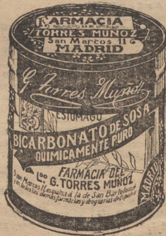
LATAS ECONÓMICAS DE 1 1/2 KILOS