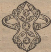
Núm. 2.—Sortija 3 brillantes y diamantes. Ptas. 275.