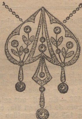
Núm. 3.—Pendentif 10 brillantes y diamantes. Ptas. 750.