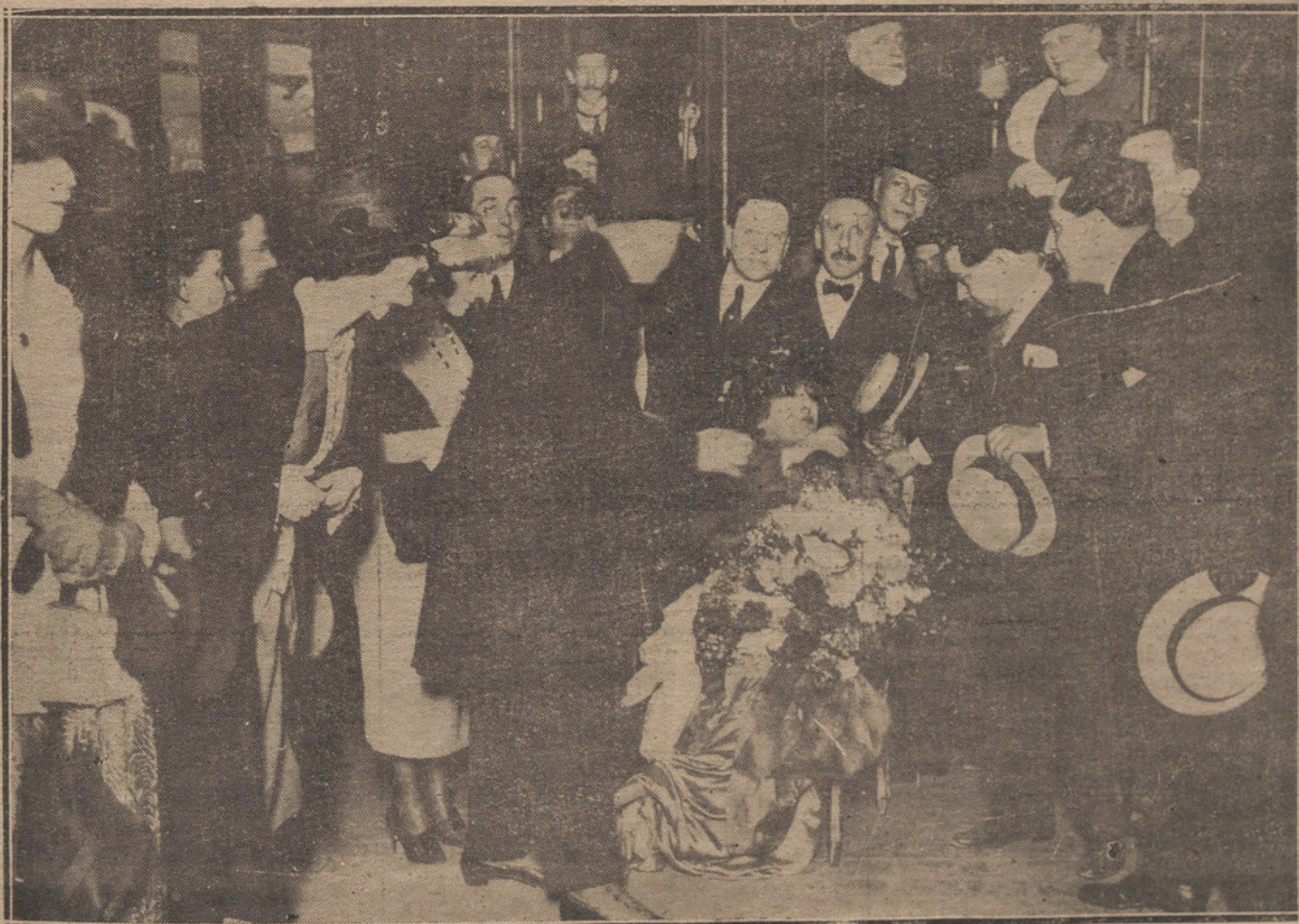
La gloriosa actriz universal Sarah Bernhardt, a su llegada a Madrid.

«La peste invade actualmente la ciudad de Vladivostok y tiende a aumentar. Las autoridades municipales carecen de recursos para combatir el tremendo azote con la eficacia debida. De seguir así, la peste puede constituir un peligro mundial. El Cuerpo consular de Vladivostok ruega al Comité internacional de la Cruz Roja que haga todos los esfuerzos posibles para habilitar de urgencia la suma de 200.000 francos necesaria para asegurar durante un período de dos meses los socorros indispensables.»—Radio.