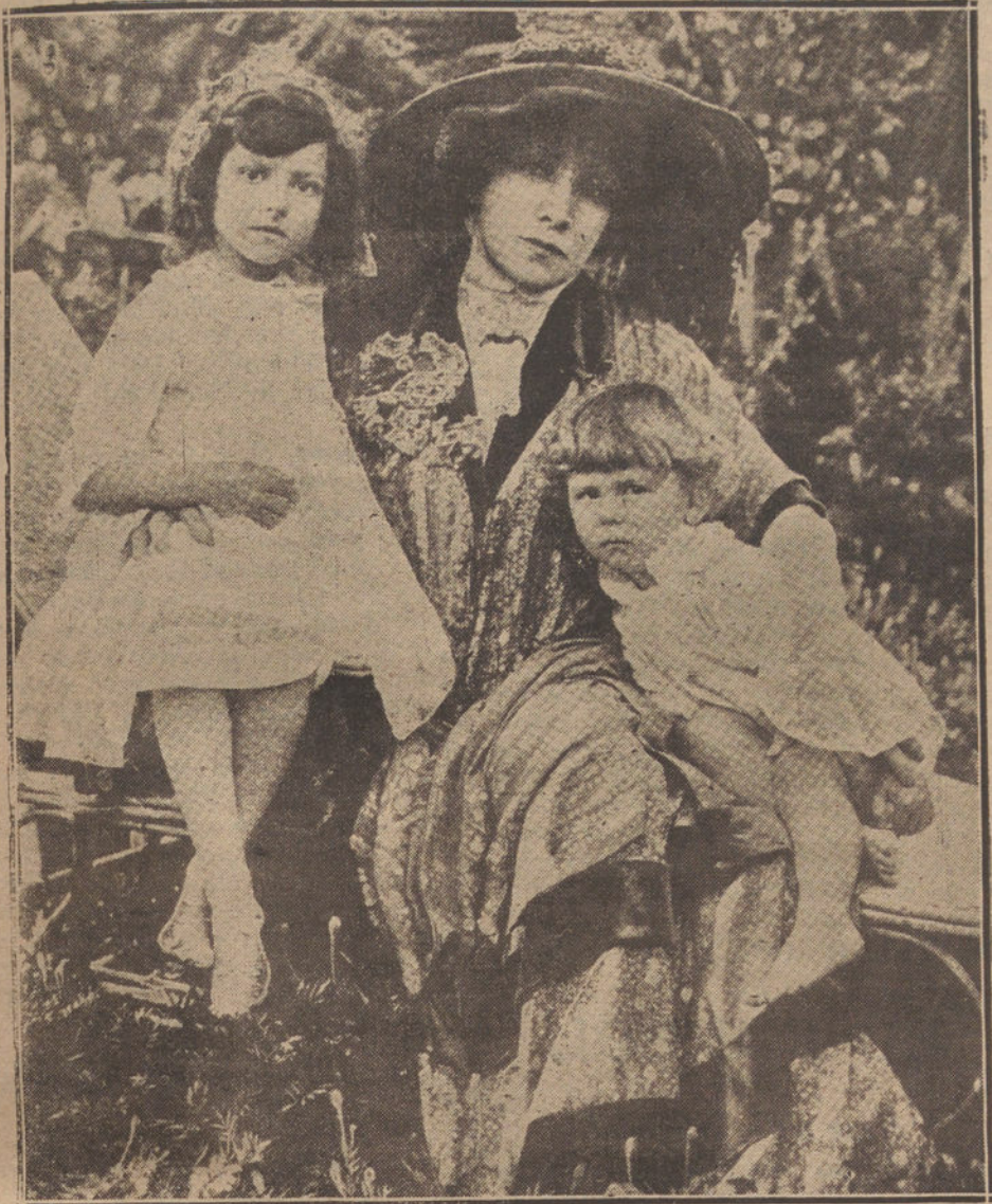
Sarah Bernhardt con sus biznietos hace unos años, antes de embarcarse para los Estados Unidos, donde fue a encargarse una pierna mecánica para sustituir la que le faltaba.

I Parece que me encaro con Eva en este prólogo de la biografía de Sarah Bernhardt. Parece que asistió a aquel rosicler del mundo en que por primera vez la primera mujer puso cara trágica y se preguntó dónde estaba, como en una vasta escena desconocida, en la que todos fueron misterios. ¿Qué diálogo más interesante y más dramático el que sostuvo con Adán, al que dijo: a lo hecho, pecho! Así fue ella la que inauguró el que iba a llamarse Teatro de la Vida. La Sarah Bernhardt—varias veces he querido llamarla Sarah sólo, y no me he atrevido y no he podido porque hay personas a las que no se las puede dedicar esa especie de tuteo que es el citarlas sólo por su nombre—la Sarah Bernhardt es la protagonista del Universo desde entonces acá. Alguien tiene que ser la protagonista del mundo. Entre los papeles universales que se