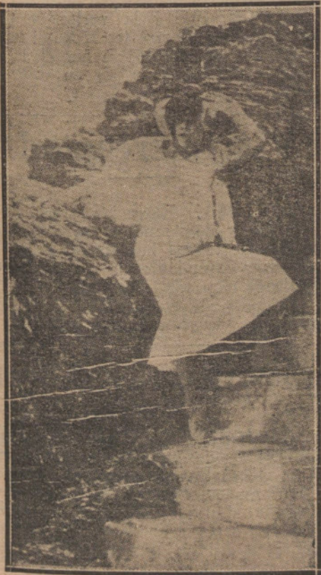
Sarah Bernhardt en la escalera de un castillo en Belle-Isle.

I Parece que me encaro con Eva en este prólogo de la biografía de Sarah Bernhardt. Parece que asistió a aquel rosicler del mundo en que por primera vez la primera mujer puso cara trágica y se preguntó dónde estaba, como en una vasta escena desconocida, en la que todos fueron misterios. ¿Qué diálogo más interesante y más dramático el que sostuvo con Adán, al que dijo: a lo hecho, pecho! Así fue ella la que inauguró el que iba a llamarse Teatro de la Vida. La Sarah Bernhardt—varias veces he querido llamarla Sarah sólo, y no me he atrevido y no he podido porque hay personas a las que no se las puede dedicar esa especie de tuteo que es el citarlas sólo por su nombre—la Sarah Bernhardt es la protagonista del Universo desde entonces acá. Alguien tiene que ser la protagonista del mundo. Entre los papeles universales que se