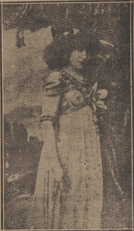
Sarah Bernhardt en su primera época.

reparten en el mundo, en el primero pone Protagonista del mundo, y se lo asignaron a la Sarah Bernhardt en su tiempo. En sus palacios en sus casas de campo en sus pisos de París—muchos en distintas calles—tiene los trajes innumerables de los papeles que hizo, muchos trajes bardados en oro, muchos trajes talaros y muchos mirinaques, muchos trajes absurdos de esas modas de último del siglo XIX, que desbarataron a la mujer, que la hicieron una figura lamentable y mediocre. Son esos trajes embutidos en los anchos armarios como bibliotecas, los cadáveres de los muchos papeles que representó, la huella de muchas noches.