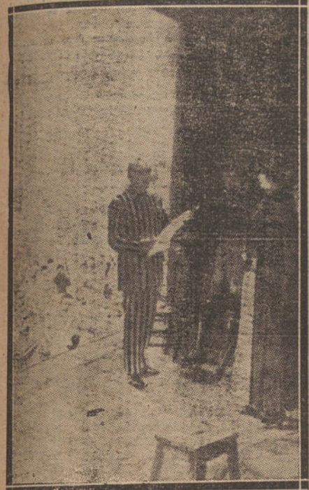
SARAH BERNHARDT EN UNA PRISION YANQUI. Un recio leyendo un discurso de gratitud a la insignia trágica francesa, después de la representación.

Sarah ha representado delante del Emperador de Francia, que se rio de su cortedad de entonces y ha ido conociendo a todos los artistas y los políticos. Entre las figuras que ella describirá después está la de Coppée. Fué du-