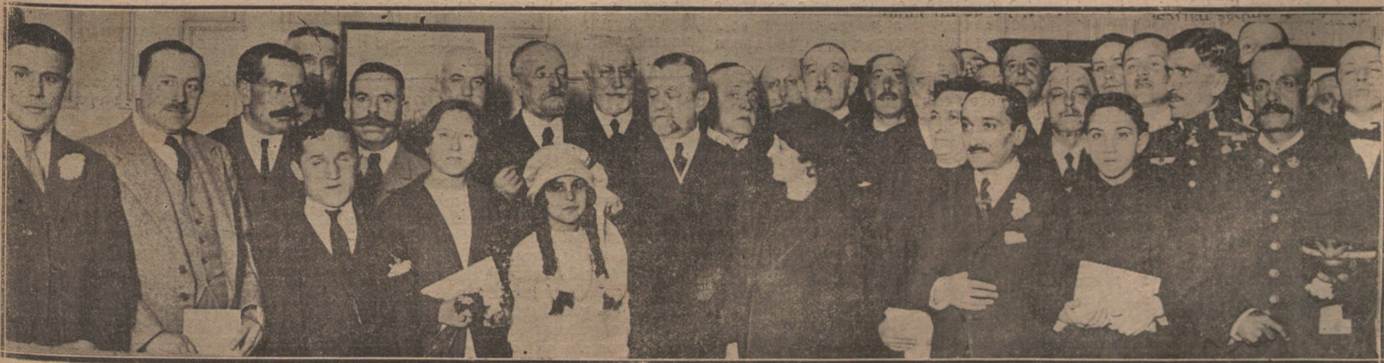
Grupo de personas premiadas en el Certamen Nacional de Ahorro, acto al que asistieron los ministros de la Gobernación y del Trabajo.

Es la primera vez después de la guerra que sabios alemanes se reúnen en un Congreso internacional con sus colegas ingleses. Hasta ahora, estos últimos, lo mismo que los sabios franceses, se negaron a colaborar con los ex enemigos.—Radio.