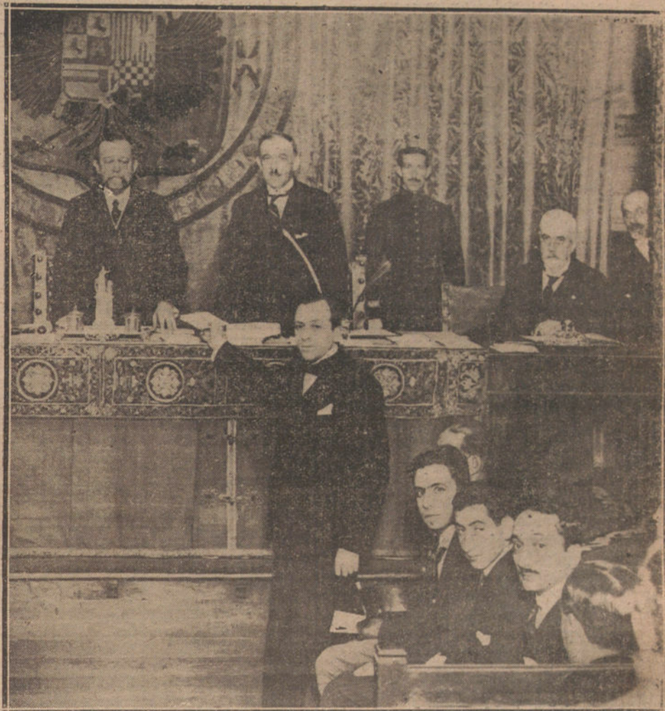
El ministro de la Gobernación entregando los premios del Certamen Nacional de Ahorro.

Hay más: el interés a las acciones, según las Compañías, no pasaba del 5 por 100, según el proyecto del señor La Cierva, puede llegar al 5 por 100.