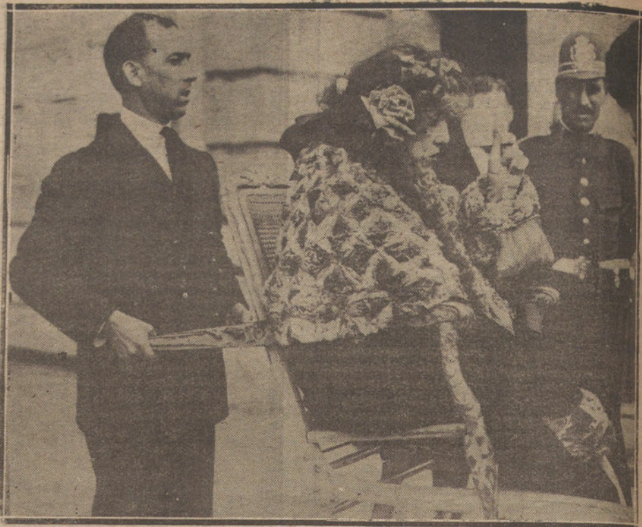
Sarah Bernhardt al salir ayer de Palacio, después de recibir las insignias de la cruz de Alfonso XII, que le ha sido concedida por Su Majestad el Rey.

Justicia, doctor don Erasmo Renieros. Gobernación, don Francisco Martínez. Hacienda, doctor don Sebastián Gelabert. Obras públicas, doctor don Orlando Freyre. Agricultura, Comercio y Trabajo, doctor don José María Collantes. Instrucción pública y Bellas Artes, doctor don Francisco Zayas Alfonso. Salud y Beneficencia, doctor don Juan Guiteras. Guerra y Marina, general don Demetrio Castillo Duany. Secretario de la Presidencia, doctor don José Manuel Cortina.