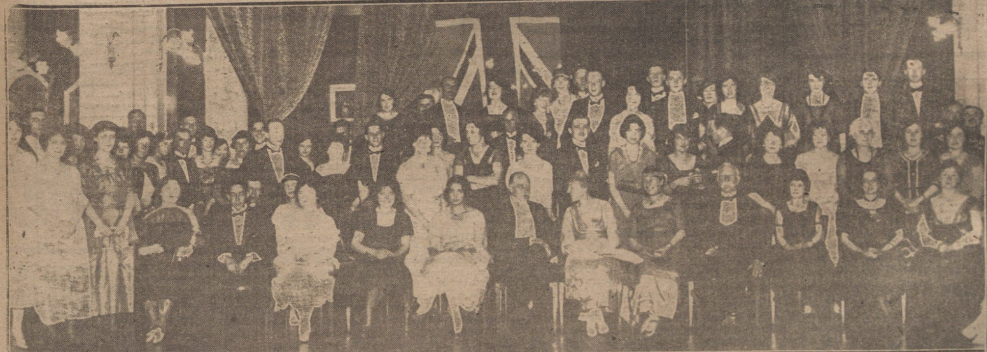
EN EL PALACE HOTEL. —El embajador de Inglaterra y su esposa, Lady Howard, rodeados de la colonia inglesa residente en Madrid, que se reunieron para festejar el «Empire Day».

Monsieur Briand reconoce el espíritu de grandeza de Wirth. «Francia—dice Briand—tiene la fuerza».