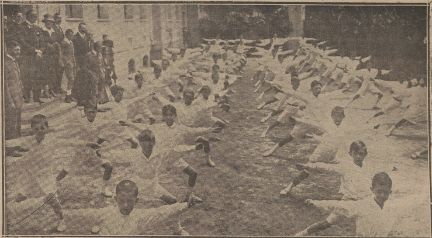
Alumnos del Colegio Alemán durante las ejercicios de gimnasia rítmica verificados ayer.

Se ha reunido el Consejo de Administración de la Compañía Hispano-Americana de Electricidad y ha aprobado la Memoria, balance y cuenta de ganancias y pérdidas correspondientes a 1920. El balance, que alcanza la suma de