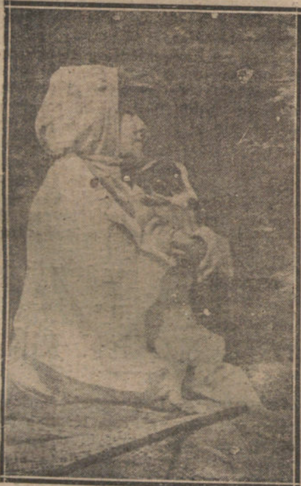
Sarah Bernhardt con el perro que se murió.

He obedecido a una superstición, a un prejuicio y a un gran tópico decorativo, o he dicho la verdad?