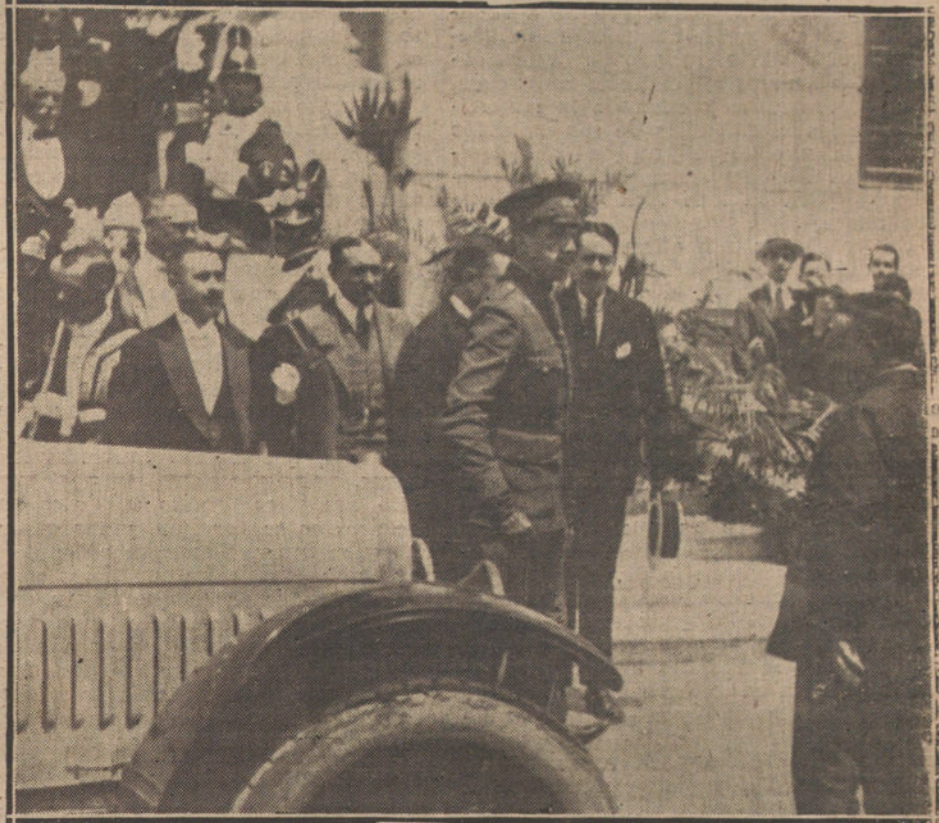
EL VIAJE DEL REY.—Su Majestad a su llegada al Ayuntamiento de Málaga, donde fué obsequiado con un banquete.

El señor La Cierva es uno de esos personajes que el Destino prepara cuando quiere disolver una nación.