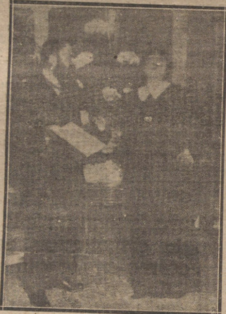
La trágica Sarah Bernhardt y el autor dramático Tristán Bernard, ensayando un propósito teatral para una función benéfica.

Desde hace muchos años Sarah se dedicaba a un teatro convencional, lleno de Damas de las camelias, noche tras noche, llenando de mo-