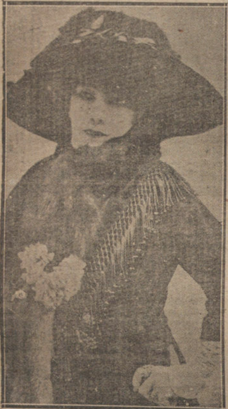
Sarah Bernhardt condecoraba a sus amigos. Está un poco arruinada. Ha gastado los billetes de Banco como centimos chicos.

En día en escena Sarah se arrodilla, se clava una astilla, una espina, y eso se encona, sobreviene la gangrena, y el médico pronuncia esas palabras urgentes de: «Hay que cortar la pierna hoy mismo, cuanto antes». En efecto, la delicada pierna de Sarah es cercenada, y parece que hoy ocupa su sitio entre esos pedregos de figura humana que decoran las clases de dibujo y de las que copian los muchachos. Sarah ya está en su más obligada decadencia, lejos la época en que maceraba las sedas para que la forjasen la mejor seda, lejos los días en que, después de fundar la orden de