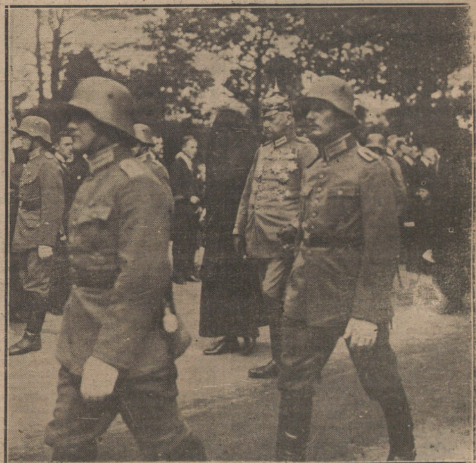
El mariscal Hindenburg con el conde de su esposa.

A consecuencia de sus declaraciones se dió orden de capturar a varios de los que operaban con él.