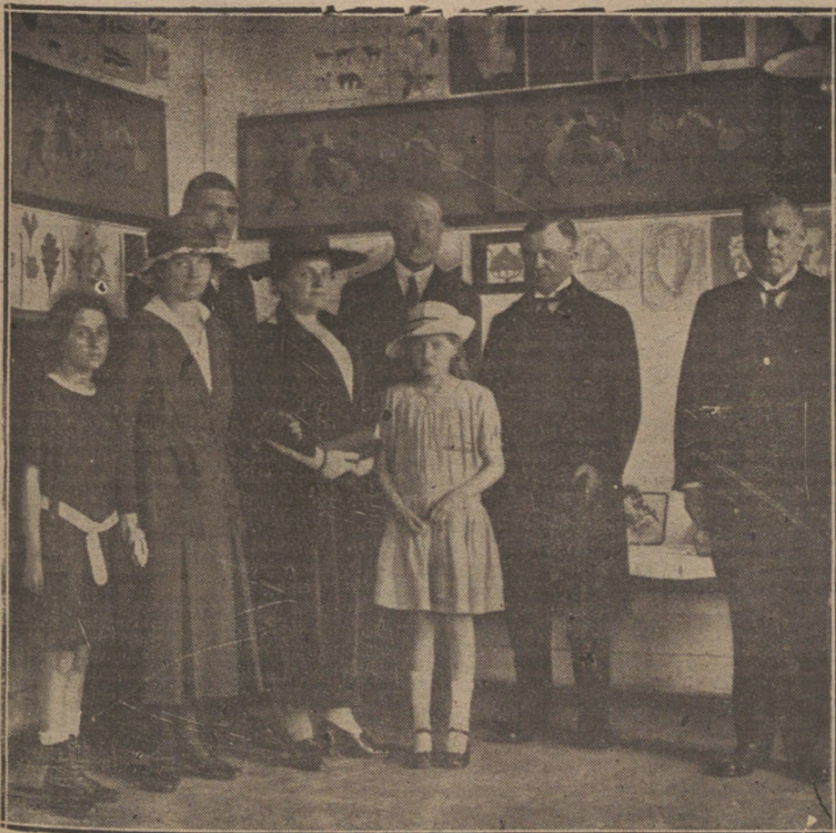
El embajador de Alemania y el director del Colegio Alemán, que asistieron a los festejos celebrados en dicho Centro docente.

Los agresores no pudieron ser detenidos.