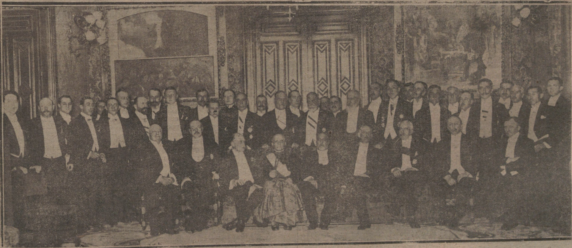
Banquete de despedida ofrecido anoche al cardenal Ragonesi y al embajador de los Estados Unidos, Mr. Willard, en el ministerio de Estado, acto al que concurrió el Cuerpo diplomático acreditado en Madrid.

peles. La depreciación de la moneda y la apertura de las fronteras podrán originar particulares fortunas — otra edición de nuevos ricos, como en el período de la guerra, algunos ya convertidos en ex ricos —; pero, en general, nos llevarán a la ruina. Ni la excusa de haber protegido a la agricultura podrá presentarse, pues