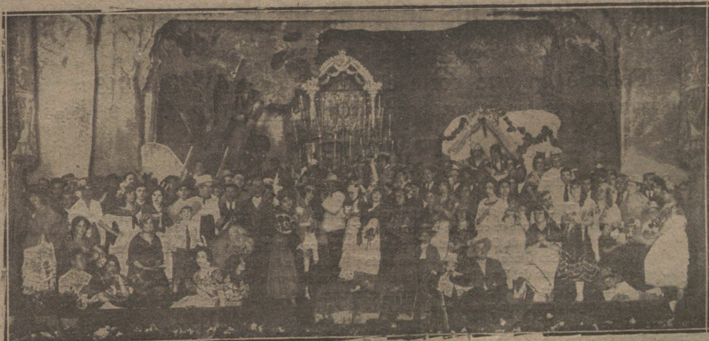
Uno de los cuadros plásticos dirigido por el eminente pintor Gonzalo Bilbao, que representaron distinguidas señoras de la buena sociedad sevillana en la función celebrada en aquella ciudad a beneficio de la Caja Dotal y de Ahorros de los Sindicatos católicos femeninos, a cuyo acto asistieron sus Altezas doña Luisa, doña Isabel y don Carlos.