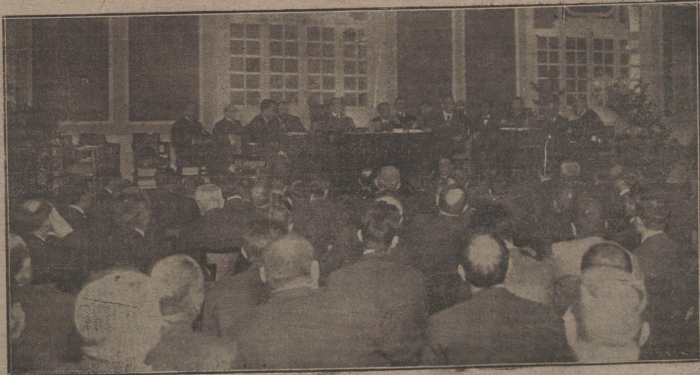
Un aspecto del Ideal Retiro durante las sesiones de la Asamblea reformista.