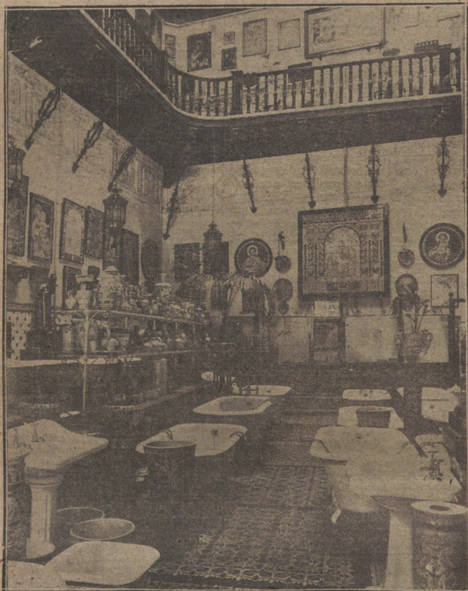
Casa de Sevilla: Un de talle de la Exposición.

Sevilla: Cánovas del Castillo, 16. Córdoba: Gran Capitán, 19