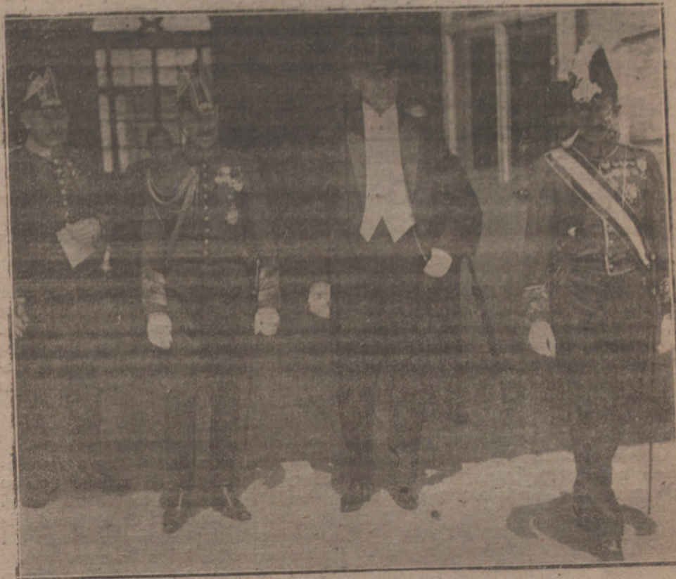
El primer ministro plenipotenciario de Checoslovaquia en España, Mr. M. Los-Kor, saliendo de Palacio después de presentar sus cartas credenciales al Rey.

El cacique murciano a nada dice que no. Oyéndole hablar parece a todos un defensor decidido del trabajo nacional; pero llega la hora de las realidades, y unos informes secretos del ministro de Estado, en forma de amenazas, son suficientes para que el señor La Cierva deponga su actitud proteccionista y se una a la política de contemplaciones económicas con las grandes naciones, que tienen a España reducida al papel de colonia.