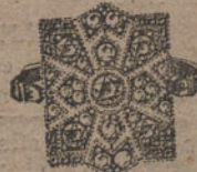
Núm. J. 1.376.—Sortija todo platino, 16 brillantes, 10 rosas y zafiros calibrados. Ptas. 1.050.

Factura de garantía en todas las compras. Venta al por mayor y menor Envíos por correo a todas partes remitiendo su importe.