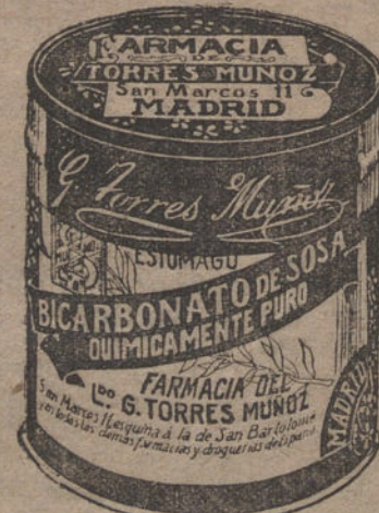
LATAS ECONÓMICAS DE 1 1/2 KILOS

Ovoides, 4 ptas. saco 40 kilos; antracita 1.ª, 6 ptas.; 2.ª, 5 ptas.; cok, 6 ptas.; encina 1.ª, domicilio, 27 cént. desde 10 kilos; despacho, 26. Fábrica y almacenes: Peñuelas, 10, teléfonos M. 604, J. 13-55, J. 373 y S. 186. Despachos: San Vicente, 3; Poz, 14; Aguilera, 47; J. y María, 6; Barco, 13; Calatrava, 16; Alcalá, 130; Valencia, 2; G. Quvedo, 3; Santa Brígida, 33; Embajadores, 37.