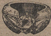
Núm. J. 3.003.—Sortija oro y platino, 1 brillante primera calidad. Ptas. 3.200.