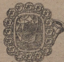
Núm. J. 2.117.—Sortija todo platino, 16 brillantes y centro zafiro fino. Ptas. 1.200.