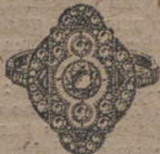
Núm. J. 1.738.—Sortija oro y platino, 8 brillantes, 46 rosas, 4 zafiros. Ptas. 750.