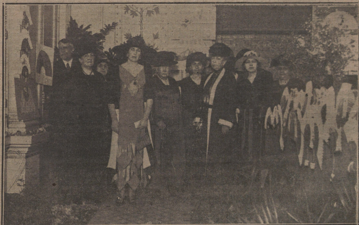
EN LA CASA DE «BLANCO Y NEGRO» Y «A B C».—Sus Majestades las Reinas Doña Victoria y Doña María Cristina inaugurando la Exposición de abanicos instalada en los salones del referido edificio.

den, por tanto, un número justo o menor, se podrán aprovechar y cobrar su rendimiento a precios altos; pero cuando acuden en cantidades exageradas, la remuneración es escasa, pues se establece inmediatamente la competencia y la necesidad hace que se llegue a ofrecimientos mínimos.