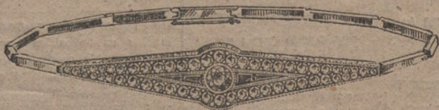
Núm. J. 675.—Pulsera oro y platino, 1 brillante, 54 rosas y zafiros finos. Ptas. 850.

es la que da mayores garantías a sus clientes y la que vende un 30 por 100 más barato que ninguna otra