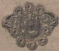
Núm. J. 2.191.—Sortija oro y platino, 10 brillantes, centro esmeralda fina. Ptas. 700