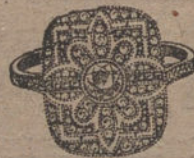
Núm. J. 1.740.—Sortija todo platino, 1 brillante, 40 rosas, 8 zafiros calibrados. Ptas. 950.