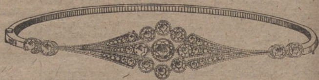
Núm. J. 1.889.—Pulsera oro y platino, 11 brillantes, 12 rosas primera calidad. Ptas. 875.