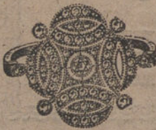
Núm. J. 1.560.—Sortija oro y platino, 16 brillantes, 40 rosas. Ptas. 700.