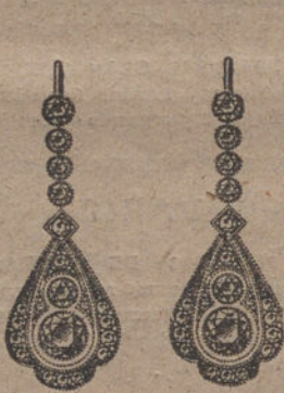
Núm. J. 2.819.—Aretes oro y platino, 12 brillantes, 30 rosas, primera calidad. Ptas. 1.200