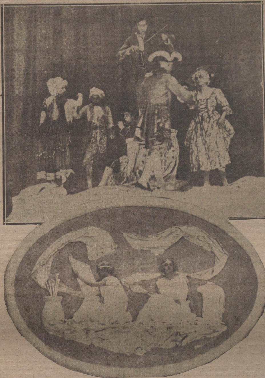
Cuadros animados, representando por collanas, que constituyeron una nota de arte en el festival celebrado ayer por la Asociación de Escritores y Artistas, en el teatro de la Princesa.

En todo país hay un determinado número de lugares de trabajo para cada clase de razas. Pero esos puestos son en número limitado. Cuando acu-