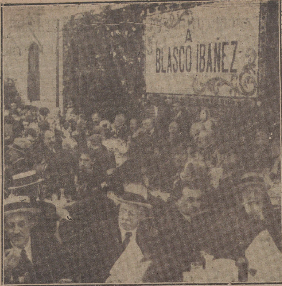
HOMENAJE A BLASCO IBÁÑEZ. — Mesa presidencial y grupo de concurrentes al banquete con que fue obsequiado ayer el insigne novelista valenciano.

día 4, a la una y media de la tarde, en el restaurante Excelsior, se celebrará el banquete organizado por los admiradores del notable pintor Cruz Herrera con motivo de su próximo viaje a América. El pedido de tarjeta es considerable, y todo hace suponer que al distinguido artista se le tributará un homenaje digno de su renombre.