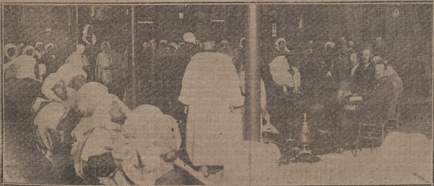
NUESTRA ACCION EN AFRICA.—Té ofrecido por la oficialidad indígena de Melilla, en los salones de la Exposición permanente de los Centros Comerciales Hispanomarroquíes, en honor de los caídos de dicha zona española.

Una enmienda autoriza al presidente Harding a invitar a Inglaterra y el Japón a participar en una conferencia que discutirá la limitación de los armamentos navales, durante cinco años.—Radio.