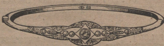
Núm. 1.—5 brillantes y diamantes. Pesetas 375.

Brillantes de primera calidad :: Diamantes rosas de Holanda Monturas de platino fino y oro de ley 18 quilates contrastado