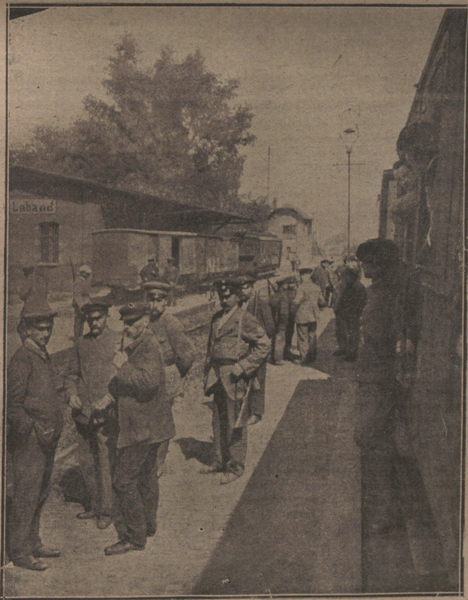
LOS SUCESOS DE LA ALTA SILESIA.—Paso de un tren militar francés por una estación ocupada por los insurrectos polacos en la línea de Gleiwitz a Oppeln.

Que Francia ejerce ya en Tánger la dirección de las administraciones del Estado y monopolios... Esto debiera callárselo porque es el ejemplo vergonzoso de la más inaudita usurpación. ¿En nombre de qué Tratado hizo en Tánger la intromisión de su poder