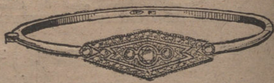
Núm. 2.—5 brillantes y diamantes. Pesetas 450.