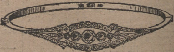
Núm. 4.—5 brillantes y diamantes. Pesetas 625.