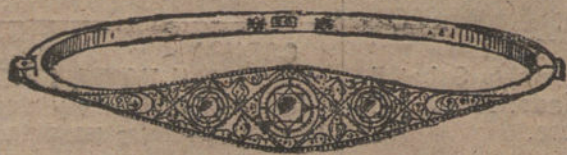
Núm. 5.—3 brillantes y diamantes. Pesetas 750.