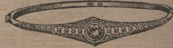
Núm. 6.—9 brillantes y diamantes. Pesetas 875.