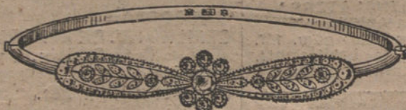
Núm. 3.—11 brillantes y diamantes. Pesetas 575.