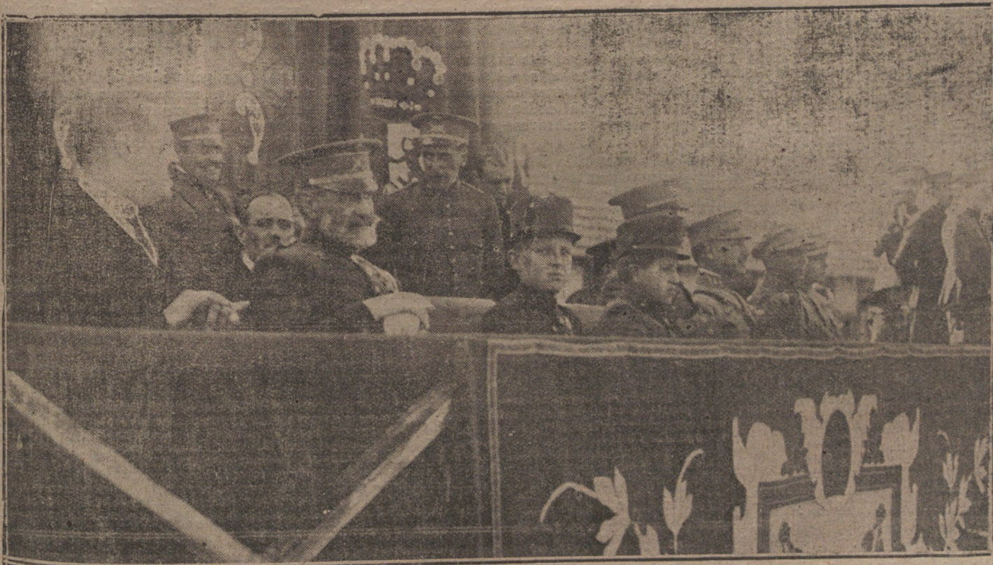
Príncipe de Asturias y el Infante don Jaime, pronunciando el festival gimnástico militar celebrado en el campo del A. de C.

Cuando se detuvo el tren, los desconocidos pusieron a parte seis vagones que contenían aprovisionamientos y vestidos destinados a los soldados ingleses, y, después de rociarlos con petróleo, los incendiaron. Quedaron totalmente destruidos con todo lo que llevaban.—Radio.