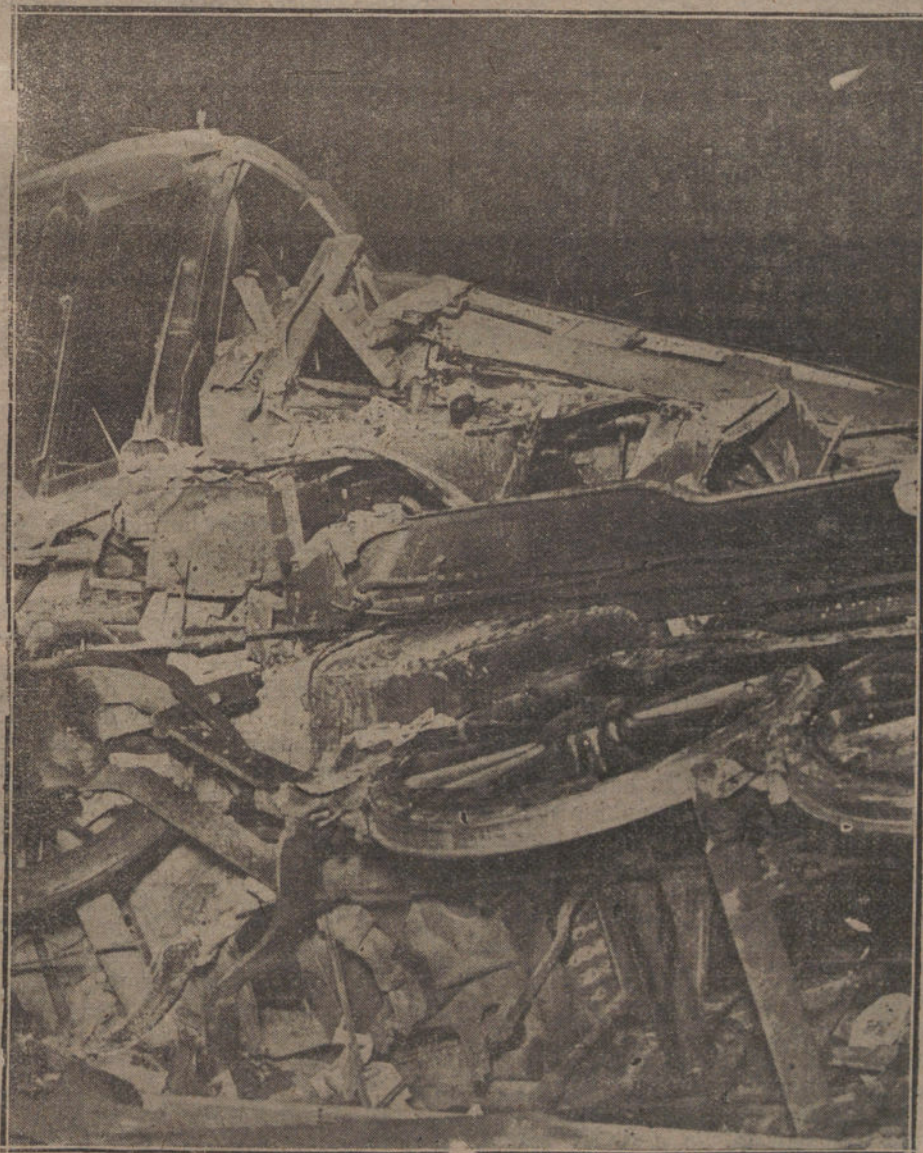
La máquina del expreso de Andalucía, destrozada al chocar contra el vagón de primera del tren de Toledo, donde hubo más víctimas.

A iguales elogios se ha hecho acreedor el ambulante de Correos que iba a Sevilla, otra víctima del deber; muchos viajeros de este mismo tren, que sobreponiéndose a la terrible impresión, prestaron los primeros auxilios; el Cuerpo de bomberos, que salió en seguida de Madrid, cooperando eficazmente a los trabajos de salvamento; el personal de la Compañía, que se desvivió por atender a los heridos, y el pueblo de Villaverde, que durante toda la noche del sábado y el día de ayer ha estado prestando señalados servicios.