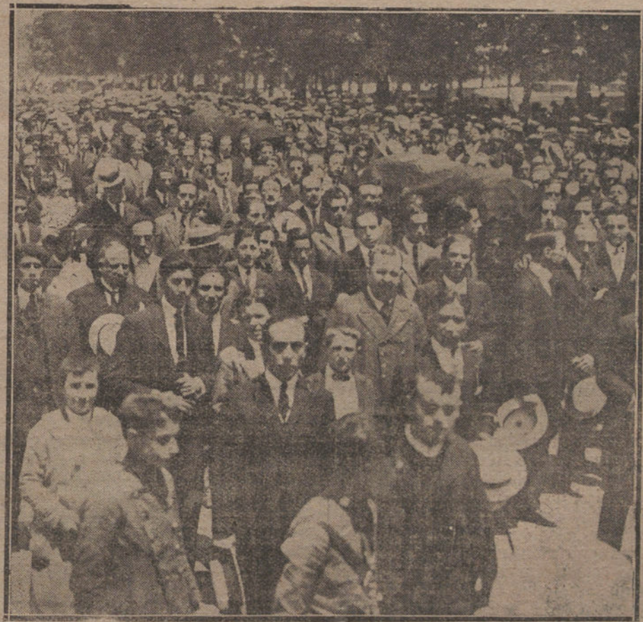
LA CATASTROFE DE VILLABERDE.—Los féretros que, con los restos de los ambulantes muertos en la catástrofe, conducidos a hombros de sus compañeros del Cuerpo, durante el entierro, que ha constituido esta mañana una imponente manifestación de duelo.

Dirigirse: Librería Fernando Fé, Puerta del Sol, 15.