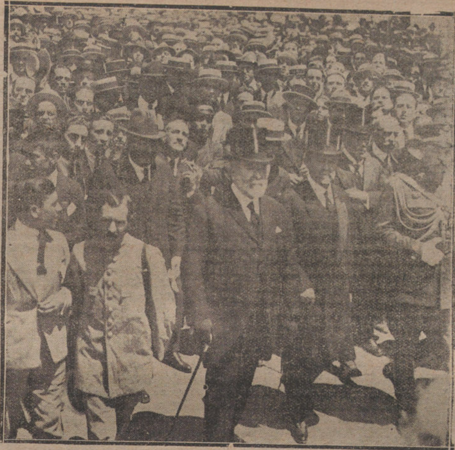
LA CATASTROFE DE VILLABERDE.—La representación de Su Majestad el Rey, el director de Comunicaciones y los ministros de Gobernación y Fomento, en la presidencia del entierro de los ambulantes de Correos.