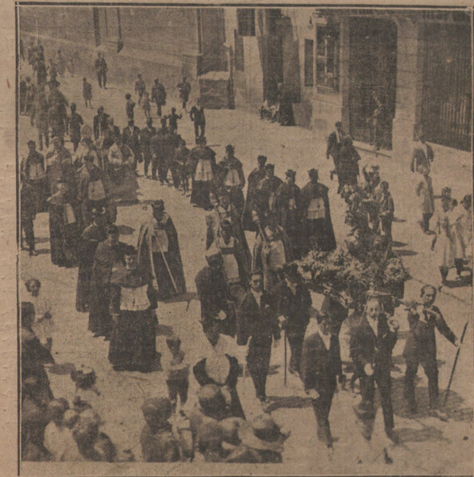
EN LOGROÑO. La procesión cívico-religiosa de San Bernabé celebrada en conmemoración del IV centenario del sitio de la ciudad.

«Hablemos entonces del sistema de Bélgica»—volvía a decir el ministro, y