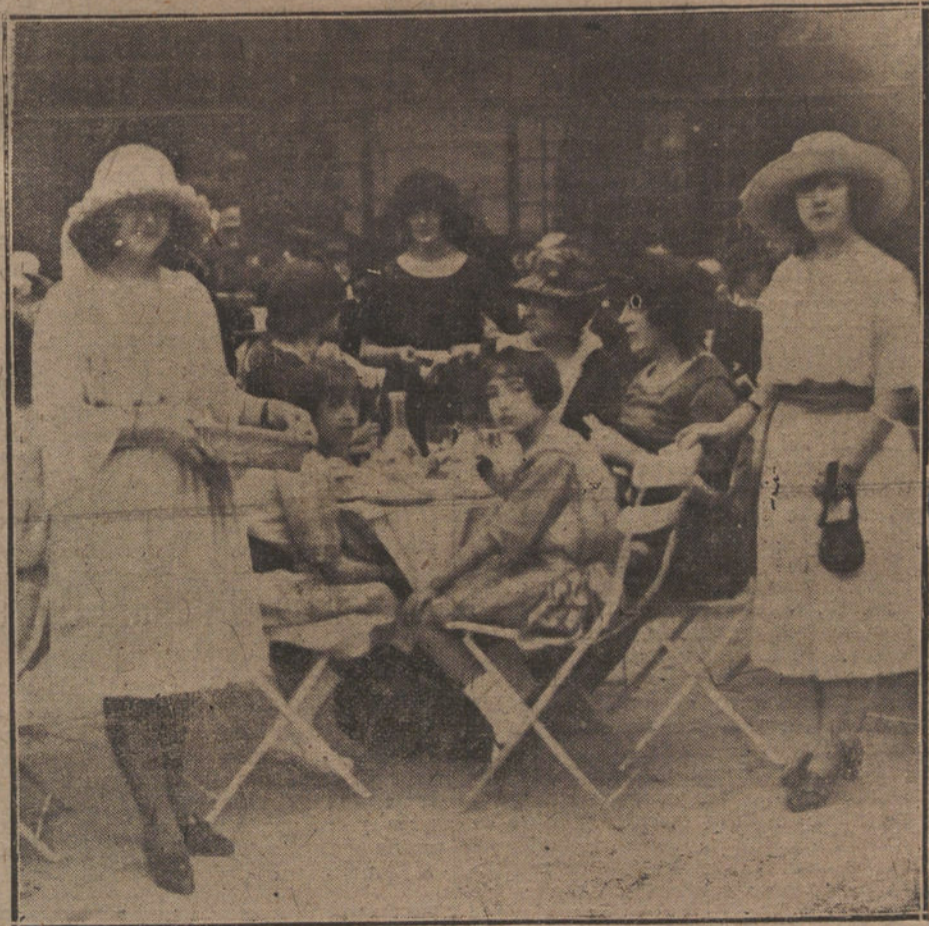
Un aspecto de la fiesta celebrada ayer en Parisiana a beneficio del Taller de Santa Victoria.

En conjunto, se han practicado nueve detenciones, y en los registros hechos a consecuencia de estas detenciones se han descubierto papeles comprometores.—Radio.