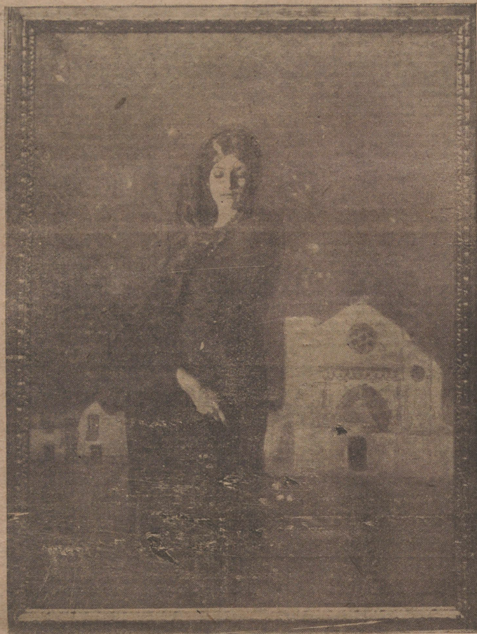
«La Soleá», cuadro de Gustavo Bacarisas.

Necesitábamos hacer las aclaraciones precedentes para sentar ahora la afirmación de que Gustavo Bacarisas es un pintor personalísimo. Una cosa son los elementos que ayudaron a formarlo, y otra muy distinta las analogías que se afanan en buscar aquellos que ejercen una crítica comparativa. Bacarisas, en la actualidad—y no me refiero al momento del artista, sino al momento de su presentación ante el público de Madrid—es sólo Bacarisas. Un pintor enamorado de la luz y el color, que con tan útiles y bellos motivos pictóricos se propone lograr esa fuerte emoción que hasta ahora parecía reservada a los pintores de tonos trágicos.