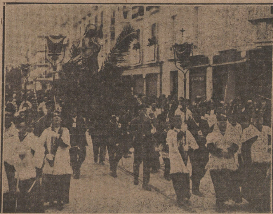
FIESTAS RELIGIOSAS EN SAN SEBASTIAN.—Procesión homenaje al Sagrado Corazón de Jesús.

Para obsequiar a los congresistas se está organizando una excursión a los alrededores de la ciudad, donde se celebrarán festivales regionales.