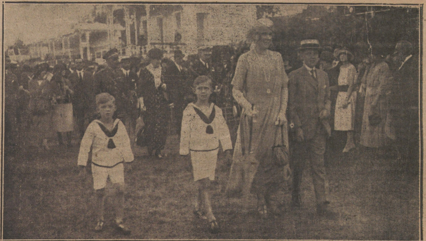
EN EL HIPODROMO DE LA CASTELLANA.—S. M. la Reina Doña Victoria paseando con sus augustos hijos por la «pelouse», durante las carreras de caballos celebradas ayer.