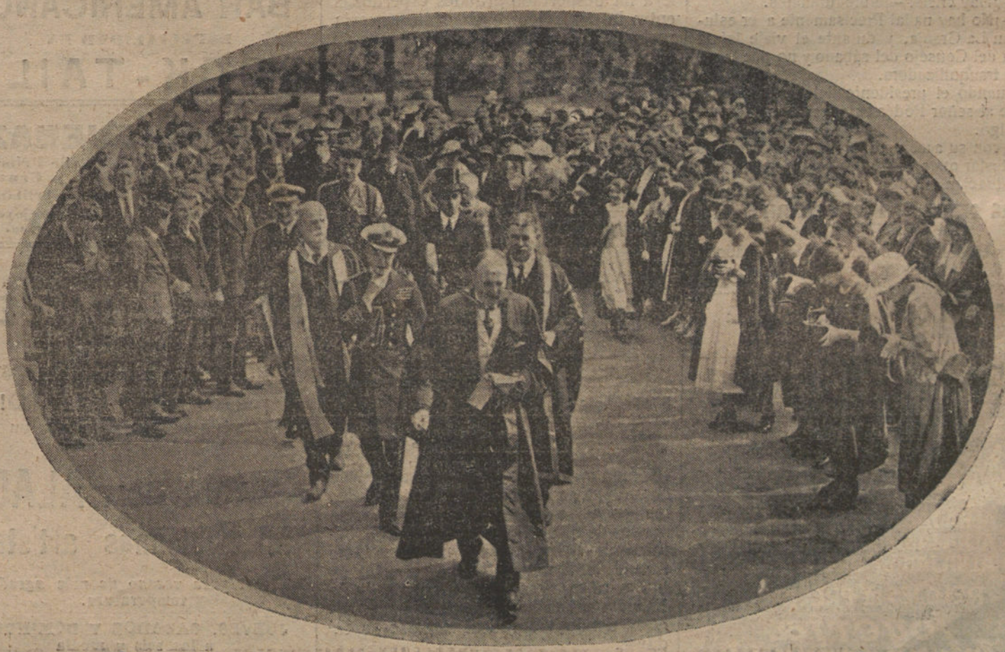
DEL VIAJE DEL PRINCIPE DE GALES.—Recibimiento dispensado al Principe de Gales en Cardiff por los ministros y autoridades universitarias.

Vienen a continuación unas líneas de censura por los días perdidos en el Parlamento, que más bien parecen escritas para atenuar el efecto de lo que antecede, y en seguida, para que el ministro de Fomento no pueda suponer