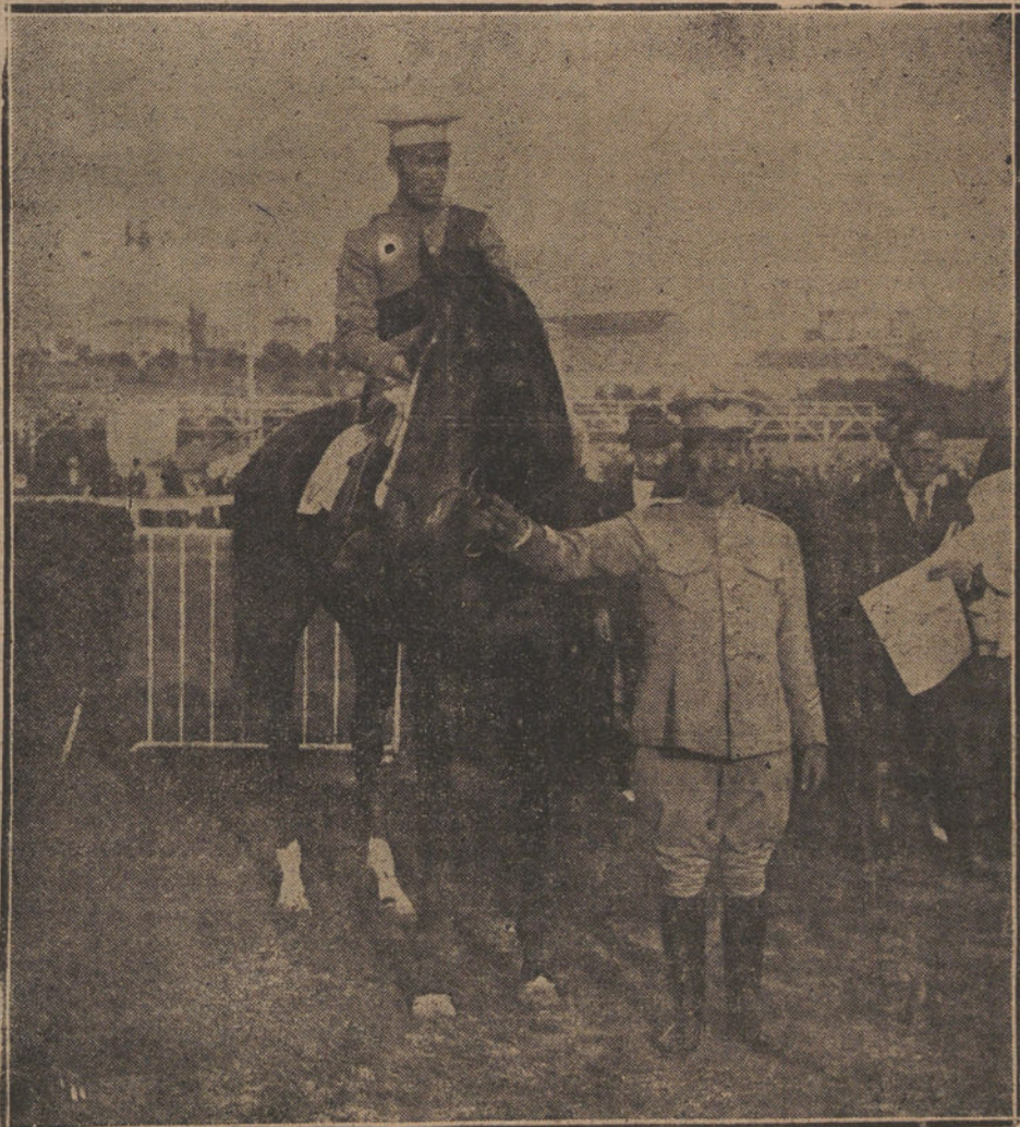
AYER EN EL HIPODROMO.—El caballo «Emission», del marqués de los Trujillos, que ganó la carrera militar.