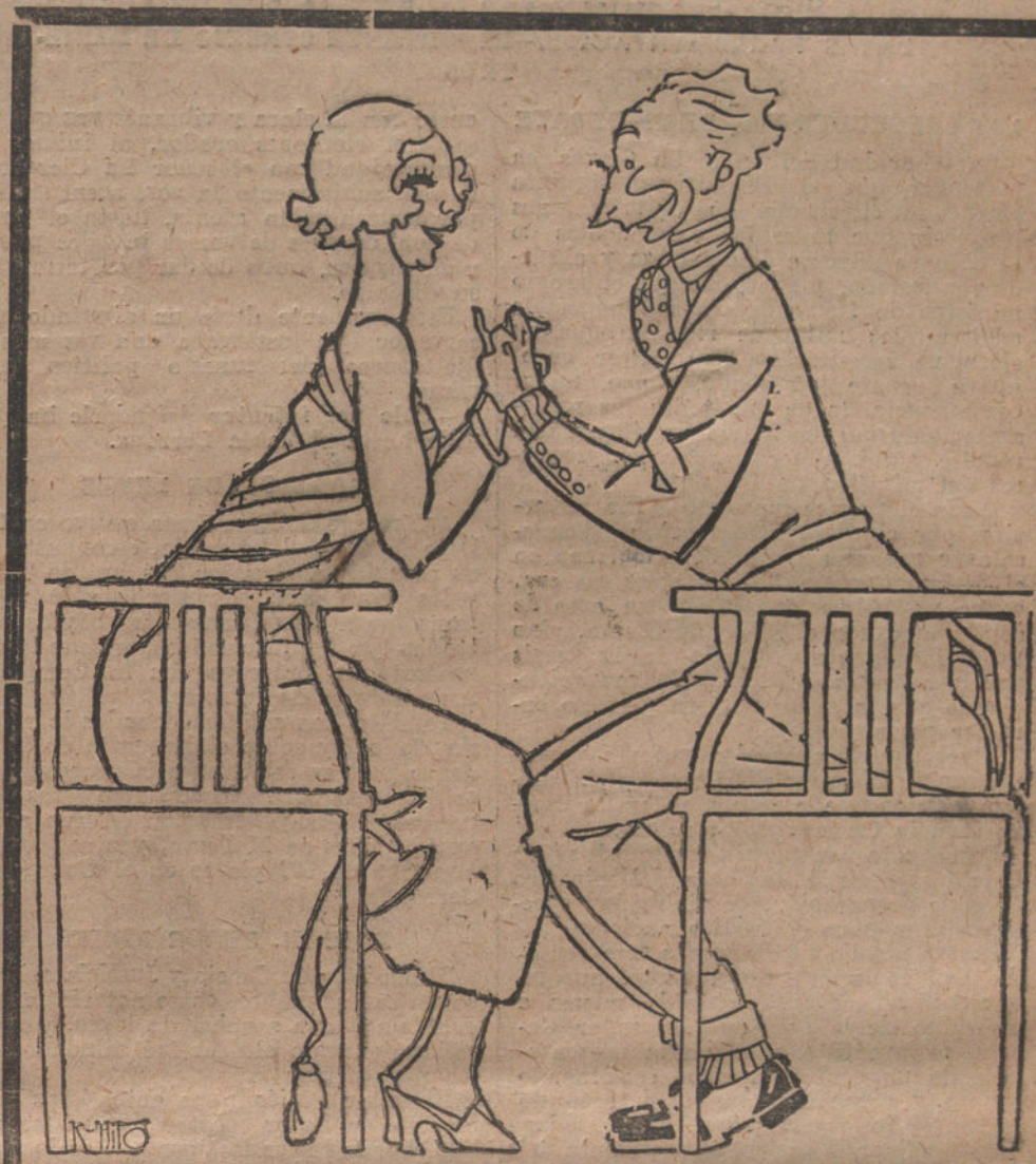
CASTILLOS EN EL AIRE

Nuestra responsabilidad en cualquier caso está salvada. Hemos dicho, decimos y seguiremos diciendo, que el ciervismo es sólo una perturbación, una perturbación por todo y en todo.