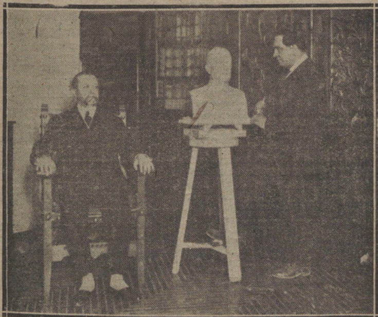
El ministro de la Gobernación posando ante el laureado escultor señor Campo, que le hizo un busto recientemente

CRANSAC. Se ha producido un desmoronamiento que ha ocasionado la muerte de tres obreros, dos de ellos españoles.—Radio.