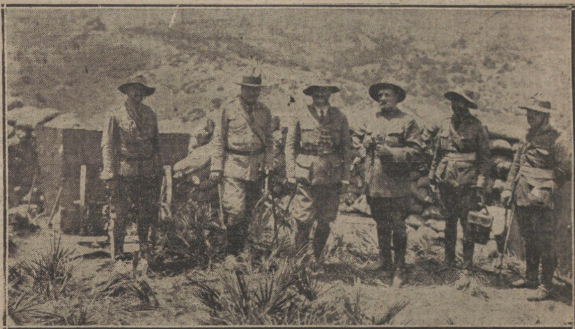
LAS ÚLTIMAS OPERACIONES EN MARRUECOS. —Los generales Berenguer, Manzano y Marzo en la posición de Koba el Kosal, dirigiendo la marcha de las operaciones.

Esa quiebra, se ha declarado en estos días, y han sido vanos los esfuerzos llevados a cabo por el Gobierno chino para atajar el desastre. El Gabinete de Pekín envió a París delegados especiales, que se pusieron al habla con los grandes establecimientos de crédito de Francia y con el Gobierno de la República. Por medio de esos delegados, China llegó a ofrecer la garantía de