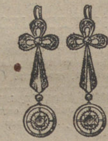
Núm. 2.—Pendientes brillantes y diamantes. Ptas. 475.