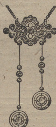
Núm. 3.—Pendiente 11 brillantes y diamantes. Ptas. 975.