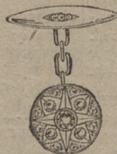
Núm. 10.—Gemelos 10 brillantes y diamantes. Ptas. 400.