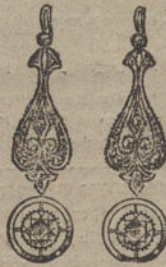
Núm. 4.—Pendientes 4 brillantes y diamantes. Ptas. 575.