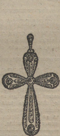
Núm. 1.—Cruz 5 brillantes y diamantes. Ptas. 400.

Con brillantes de primera calidad :-: Diamantes rosas de Holanda Monturas de platino fino y oro de ley 18 quilates contrastado