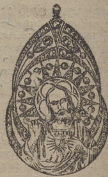
Núm. 5.—Medalla 16 brillantes y diamantes. Ptas. 475.