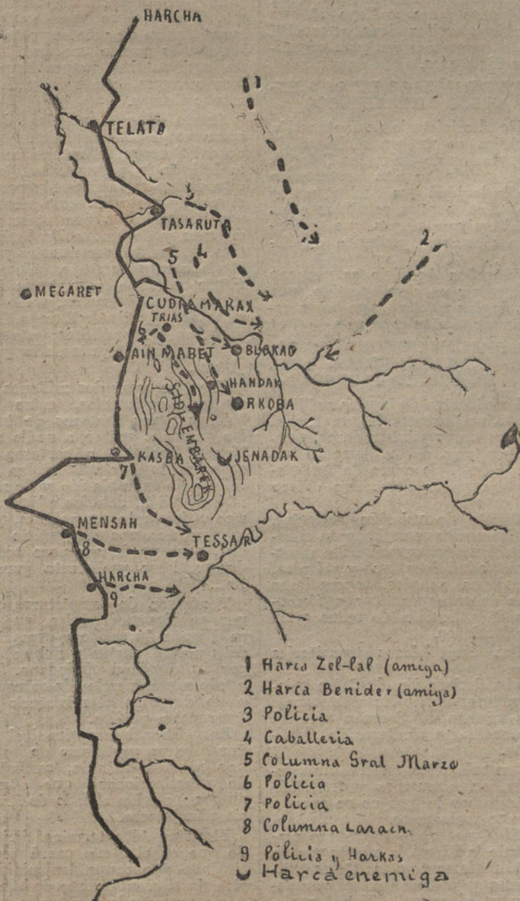
Gráfico de la operación del 6 de julio, que indica el avance de las columnas y posiciones ocupadas. El trazo grueso continuo señala la línea nuestra más avanzada.

CONSTANTINOPLA. En algunos círculos nacionalistas se piensa en preparar un terreno favorable para entablar negociaciones con Inglaterra, para lo cual se intentará la firma de un acuerdo redactado en un sentido análogo al Tratado ya concertado con Francia e Italia. En Angora se ha reorganizado