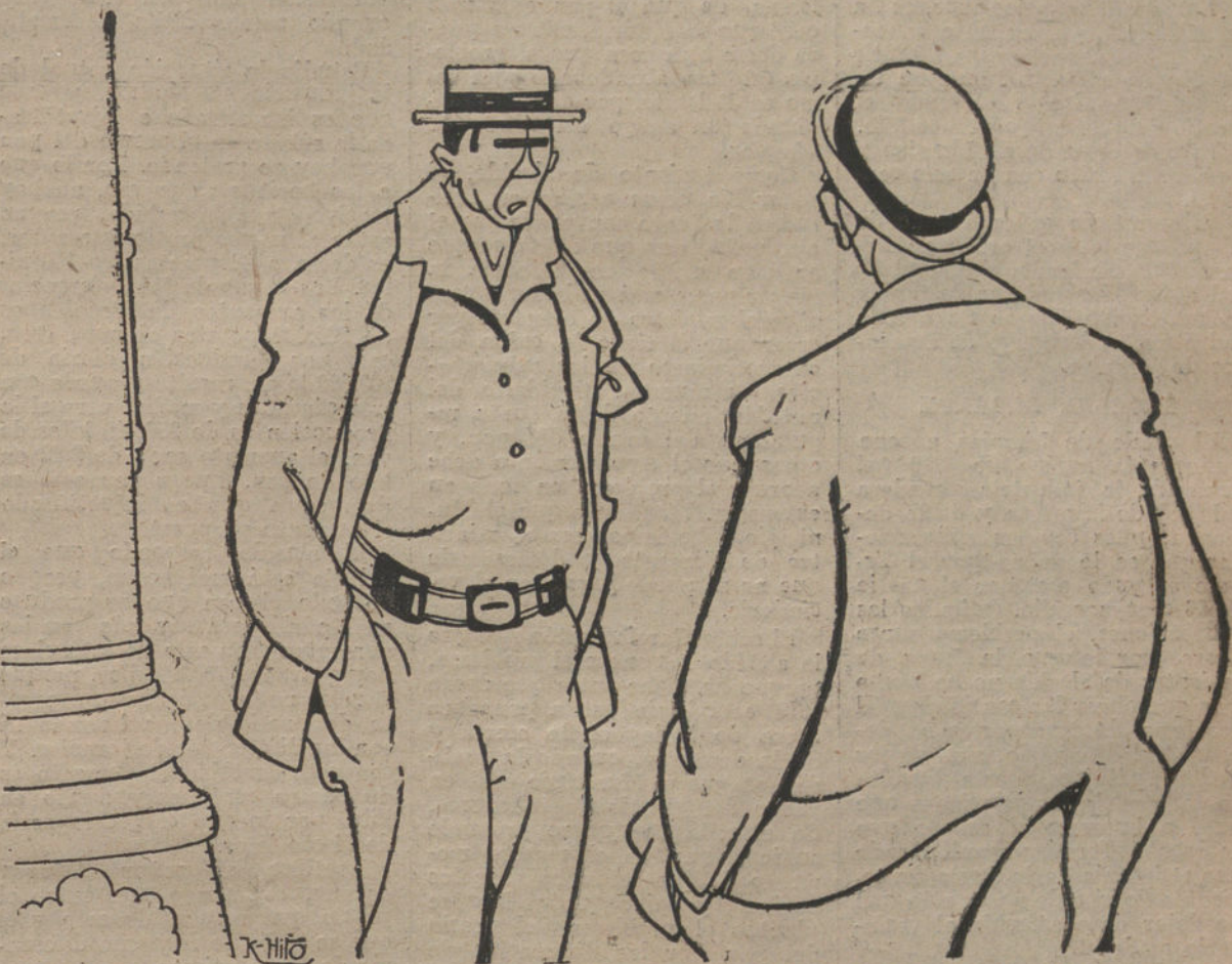
TODO ESTA CARO

Pero pronto dió sus naturales consecuencias tan desdicha-