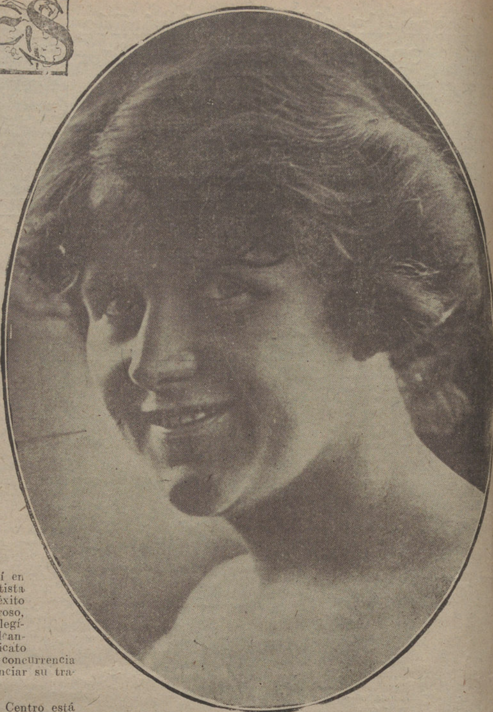
LAS FIGURAS DE LA PANTALLA.—Euse Frolich, de la «Nordisk Film», de Copenhague.