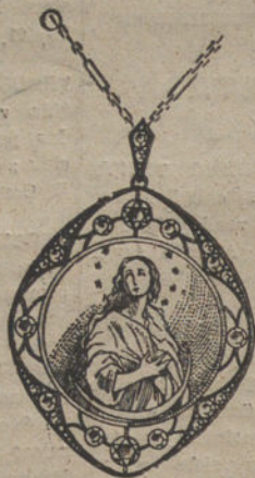
Núm. J. 1.372. --- Medalla oro, platino y nácar, con 8 brillantes y 14 rosas. Pesetas 585.