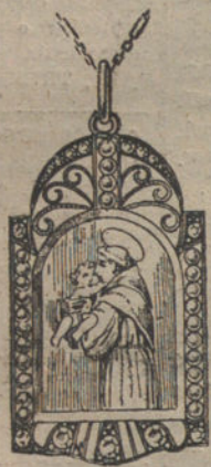
Núm. J. 3.459. --- Medalla «San Antonio», oro y platino, perlas, rosas y nácar. Pesetas 225.