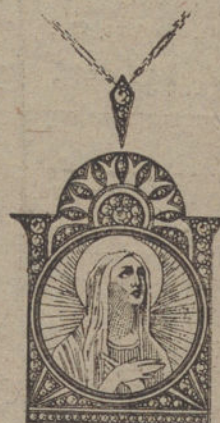
Núm. J. 1.285. --- Medalla platino y nácar, con 67 rosas. Pesetas 550.

30 por 100 de economía sobre las demás casas