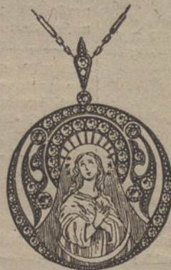
Núm. J. 1.370. --- Medalla oro, platino y nácar, 5 brillantes y 42 rosas. Pesetas 475.