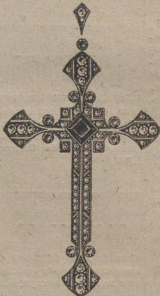
Núm. J. 2.311. --- Cruz platino, 65 brillantes y un zafiro. Pesetas 1.750