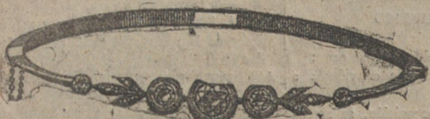
Núm. J. 2.257.—Pulsera oro y platino, 5 brillantes y 6 rosas. Pesetas 810.