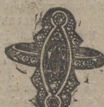
Núm. J. 3.100.—Sortija oro y platino, un zafiro, 2 brillantes y 14 rosas. Pesetas 360.