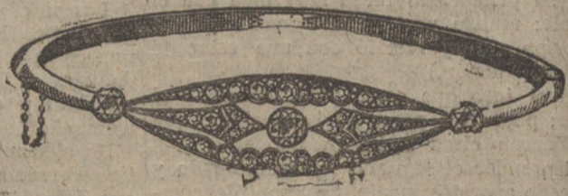
Núm. J. 1.409.—Pulsera oro y platino, 5 brillantes y 88 rosas. Pesetas 1.050.

Factura de garantía en todas las compras :-: Venta al por mayor y menor :-: Envíos por correo a todas partes remitiendo su importe