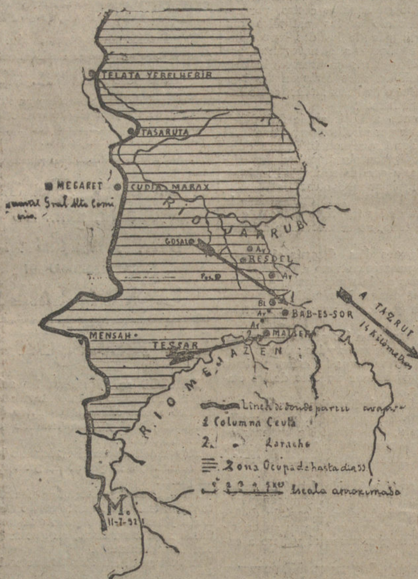
Croquis del campo de operaciones, con indicación del avance de las columnas y zona conquistada los días 6 y 11 de julio.

Nuevos detalles de cómo operaron las tropas. Fortificación de las posiciones.