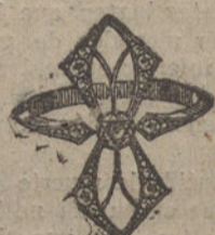
Núm. J. 2.788.—Sortija oro y platino, un brillante y 14 rosas. Pesetas 150.