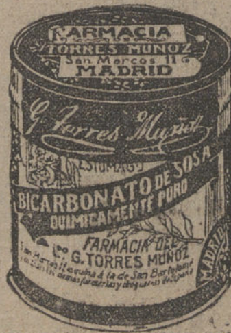
LATAS ECONOMICAS DE 1 X KILOS

En la Admini- stración de «La Tribu- na» se reciben es- quelas hasta las cinco de la tarde.