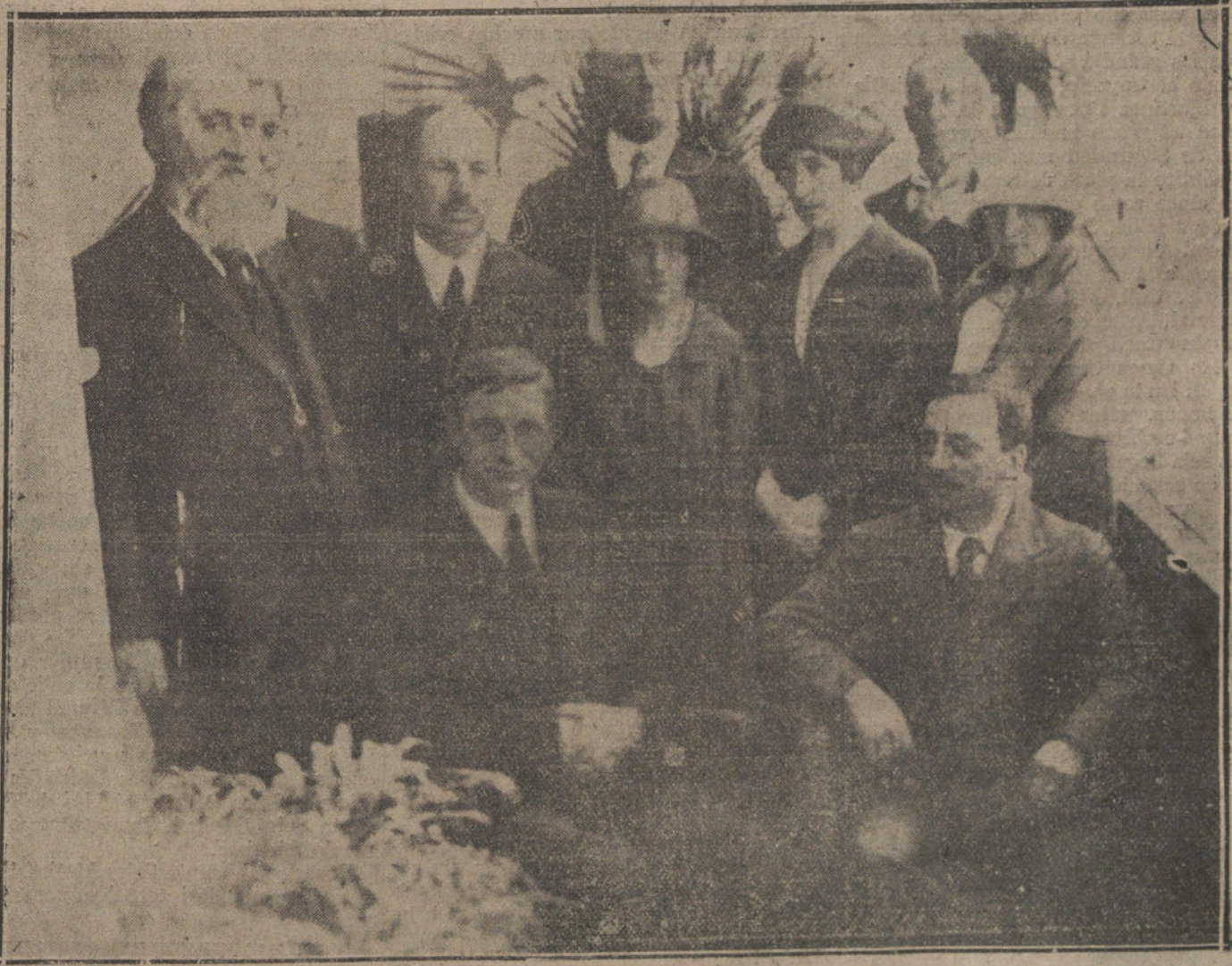
Mr. De Valera (1) y Mr. Griffith (2) con los delegados de Dublín, que han ido a Londres para celebrar una conferencia y entablar negociaciones entre Dublín y la capital inglesa.